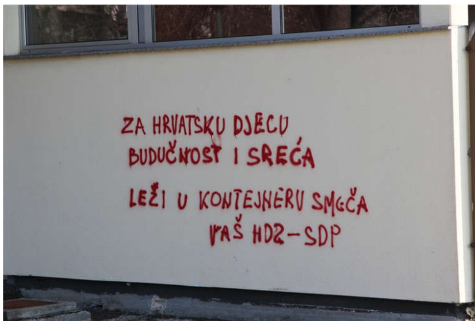
Sl.9.: Grafit u Slavonskom Brodu 2018. godine