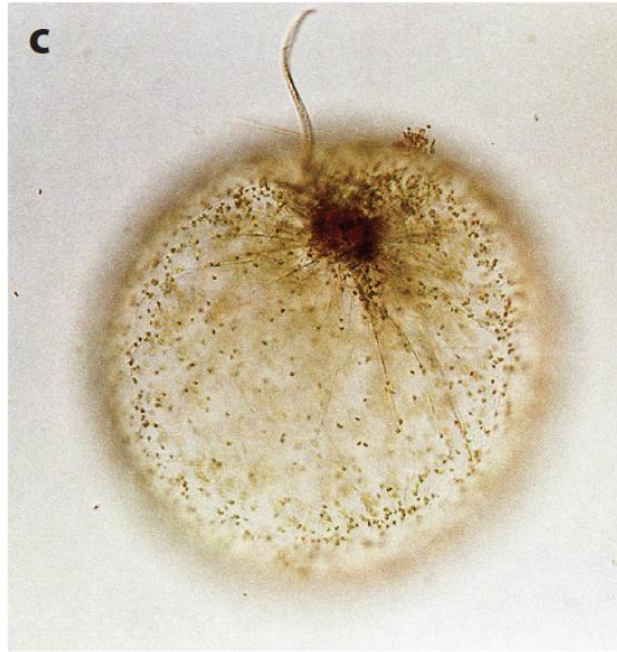
Slika 2 – Endosimbiont Protoeuglena noctilucae unutar stanice Noctiluca scintillans .

Time su pokazali da D. mitra može fagocitirati razne skupine cilijata i da podržava simbiozu s plastidima različitih vrsta algi.