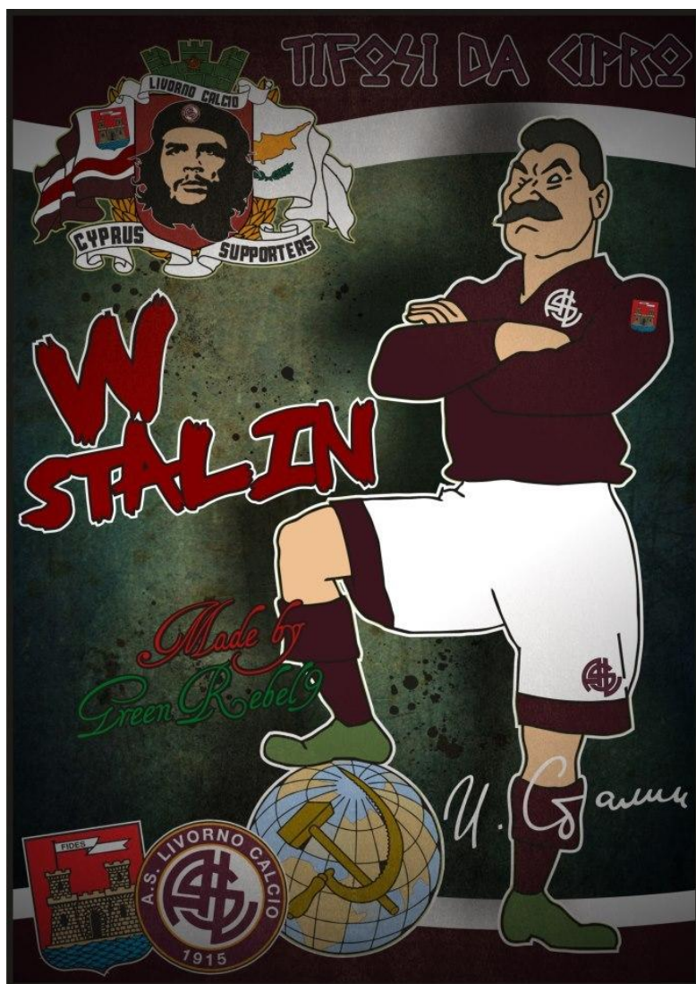
Sl.2. Karikatura Josipa Staljina u Livornovom dresu izrađena od strane navijača Livorna iz Cipra „Tifosi da Cipro“