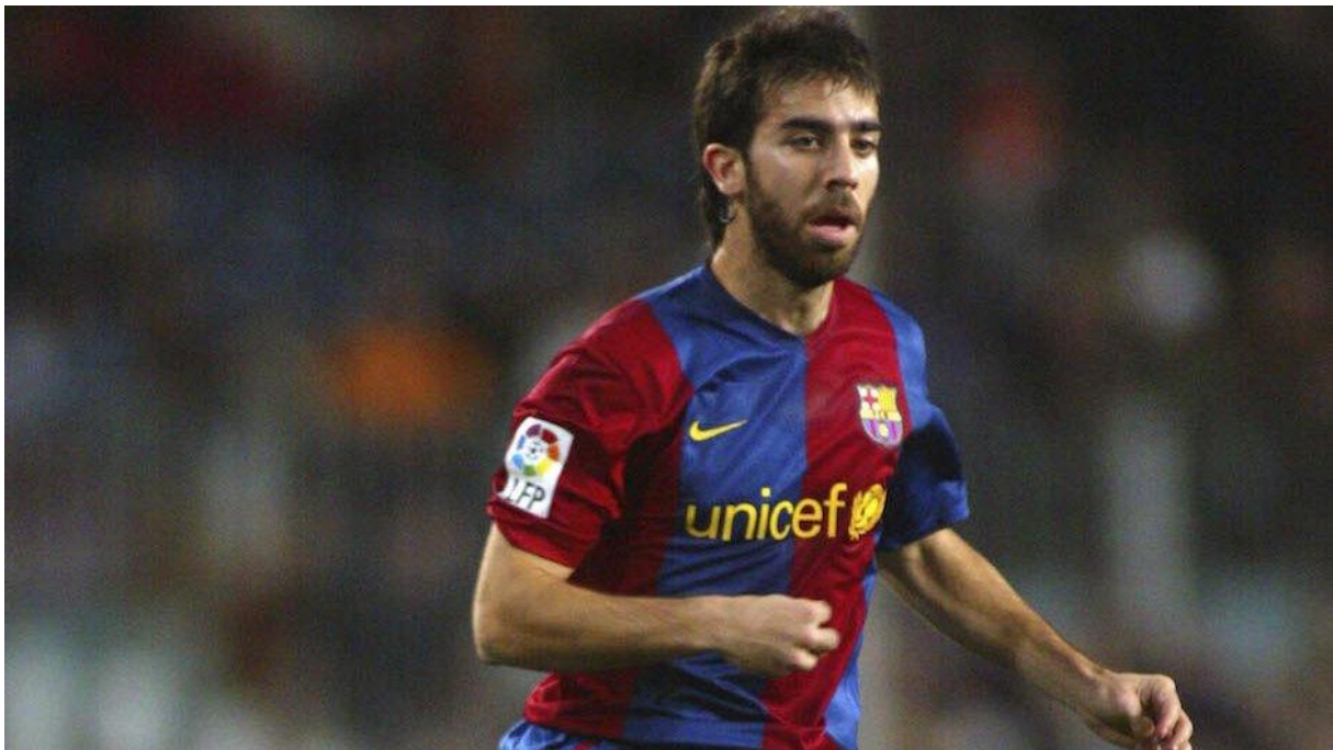
Sl.7. Oleguer Presas, bivši nogometaš FC Barcelona, nakon nogometnog umirovljenja postao je aktivni političar i borac za neovisnost Katalonije

nogometnoj sceni zbog istaknutih prokatalonskih političkih stavova koje zastupa u španjolskoj javnosti. Dok je s katalonske strane zbog toga dobio široku popularnost, gotovo cijela Španjolska mu to zamjera. Iako je Pique bio standardan dugogodišnji član španjolske nogometne reprezentacije, zbog brojnih prijetnji, konstantnih zvižduka i dobacivanja na utakmicama Barcelone i reprezentacije, odlučio se oprostiti i umiroviti svoj nacionalni dres nakon posljednjeg Svjetskog nogometnog prvenstva u Rusiji.