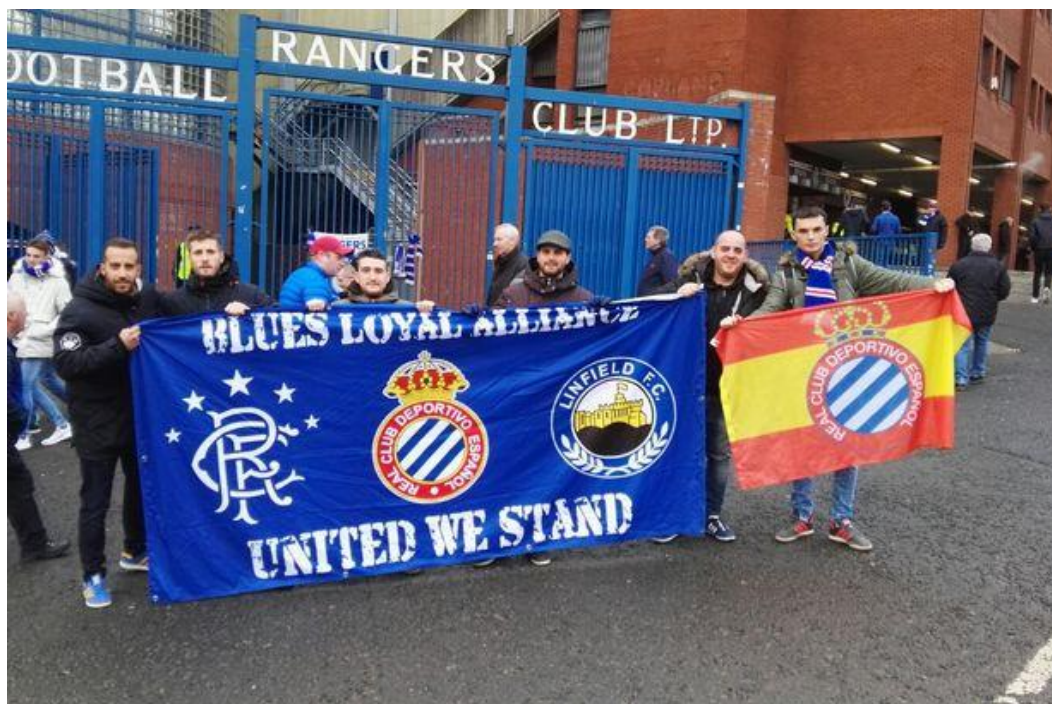
Sl.10. Navijači Espanyola ispred stadiona Ibrox poziraju s domaćim navijačima FC Glasgow Rangersa

Prijateljstva Espanyolovih navijača s navijačkim skupinama drugih klubova temeljena su na jednakoj ili sličnoj političkoj ideologiji i orijentaciji koju slijede i implementiraju. Kao što je već prije navedeno, Espanyolovi navijači prezentiraju svoju ideologiju nacionalizma i vjerni su španjolskoj kruni i naciji što reproduciraju na domaćoj i internacionalnoj navijačkoj sceni. Slijedeći takve ideale i postulate sklopili su prijateljstva s navijačima škotskog FC Glasgow Rangersa i sjevernoirskog FC Linfielda. Rangersovi navijači deklariranog su desnog političkog pogleda i protestanske vjeroispovijesti. Oni su izraziti lojalisti, unionisti, odnosno pobornici integriteta Škotske u jedinstveno Ujedinjeno Kraljevstvo. Rangersov najveći rival je momčad iz istoga grada, Celtic FC. Celtic je klub prognane irske zajednice, a njegovi su navijači lijevo politički opredijeljeni te promiču liberalne, antifašističke i humanitarne vrijednosti. Oni se bore za neovisnost Škotske i prijateljska su skupina s navijačima FC Barcelone, a oni žele odcjepljenje Katalonije. Espanyolovi navijači nerijetko odlaze na utakmice FC Glasgow Rangersa i zajedno navijaju s njihovim navijačima, poznatim Union Bearsima. Uglavnom postoje bliske veze između ova dva kluba i njihovih navijača.