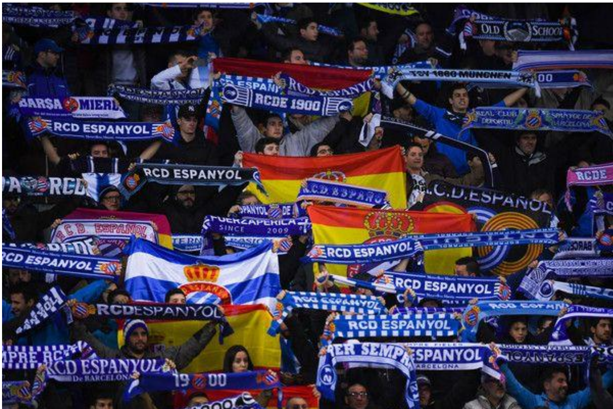
Sl.9. Navijači RCD Espanyola na svom stadionu sa španjolskim zastavama

pružajući i manifestirajući svoju podršku i priklonjenost Španjolskoj. Njihova razina prostornog identiteta je nacionalna, ali i regionalna. Oni se jednako osjećaju Kataloncima kao i Španjolcima, dok se navijači FC Barcelone isključivo i jedino identificiraju kao Katalonci, ne smatrajući sebe Španjolcima. Espanyolovi navijači na utakmicama svoj prostorni identitet rekonstruiraju isticanjem brojnih španjolskih zastava i simbola te pjevanjem pjesama izrazito nacionalnih konotacija. Španjolske zastave u puno su većem broju prikazane na Espanyolovom stadionu, no neki njegovi navijači znaju nositi i katalonske zastave. Navijači Espanyola optuženi su da namjerno pokušavaju destabilizirati kretanje regije prema neovisnosti. Veliki dio Barcelonine navijačke baze gledao je svoje katalonske susjede kao podupiratelje diktature generala Franca (1939-1975) čiji je režim prezentirao španjolski nacionalizam kao jednu od svojih osnova. Tijekom španjolskog građanskog rata (1936.-1939.) znatan broj Espanyolovih navijača pridružilo se Francovom pokretu falange koji podupire jedinstvo Španjolske i uklanjanje regionalnog separatizma. U očima Barceloninih navijača, navijanje za Espanyol smatra se antikatalonski (Rodway, 2016).