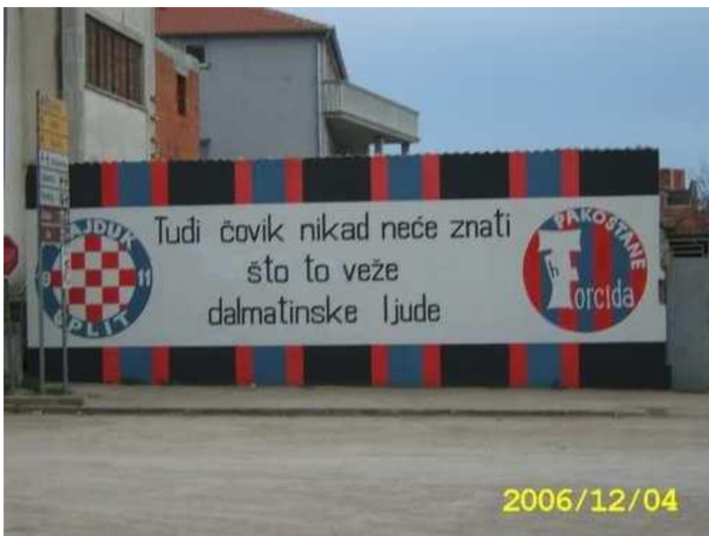
Sl.1. Grafit posvećen Hajduku u dalmatinskom mjestu Pakoštane