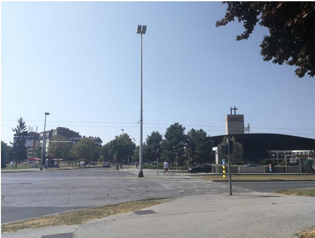
Sl. 5. Jarun (križanje Horvaćanske ulice i ulice Hrgovići)

kupalištem. Do kraja 90-ih godina 20. stoljeća Jarun je bio potpuno formiran. Početkom 21. stoljeća Jarun je dobio i plin zahvaljujući stambenoj gradnji koja se proširila na južni i jugoistočni dio (mapiranje Trešnjevke - Jarun, 2016). Danas glavnu atrakciju ovog kvarta čini sportsko rekreacijski centar Jarun na kojem svakodnevno velik broj ljudi provodi svoje slobodno vrijeme te je značajna crkva Sveta Mati Slobode koja okuplja veliki broj vjernika.