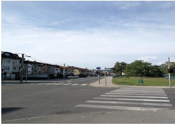
Sl. 12. Rudeš – križanje Rudeške ceste i Anine

kod ugla Zagrebačke avenije i Zagrebačke ceste, Kaufland na uglu Rudeške ceste i Zagrebačke avenije te mnoge trgovine, gostionice i restorani (mapiranje Trešnjevke – Rudeš, 2016).