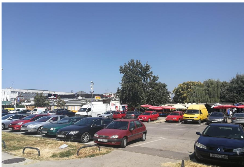
Sl. 14. Tržnica Jarun na Staglišću