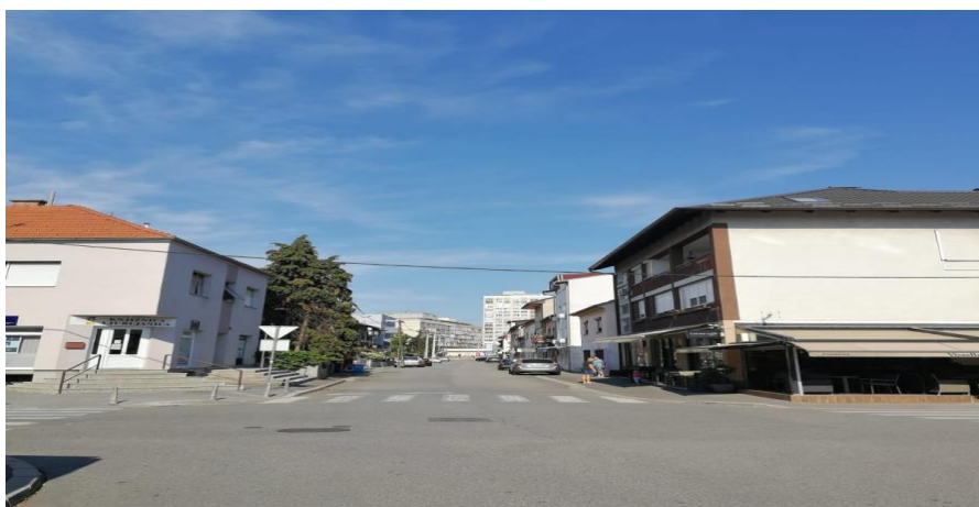
Sl.7. Ulica Ljubljana