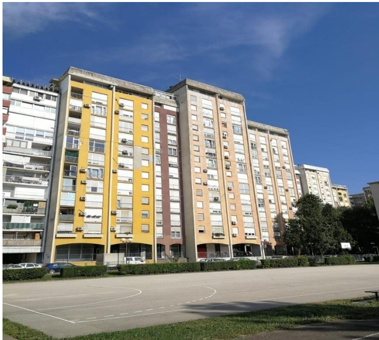
Sl. 16. Voltino ('papagajke')

Voltino je kvart omeđen na sjeveru željezničkom prugom, na zapadu potokom Kustošakom i Zagrebačkom ulicom, na istoku potokom Čnomercem te na jugu Baštijanovom ulicom. Gradnja u Voltinom počinje 30-ih godina 20. stoljeća izgradnjom preteče elektroindustrije Končar uz potok Čnomerec. U 70-im godinama 20. stoljeća gradi se kompleks zgrada na uglu Baštijanove i Golikove ulice poznat kao 'papagajke' (zbog različitih boja zgrada). S vremenom se Končar širio na susjedne parcele tako da su neke susjedne ulice potpuno nestale i moguće ih je pronaći tek na starim kartama. Od obrazovnih ustanova u naselju se nalazi Osnovna škola 'Voltino' te Strojarska tehnička škola Frana Bošnjakovića. U istoj zgradi gdje je Strojarska tehnička škola, 1998. godine osnovano je Tehničko veleučilište u Zagrebu (TVZ). Od javnih sadržaja na prostoru naselja nalazi se dječji vrtić 'Zvončić' i knjižnica Voltino. Na području Voltino naselja nalaze se površine koje su trenutno izvan upotrebe kao što je nekadašnje skladište Ferimporta te skladište poduzeća Šuma koje još uvijek radi iako u vrlo ograničenom tempu (mapiranjeTrešnjevke – Voltino, 2016).