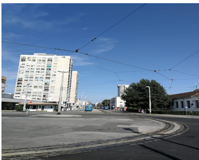
Sl. 8. Remiza – okretište tramvaja

Iz tog razloga možemo reći kako su prostori Ljubljane i Remize (Vurovčice) međusobno srasli u jedinstvenu cjelinu. Remiza se prostire od Ozaljske ulice na sjeveru do Zagrebačke avenije na jugu te od potoka Črnomerec na zapadu do Selske ceste na jugu. Na prostoru Remize nalazi se okretište i spremište tramvaja i autobusa te poslovna zona ZET-a.