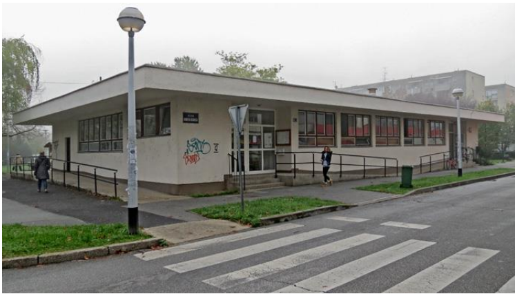
Sl. 6. Dom zdravlja – Albaharijeva (Knežija)

blizini Savske ceste te se ono protezalo prema Srednjacima. Urbani razvoj naselja počinje pred Drugi svjetski rat kada se gradi crkva Župa Marije Pomoćnice. Izgradnjom 'autoputa' krajem 40-ih godina 20. stoljeća naselje se odjeljuje od Stare Trešnjevke. U 60-im godinama 20. stoljeća gradi se kompleks novih zgrada i novo naselje dobiva ime Knežija. Staro ime Horvati polako gubi na značaju i upotrebljava se samo za krajnji jug naselja oko Horvaćanske ceste (mapiranje Trešnjevke - Knežija, 2016). Na području Knežije nalazi se Osnovna škola Matije Gupca, objekti Doma zdravlja u Bićanićevoj i Albaharijevoj. U Ulici Ćire Truhelke, pored željezničke pruge, nalazi se mini-autodrom. Na južnom dijelu kvarta nalazi se Studenski dom 'Stjepan Radić', Kineziološki fakultet te ŠRC Mladost koji se nalazi na graničnom području s Jarunom.