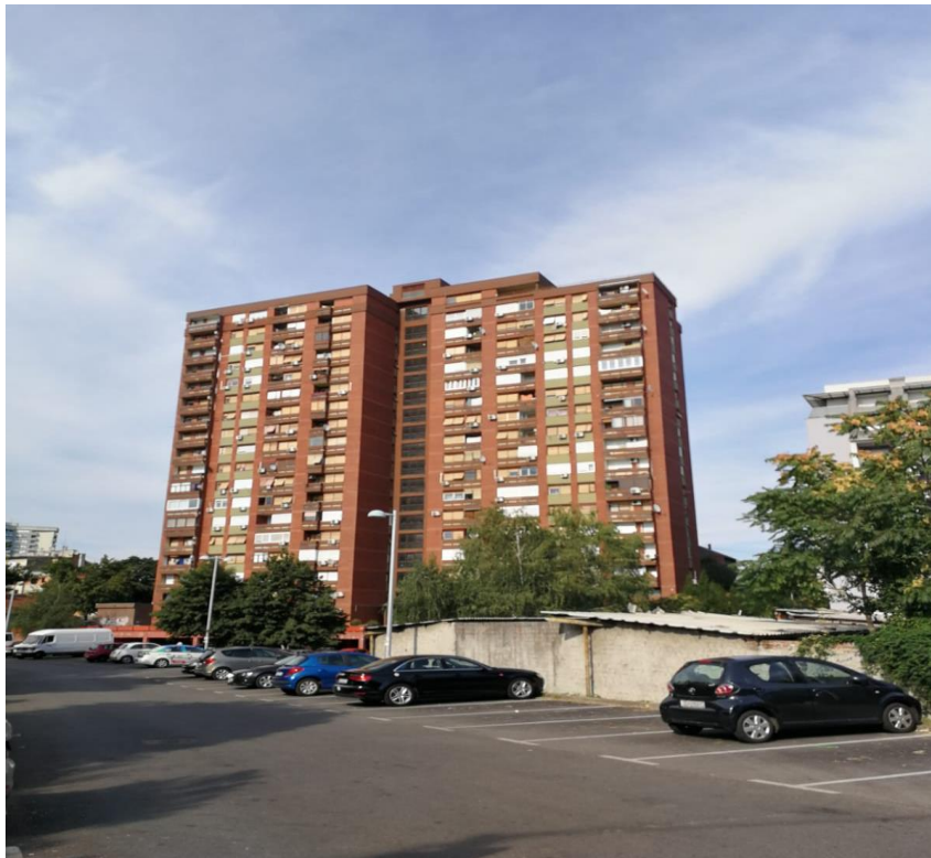
Sl.2. Neboder Ciglenica

teritoriju grada. Razvoj ciglana omogućio je potok Kunišćak te glinovito tlo. Po izgradnji industrijske ciglane Adolfa Mullera na Črnomercu te male ciglane su prestajale s radom i polagano su propadale. Najstariji objekat na tom području je željeznička pruga sagrađena 1862. godine. Oko 1870. godine se prvi put spominje Magazinska cesta kao cesta kojom je s gradom povezivano crpilište tadašnjeg vodovoda i čiji je nastavak današnja Zagorska cesta. Kod raskršća Zagorske i Selske ceste je 1921. godine izgrađen blok gradskih zgrada namijenjenih radnicima i to je bio jedan od prvih projekata takvog tipa u Zagrebu i prvi na Trešnjevci. Ovaj prostor je još u drugoj polovici 19. stoljeća bio predviđen za smještaj industrije, skladišta te radničkih nastambi. Ostatak kvarta je tokom vremena popunjen izgradnjom obiteljskih kuća. Na Ciglenici se danas nalazi područni objekt dječjeg vrtića Bajka, zdravstvena stanica u Zagorskoj ulici, neboder Ciglenica (jedna od najviših zgrada na području Trešnjevke). Na potezu Selska/Zagorska/Meršićeva nalazi se i Dječji dom te prostori Akademije likovnih umjetnosti, a južno od njih park s dječjim igralištem, spomenikom palim borcima NOB-a te skulpturom Zdenac mladosti. Od drugih zanimljivosti vrijedi istaknuti prugu Samoborčeka koja je prolazila rubom kvarta i imala veliku transportnu važnost u svoje vrijeme (mapiranjeTrešnjevke-Ciglenica, 2016).