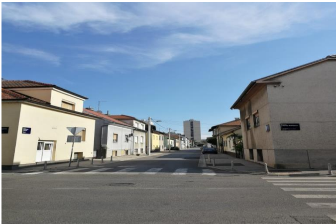
Sl. 9. Pongračevo

Pongračevo je kvart omeđen sa sjevera Klanječkom ulicom te trasom 'Samoborčeka' do Selske ceste, s zapada potokom Črnomercem, s istoka Selskom cestom te s juga Ozaljskom ulicom. To zemljište je do kraja 20-ih godina 20. stoljeća bilo u vlasništvu celjske obitelji Pongratz po kojem kvart dobiva ime. Oni su tada prodali zemljište gradu, a grad je na njemu počeo graditi više naselja namijenjenih radnicima (mapiranje Trešnjevke – Pongračevo, 2016). Prvenstveno su se gradila naselja za radnike ZET-a, a kasnije i za radnike Končara. Izgrađeno je nogometno igralište za rekreaciju radnika Končara, a danas se tu nalazi nogometni klub 'Šparta Elektra'. Na području kvarta, od javnih zgrada, nalazi se samo objekt dječjeg vrtića 'Bajka' na Opatijskom trgu.