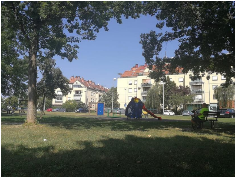
Sl. 4. Gredice

Gredice su kvart omeđen Horvačanskom cestom na sjeveru, potokom Čnomercem na zapadu, ulicom Marijana Haberlea na istoku i potokom Vrapčakom na jugu. U prošlosti je to bilo rijetko naseljeno područje polja i livada koje se naslanjalo na zapadu na Jarun, a na sjeveroistoku na Horvate. Tokom 60-ih i 70-ih godina 20. stoljeća, naselje se sastojalo samo od jedne glavne ulice (Gredice I) s nekoliko kraćih odvojaka. Intenzivan razvoj počinje u 80-im godinama kada se gradi kompleks zgrada koji danas čini temeljni dio tog naselja, a od starijih dijelova ostalo je tek desetak obiteljskih kuća na jugu kvarta kod potoka Vrapčak (mapiranjeTrešnjevke – Gredice, 2016). Naselje nema javnih sadržaja (škola, knjižnica, crkva itd) već se u tom pogledu oslanja na susjedne kvartove (Jarun i Knežiju). Gredice se sastoje prvenstveno od stambenih zona te zelene površine uz potoke Čnomerec i Vrapčak.