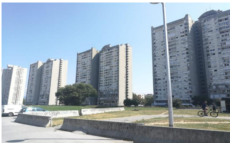
Sl. 13. Srednjaci – neboderi u Ulici Braće Domany