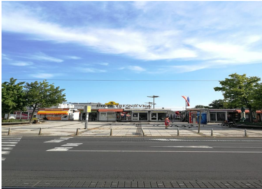
Sl. 15. Stara Trešnjevka (tržnica)

dijelu kvarta postaje lošije zbog problema u prometu i ostaloj infrastrukturi (mapiranje Trešnjevke – Stara Trešnjevka, 2016).