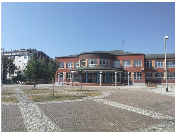
Sl. 17. Osnovna škola Vrbani

Vrbani se sa zapada oslanjaju na Prečko po zamišljenoj liniji istočno od Odakove i Sibelisuove ulice, na istoku Ulicom Hrvatskog sokola, na sjeveru su omeđeni Zagrebačkom avenijom, a na jugu jezerom Jarun kojega to naselje dotiče na sjeverozapadnom dijelu jezera. Vrbani su jedan od novijih kvartova koji se počeo formirati početkom 80-ih godina izgradnjom stambenih zgrada uz ulicu Hrvatskog sokola i oko Rudeške ceste (Vrbani I). 90-ih godina nastavljena je izgradnja zapadno od potoka Vrapčak prema Prečkom (Vrbani II). Početkom 21. stoljeća počela je i treća faza gradnje, južno od Horvaćanske ceste, kojom su se zgrade proširile do jezera Jarun (Vrbani III). Prva osnovna škola u Vrbanima (OŠ Vrbani, Listopadska 8) sagrađena je 1992. godine. 1998. godine Vrbani su dobili trgovački centar Getro (danas Konzum), a naselje je poznato i po jednom od prvih McDonald's restorana brze hrane u Zagrebu na uglu Zagrebačke avenije i Rudeške ceste. Prva crkva u Vrbanima (Župa Blagovijesti – Navještenja Gospodinova) sagrađena je tek 2007. godine u Listopadskoj ulici, nasuprot osnovne škole Vrbani. 2003. godine počela je gradnja naselja Vrbani III koje je izraslo u jedno od najelitnijih naselja u Zagrebu i privuklo mnogo mladih obitelji. 2013. godine naselje je dobilo osnovnu školu i dječji vrtić. Iste godine u srcu Vrbana otvoren je moderan trgovački centar Point koji svojim sadržajem privlači i stanovnike susjednih kvartova, pogotovo Jaruna (mapiranjeTrešnjevke – Vrbani, 2016).