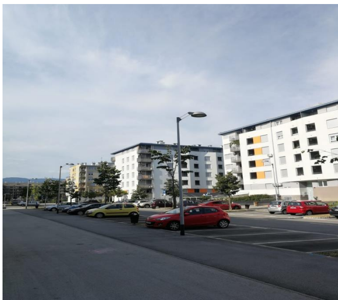
Sl. 10. Novo naselje kod Selske