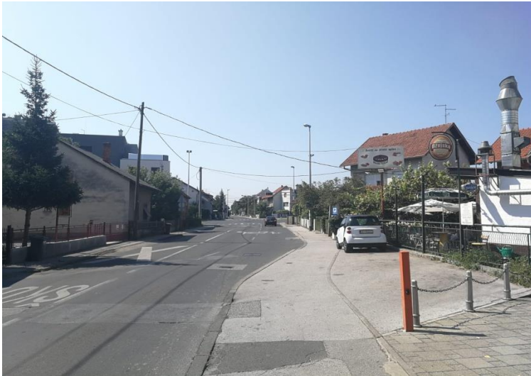
Sl. 11. Prečko (Petrovaradinska ulica)

godina kasnije i linijom 5 koja se do tada okretala na Jarunu) (mapiranje Trešnjevke – Prečko, 2016).