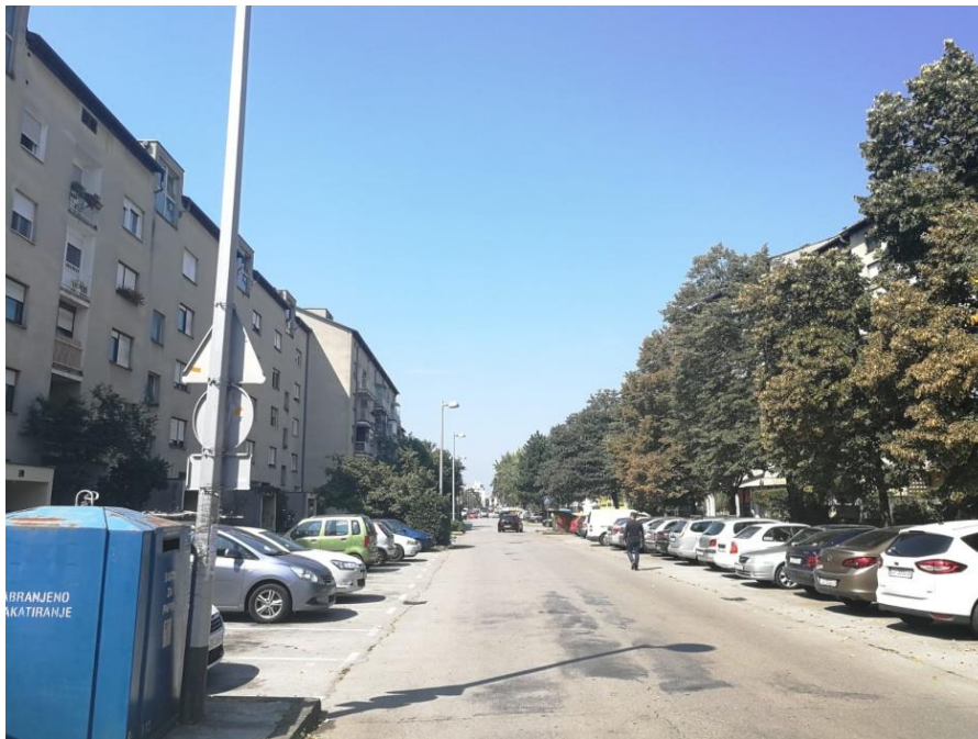
Sl. 3. Gajevo (Ulica Hrvoja Macanovića)

Gajevo je naselje koje je sa zapadna omeđeno ulicom Hrgovići, sa sjevera Zagrebačkom avenijom, s istoka potokom Čnomerec te s juga Horvaćanskom cestom. Nastalo je širenjem grada nakon Drugog svjetskog rata. Gajevo je zapravo bilo nastavak starijih kvartova Ljubljanice i Vurovčice (danas poznatije pod nazivom Remiza). U Koprivničkoj ulici su se nalazile ambulanta i brijačnica, na uglu Koprivničke i Ilirske bila je pošta, a u Ilirskoj su se nalazile mesnica, slastičarnica i gostionica. Ambulanta se, u obnovljenom izdanju, i danas nalazi na mjestu gdje je nekad bila dok brijačnice i pošte više nema. Na mjestu gostionice je danas trgovina Feroterm. 80-ih godina 20. stoljeća, glavna prometnica koje je prolazila kroz Gajevo bila je Peščanska ulica, a povezivala je Gajevo, Jarun i Staglišće s Gredicama i Horvatima na jugoistoku, te Rudešom i autoputom na sjeverozapadu. Nakon gradnje novog dijela naselja Peščansku ulicu su djelomično zamijenile današnja ulica Hrgovići, Našička ulica te ulica Hrvoja Macanovića. Dio Peščanske ulice ostao je nepromijenjen do danas, a to je dio ulice Hrvoja Macanovića koji se proteže od mjesta gdje se ulica Ladislava Štritofa spaja sa Horvaćanskom (mapiranjeTrešnjevke – Gajevo, 2016). Danas se na području Gajeva nalazi OŠ Ivana Meštrovića, vrtić 'Jarun', stadion NK Jarun te poslovnica Zagrebačke banke a na ostalom prostoru prevladava stambena zona.