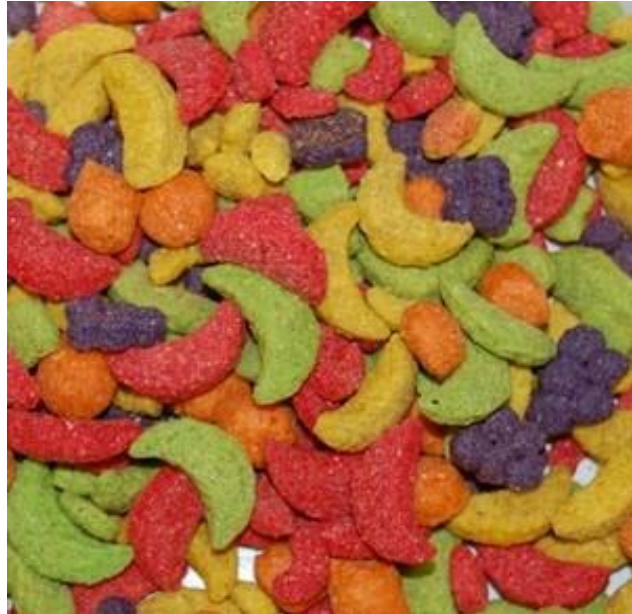
Slika 2: Ekstrudirana hrana u različitim bojama i veličinama