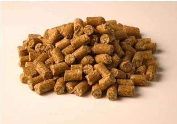
Slika 1: Lafeber Company brketi za are i kakadue

enzima. Različite nijanse crne, smeđe, žute i zelene (boje hrane prisutne u prirodi) se pokazalo da su za ptice prihvatljive. Utvrđeno je da uporaba obojene hrane smanjuje prihvaćanje hrane od strane ptice u nekoliko studija (Harrison, 1998)