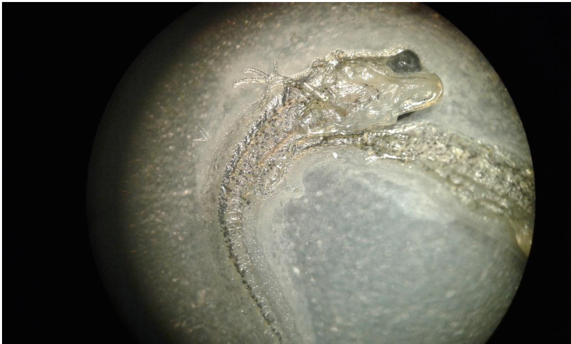
Slika 4. Uginula ličinka pod lupom, u gornjem lijevom kutu vidi se prednja noga.