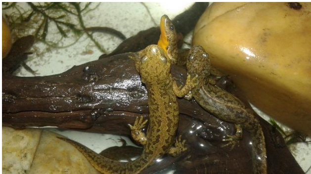
Slika 3.a (gornja) Ichthyosaura alpestris , ženka i 3.b (donja) tri ženke „odmaraju“ na grani