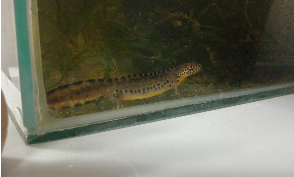
Slika 1. Ichthyosaura alpestris , mužjak

veluchiensis , inexpectatus , lacusnigri i cyreni . Vrste su rijetke u Mađarskoj i Bugarskoj, ugrožene u Austriji i Danskoj, a ranjive u Španjolskoj (url 4).