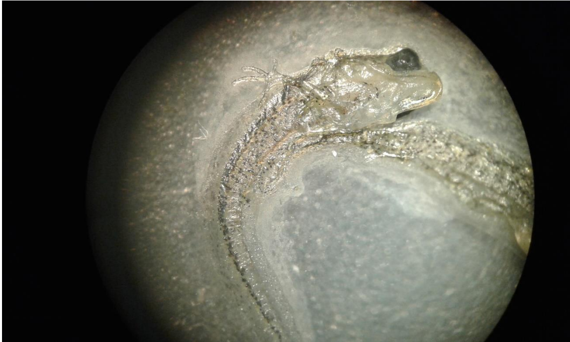
Slika 4. Uginula ličinka pod lupom, u gornjem lijevom kutu vidi se prednja noga.