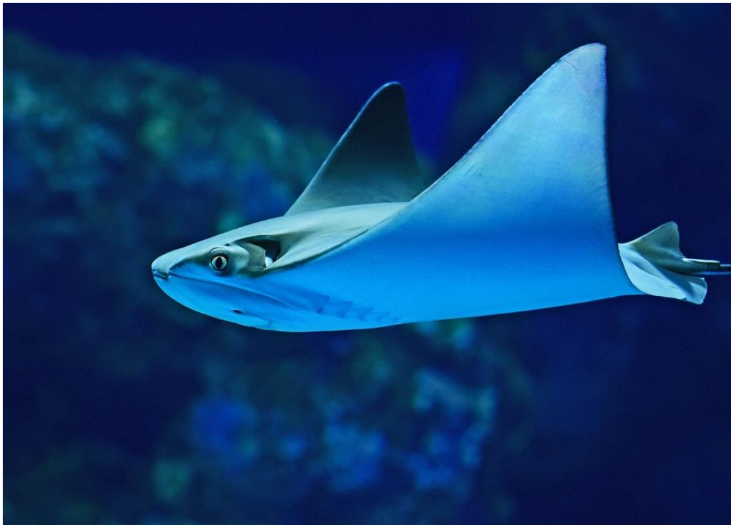
Slika 2. Raža u moru.

Za razliku od morskih pasa, raže imaju drugačiji oblik tijela – potpuno su spljoštene, često ovalnog ili romboidnog oblika, s tankim, izduženim repom. Njihov oblik tijela proizlazi iz činjenice da su im prsne peraje proširene i spojene s glavom (Slika 2.) Na dorzalnom dijelu tijela se nalaze oči i spirakuli, dok su usta i škržni otvori na ventralnom dijelu. Poznate su i otrovne vrste raža (golubovi) koje imaju poseban žalac na repu koji koriste kako bi ubole žrtvu. Razmnožavanje raža je oviparno ili ovoviviparno. Važno je naglasiti da raže ne preferiraju otvorena mora, a najčešće žive u tropskim i suptropskim područjima (Pough i sur. 2009).