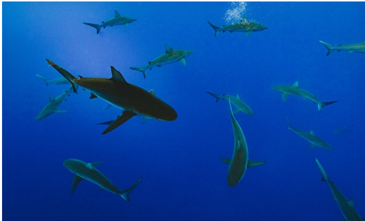
Slika 1. Morski psi u otvorenom moru

( www.gizmodo.com ). Morski psi se mogu razmnožavati viviparno, oviparno ili ovoviviparno (Pough i sur. 2009).