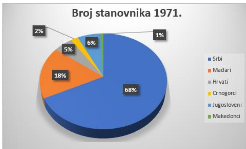
Slika 2. Udio pojedinačnih etničkih skupina u Novom Sadu 1971. godine

Kao što možemo vidjeti broj Srba se je znatno povećao dok je broj Hrvata neznatno porastao, a ostale etničke skupine su izgubile određen broj stanovnika. To se može vidjeti na Slici 2. Dakle 1971, godine Srbi čine 68 % posto stanovništva, Mađari 18 %, dok Jugoslaveni i Hrvati 5 % stanovništva.