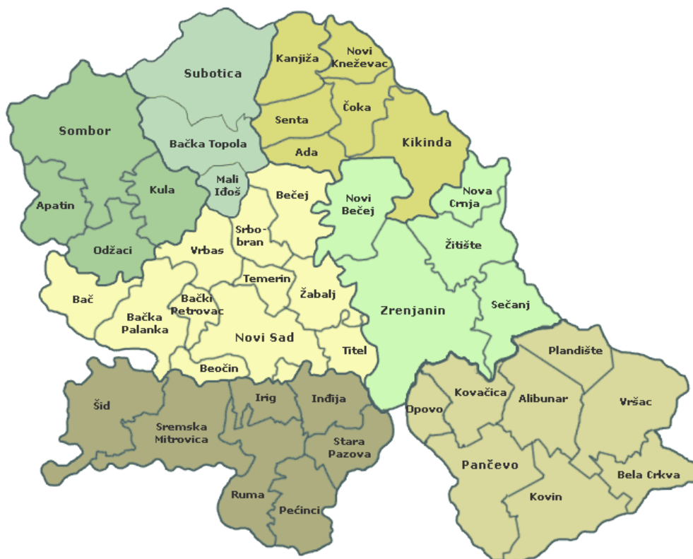
Slika 1. Administrativna podjela Vojvodine