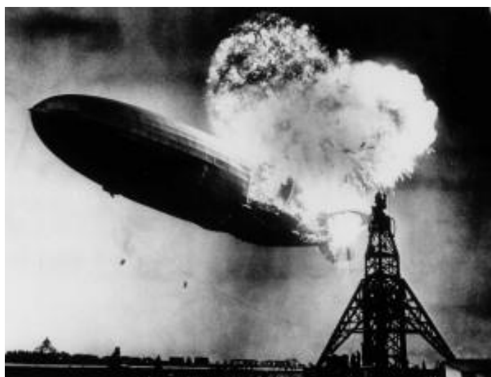
Slika 4. Hindenburška nesreća 1937. godine. 24

Godine 1925. u SAD-u proveden je zakon takozvani helijski akt . Cilj ovog zakona bio je uspostaviti program za proizvodnju pod vodstvom jednog tijela, Biroa ruda. Na taj način počela je masovna proizvodnja i ekstrakcija helija. Nakon što se 1937. godine dogodila Hindenburška nesreća (Slika 4) u kojoj je cepelin ispunjen vodikom izgorio i eksplodirao, izglasan je novi zakon za proizvodnju helija. Da je Hindenburg bio punjen helijem, izbjegla bi se takva katastrofalna nesreća. Stoga su se zalihe helija počele još više cijiniti te je 1937. godine donesen novi zakon o heliju. Njegovim provođenjem, privatne kompanije kao i velike industrije, imale su dozvolu za proizvodnju te je na taj način započela najveća proizvodnja i upotreba helija. Masovnom proizvodnjom, došlo je do izvoza i velikog profita.