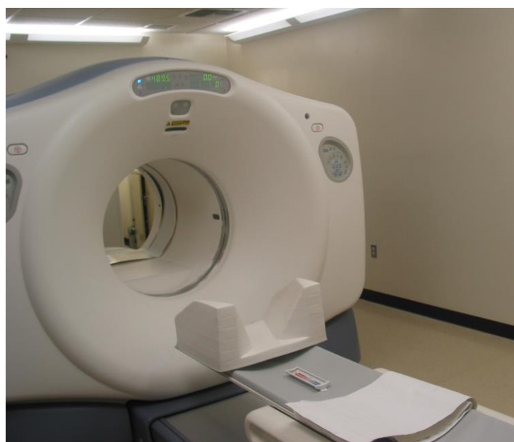
Slika 3. MRI uređaj za skeniranje 16

Osim u magnetskoj rezonanci helij ima primjenu i u ionskoj mikroskopiji. Helij-ionska mikroskopija (HIM) nova je tehnologija snimanja s visokom razlučivošću. Primjenom HIM metode snimljeno je epitelno tkivo bubrega štakora s odličnom kvalitetom, a vidljivi su i neki sitni detalji poput membranske teksture. 14 15