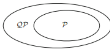
Slika 1.3.1: Odnos između P i QP .

Definicija 1.3.3. BQP je klasa problema rješiva na kvantnom Turingovom stroju u polinomnom vremenu s ograničenom vjerojatnošću \epsilon < \frac{1}{3} za grešku.