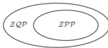
Slika 1.3.2: Odnos između ZQP i ZPP

Poznato je da vrijedi P \subseteq BPP \subseteq BQP \subseteq P\text{-Space} . Prema tome nije poznato je li kvantni Turingov stroj jači od vjerojatnosnog Turingovog stroja. Također nije poznata veza između BQP i NP .