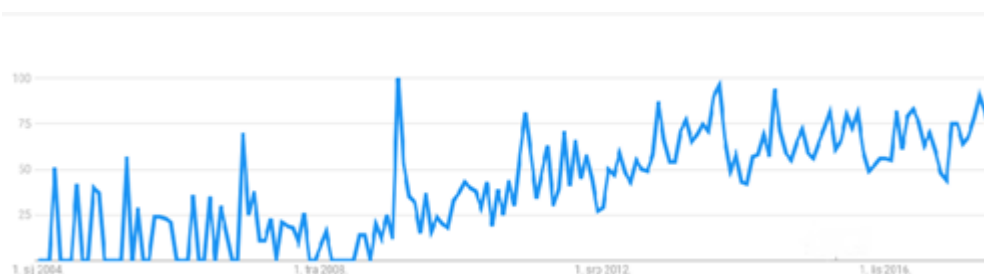
Slika 3.1: Indeks pretrage za pojmom “homomorphic encryption”

relativno neefikasan za praktičnu primjenu pa su ga u više navrata pokušali prerađivati Jean-Sébastien Coron, Tancreède Lepoint, Avradip Mandal, David Naccache i Mehdi Tibouch čime završava prva generacija potpunih homomorfnih kriptosustava.