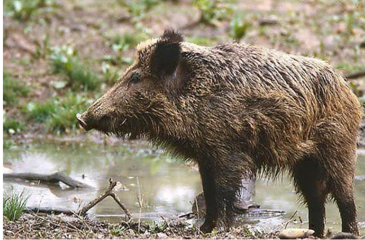
Slika 1. Divlja svinja

Prema trenutno važećem Zakonu o lovu (1994) i Pravilniku o lovostaji (1999), divlje svinje pripadaju u skupinu lovostajem zaštićene divljači. Za veprove i nazimad nema ograničenja lova tijekom godine, dok je za krmače i prasad propisana lovostaja u razdoblju od 5. siječnja do 1. lipnja (Konjević 2005). Divlja svinja je vrlo prilagodljiva i otporna vrsta, te se smatra da upravo zbog te karakteristike uspjela zadržati veliku brojnost i rasprostranjenost. Može napredovati u uvjetima promijenjenog staništa i lova, što nije slučaj za većinu druge divljači (IUCN 2015).