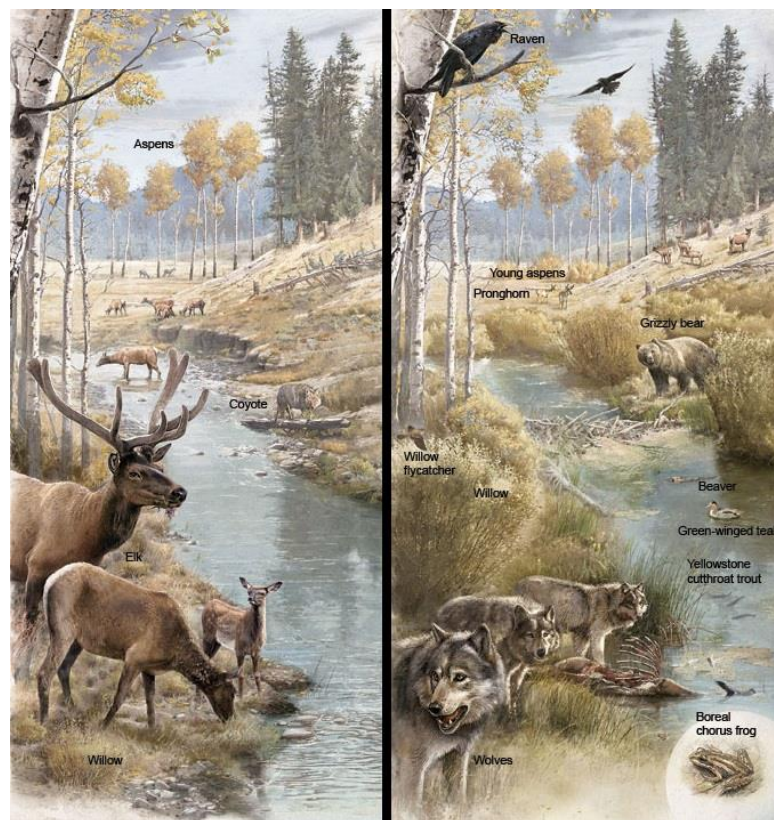
Slika 2. Lijevo - prije reintrodukcije vuka, desno – nakon reintrodukcije

Biološki resursi imaju široku primjenu u svakodnevnom životu - od uloge genetike u stvaranju novih kultivara preko vrsta koje se koriste za hranu, u medicini i u industrijske svrhe pa do kompletnih ekosistema koji pomažu procesima kao što su pročišćavanje voda i kontrola poplava. Bitno je imati na umu da su sve komponente bioraznolikosti međusobno povezane i odstupanje jednog segmenta iz ravnoteže dovodi cijeli sustav u disbalans, makar naočigled ne bismo povezali da će, primjerice, nestanak vuka iz ekosustava Yellowstonea dovesti do proširenja korita rijeke, značajnog smanjenja kvalitete vegetacije i gubitka mnogih vrsta (Timber Wolf Information Network, 2019) (slika 2).