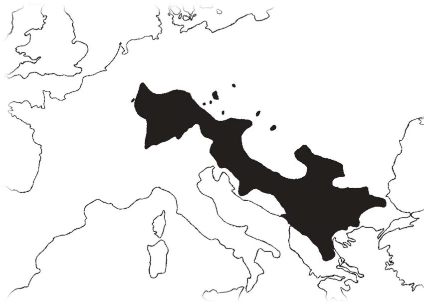
Slika 1. Rasprostranjenost vrste A. torrentium na području Europe (Machino i Füreder, 2005)