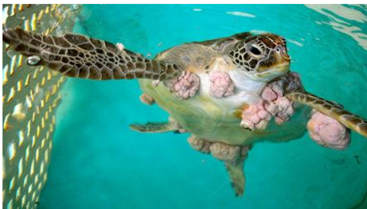
Slika 3. Glavata želva ( Caretta caretta ) s fibropapilomatozom