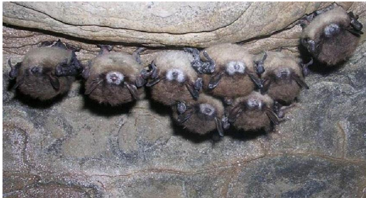
Slika 1. Hibernirajući šišmiši vrste napadnuti gljivicom Pseudogymnoascus destructans

Šišmiše napada gljivica Pseudogymnoascus destructans koja uzrokuje sindrom bijelog nosa (sl. 1). Bolest je raširena po Sjevernoj Americi i zasad se nije proširila Europom. Gljivica aktivira metabolizam šišmiša zimi tako da on prekida hibernaciju i ugiba od hladnoće i gladi. Za istraživanje je odabrano 11 vrsta šišmiša i sekvencirani su 16S rRNA geni bakterija. Uočen je značajan utjecaj vrste domaćina, geografske regije i okoliša, a brojne bakterije na životinjama nađene su i u okolišu. Međutim brojne vrste bakterija značajno su zastupljenije na šišmišima nego u okolišu. Dio bakterijskih vrsta dijele s ostalim kralježnjacima, ali imaju i jedinstven razred bakterija Thermoleophilia (koljeno Actinobacteria ). Najzastupljeniji razredi bakterija su Gammaproteobacteria , Alphaproteobacteria , Actinobacteria , Betaproteobacteria , Bacilli , Flavobacteria , Cytophaga , i Thermoleophilia (Avena i sur. 2016).