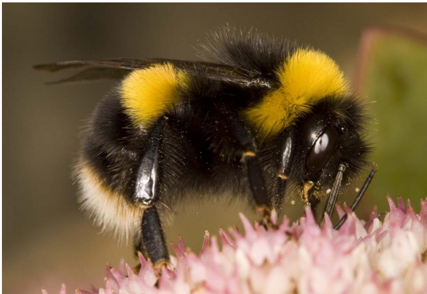
Slika 1. Vrsta Bombus terrestris pri hranjenju nektarom