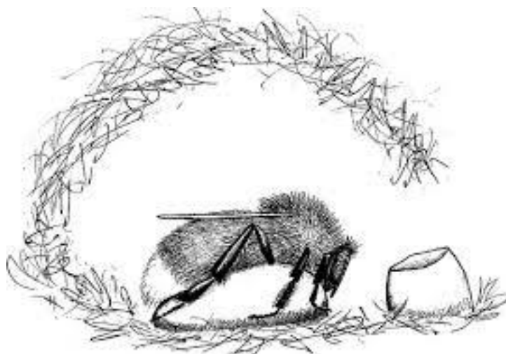
Slika 2. Matica vrste B. lapidarius inkubira leglo u novostvorenom gnijezdu

Ličinka bumbara ima četiri razvojna stupnja. Nakon 10 do 14 dana stvaraju svilenkastu čahuru te rade kukuljicu. Treba proći još 14 dana kako bi se odrasle jedinke izlegle tako da cjelokupni razvoj traje oko četiri do pet tjedana, što ovisi o zalihama hrane i temperaturi. Matica nastavlja inkubirati čahure i ličinke. One smještene u unutrašnjosti gnijezda, za razliku od onih smještenih periferno, razvijaju se brže i veće su. Nakon što se razvije prvo leglo, matica nastavlja sa skupljanjem polena i osniva još jedno leglo. Kada kukuljica „sazrije“, jedinke trebaju gristi čahuru kako bi izašle, a pritom im često pomaže i sama matica. U početku su mladi nebojeni, ali unutar 24 sata počinju dobivati svoj karakterističan uzorak. Prvi potomci su radilice koji pomažu u matičinom daljnjem hranjenju i održavanju drugog legla. Nakon toga gnijezdo ubrzano raste. Višak prikupljenog polena i nektara odlaže se u prazne čahure unutar gnijezda. Kada gnijezdo naraste do odgovarajuće veličine, započinje se s hranjenjem mužjaka i novih matice. Okidač za početak „uzgoja“ mužjaka i matice je količina radilica, odnosno omjer radilica i ličinki. Kraljica se može uzgojiti samo ako je prisutna dovoljna zaliha hrane, to jest dovoljan broj radilica koje će tu hranu priskrbiti. Mlade matice napuštaju gnijezdo radi ishrane te se vraćaju u intervalima tijekom noći, ali ne opskrbljuju gnijezdo hranom (Goulson 2010).