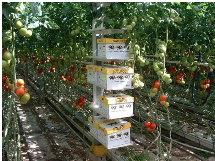
Slika 3. Kolonije bumbara korištene u svrhu stakleničkog uzgoja rajčice