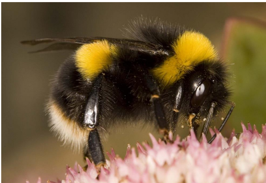
Slika 1. Vrsta Bombus terrestris pri hranjenju nektarom