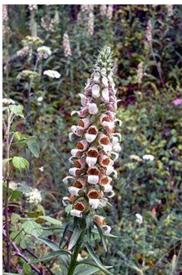
Slika 4. Digitalis lanata