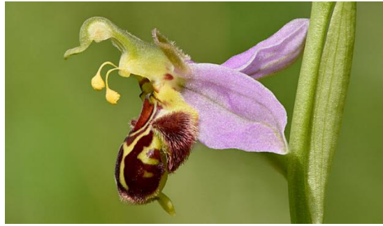
Slika 11. Ophrys apifera