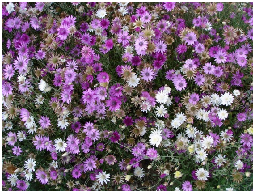
Slika 5. Xeranthemum annuum

Xeranthemum annuum je jednogodišnja biljka koja pripada porodici Asteraceae . Ima stabljiku visine 25-75 cm koja je razgranjena od baze (Slika 5). Na dugoj stapci nalazi se cvat glavica. Vanjski i srednji pricvjetni listovi su ušiljeni i glatki, a unutarnji su ovalni i svijetloružičaste boje. Fertilnih cvjetova ima 70-120. Pokazatelj je slabo kiselih tala, siromašnih hranjivim tvarima, te raste na strmim ocjeditim obroncima (Nikolić i Topić 2005).