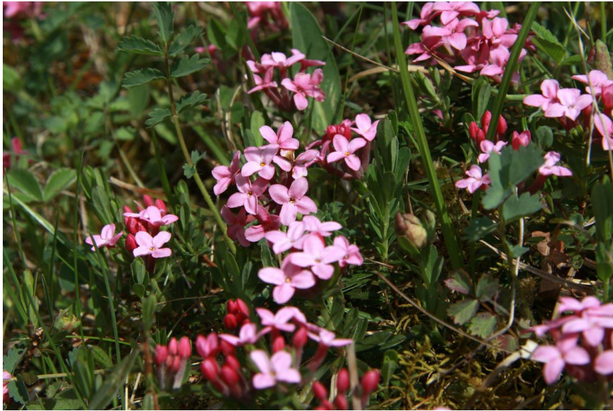
Slika 8. Daphne cneorum