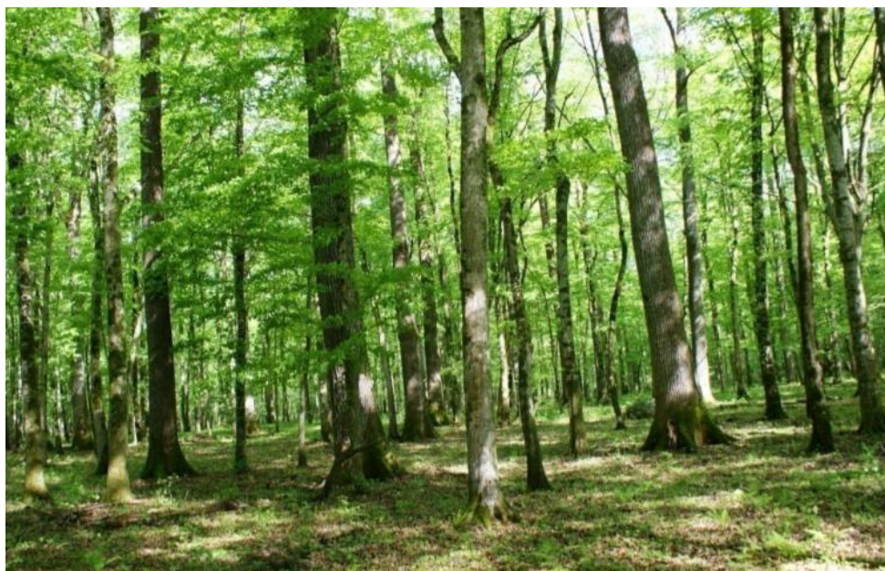
Slika 2. Zajednica Carpino betuli – Quercetum roboris

Mješovita šuma hrasta lužnjaka i običnog graba najznačajnija je šumska zajednica planarnog vegetacijskog pojasa koja se razvija izvan dohvata poplavnih voda (Slika 2). Uz lužnjak i grab, u sastavu se mogu pronaći druge vrste drveća. Prosječna razina podzemne vode je izvan zone korjenovog sustava običnog graba, ali redovno unutar zone korjenovog sustava hrasta lužnjaka (DZZP 2014).