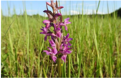
Slika 10. Dactylorhiza incarnata