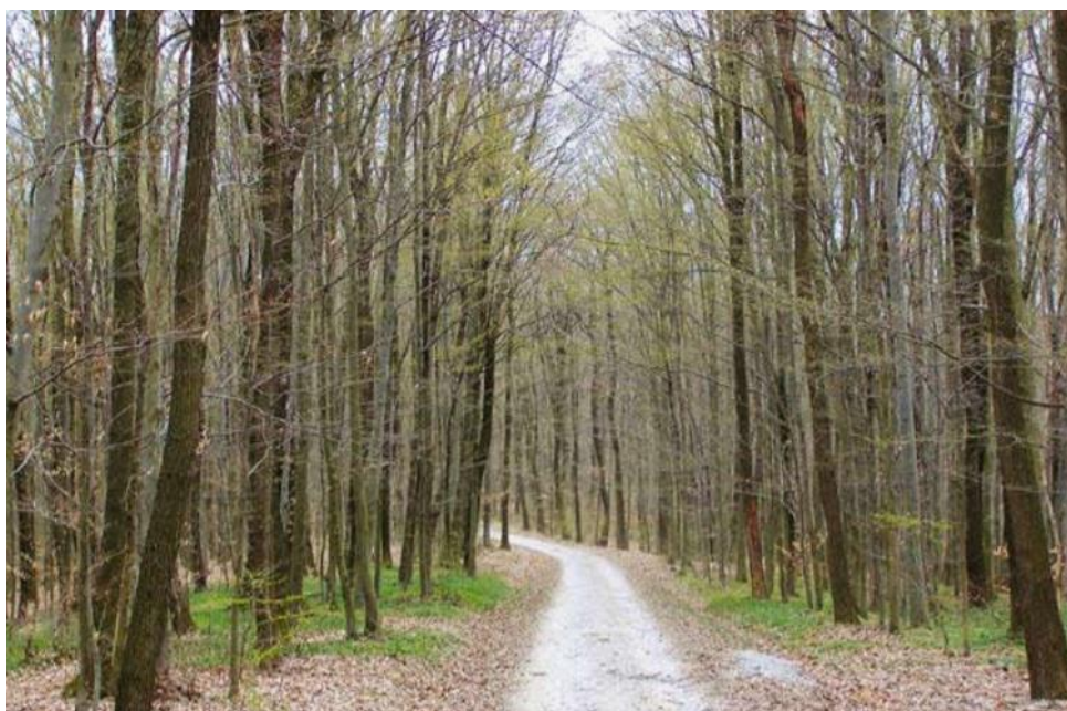
Slika 3. Zajednica Epimedio-Carpinetum betuli (repositorij.sumfak.unizg.hr)

Šuma hrasta kitnjaka i običnog graba je u Hrvatskoj značajna za brežuljkasti vegetacijski pojas, a na području Papuka dolazi u njegovim nižim dijelovima (Slika 3). U sloju drveća dominira hrast kitnjak ( Quercus petraea ), a mjestimično se mogu pronaći obični grab ( Carpinus betulus ) i poljski javor ( Acer campestre ). U sloju grmlja dominiraju perastolisni klokoč ( Staphylea pinnata ) i obična kurika ( Euonymus europaeus ), a u sloju niskog raslinja se ističu velika mišjakinja ( Stellaria holostea ), proljetna kukavičica ( Lathyrus vernus ) i mirisna lazarkinja ( Galium odoratum ) (DZZP 2014).