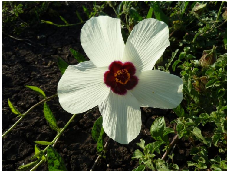
Slika 7. Hibiscus trionum