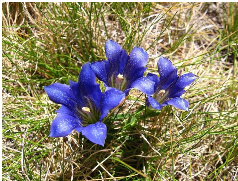
Slika 6. Gentiana pneumonanthe

Gentiana pneumonanthe pripada porodici Gentianaceae . Trajnica je i ima uspravnu stabljiku, visoka 5–40 cm (Slika 6). Listovi su linearni do dugoljasti ili jajastolancetasti, tupi ili malo ušiljeni. Vjenčić je zvonolika oblika, izrazito plave boje s pet zelenkastih linija. Cvjeta od srpnja do listopada. Raste na travnjacima koji ponekad budu izloženi poplavama (Nikolić i Topić 2005).