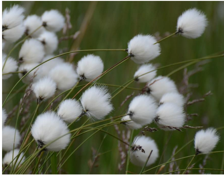
Slika 9. Eriophorum latifolium (en.wikipedia.org)

Eriophorum latifolium je višegodišnja zeljasta biljka iz porodice Cyperaceae . Ima trobridu stabljiku koja nosi listove koji su na vrhu ušiljeni. Klasića ima 2-12. Čekinje ocvjeća su duge oko 25 mm, bijele su boje i na vrhu razgranjene (Slika 9). Pokazatelj je mokrih, često natopljenih tala siromašnih zrakom (Nikolić i Topić 2005).