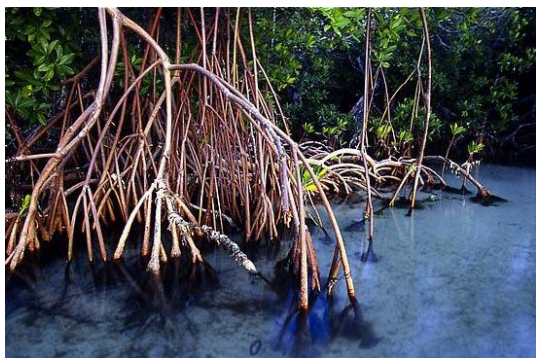
Slika 1. Rhizophora spp., ”štakasto” zračno korijenje

Razlikujemo nekoliko tipova zračnog korijenja. “Štakasto” zračno korijenje je potporno korijenje koje raste iz debla i donjih grana te ga nalazimo kod roda Rhizophora spp. (Slika 1.). Zračno korijenje “pneumatofore” raste okomito u zrak iz vodoravnog korijenja u tlu i nalazimo ga kod rodova Avicennia , Sonneratia i Laguncularia (Slika 2.). Kod rodova Bruguiera , Ceriops i Xylocarpus pneumatofore mogu formirati “koljena” iznad sedimenta (koljenasto zračno korijenje) (Slika 3.) (FAO 2005).