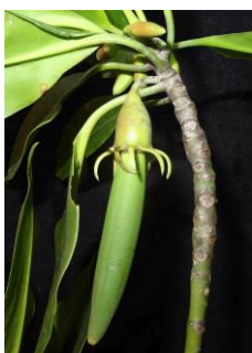
Slika 4. Rod Bruguiera , propagula

( https://www.google.com/search?q=bruguiera+propagula&rlz=1C1DIMA_enHR676HR677&source=Inms&tbm=isch&sa=X&ved=0ahUKEwjoi8qT8dDjAhVDDuwKHYD8CYgQ_AUIESgB&biw=1536&bih=674&dpr=1.25#imgsrc=AmyHef3ROdtAHM: ).