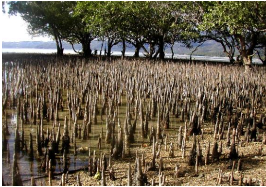
Slika 2. Zračno korijenje “pneumatofore”

( http://www.mangrove.at/images/mangrove/roots/coneroots/pneumatophores.jpg ).