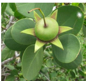
Slika 5. Rod Sonneratia , plod

( https://www.google.com/search?q=bruguiera+propagula&rlz=1C1DIMA_enHR676HR677&source=Inms&tbm=isch&sa=X&ved=0ahUKEwjoi8qT8dDjAhVDDuwKHYD8CYgQ_AUIESgB&biw=1536&bih=674&dpr=1.25#imgsrc=AmyHef3ROdtAHM: ).