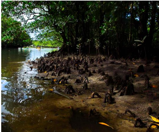
Slika 3. Bruguiera spp. koljenasto zračno korijenje

( http://www.mangrove.at/images/mangrove/roots/coneroots/pneumatophores.jpg ).