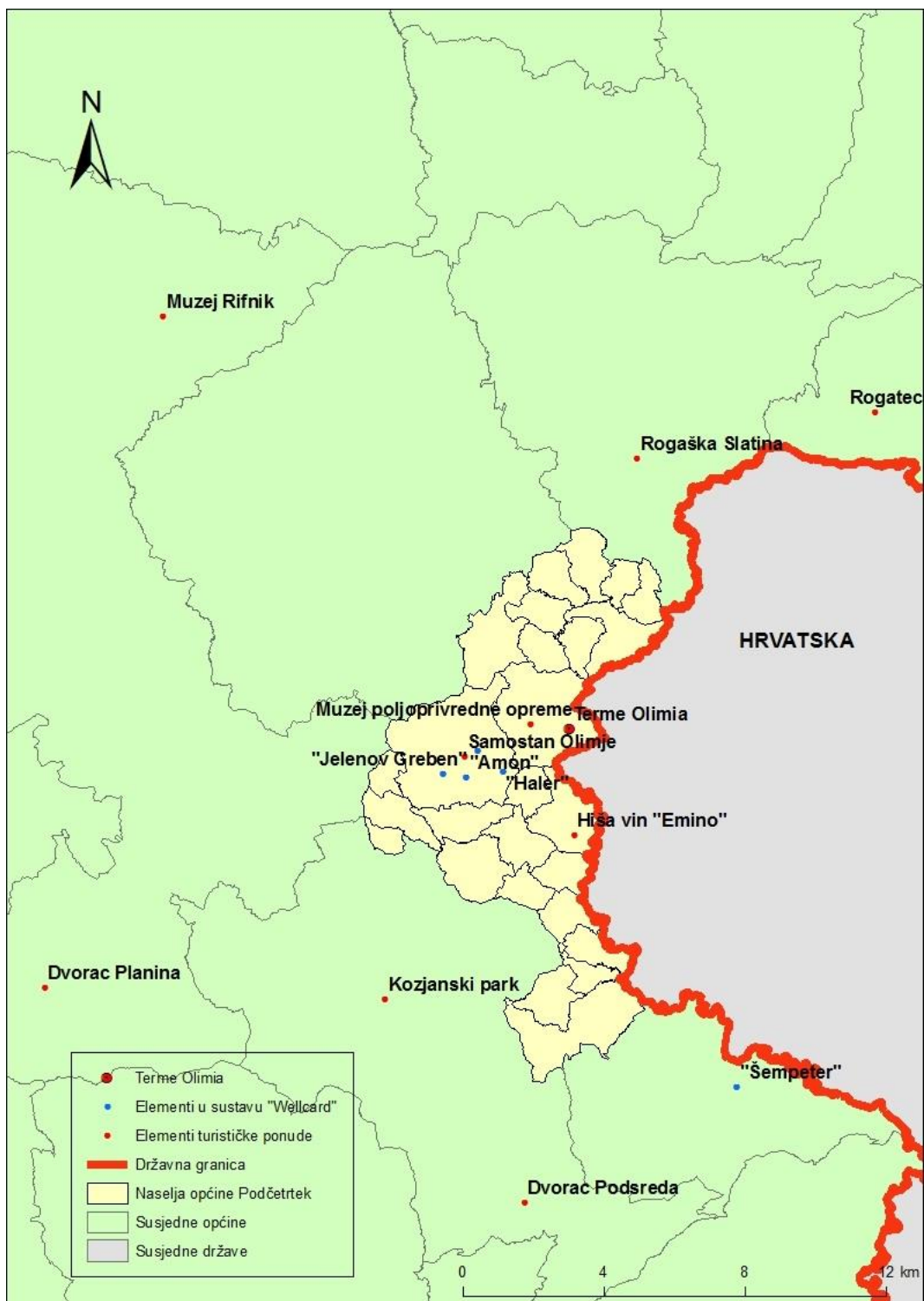
Sl. 15. Turistički sadržaji u okolici „Termi Olimia“ 2019. godine