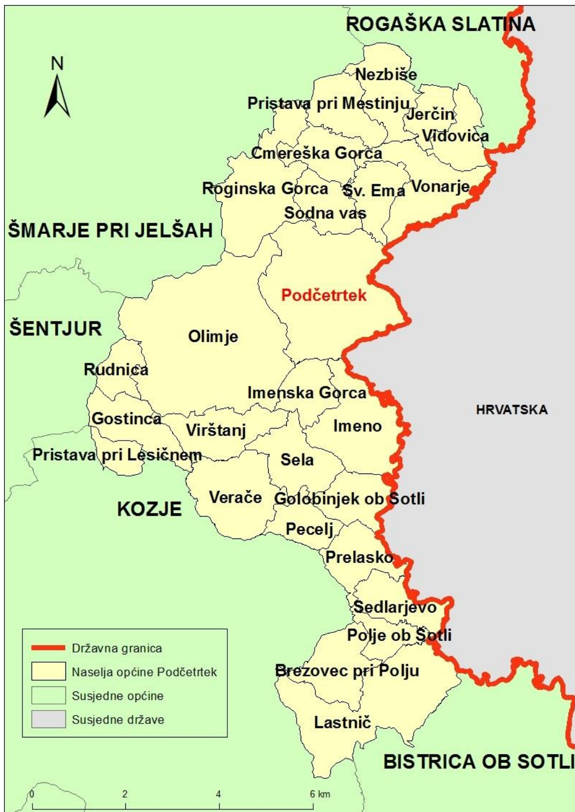
Sl. 2. Naselja Općine Podčetrtek i susjedne općine