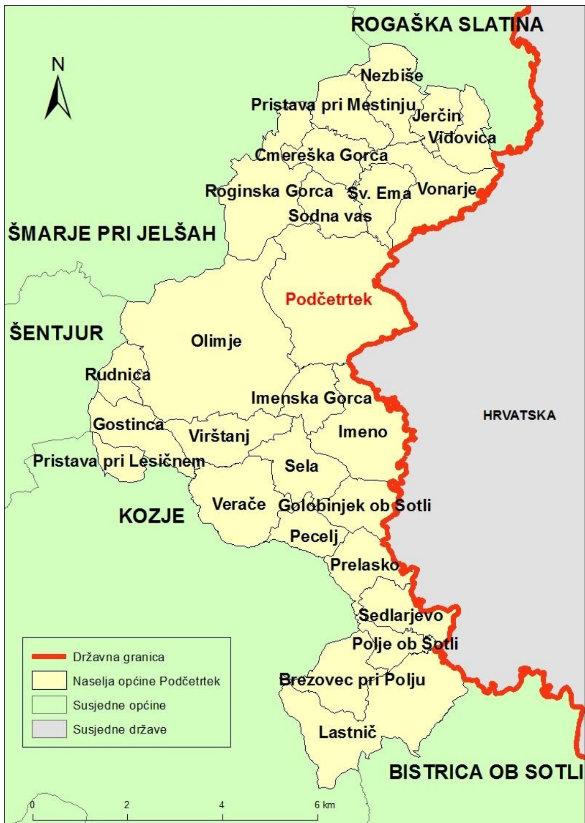
Sl. 2. Naselja Općine Podčetrtek i susjedne općine