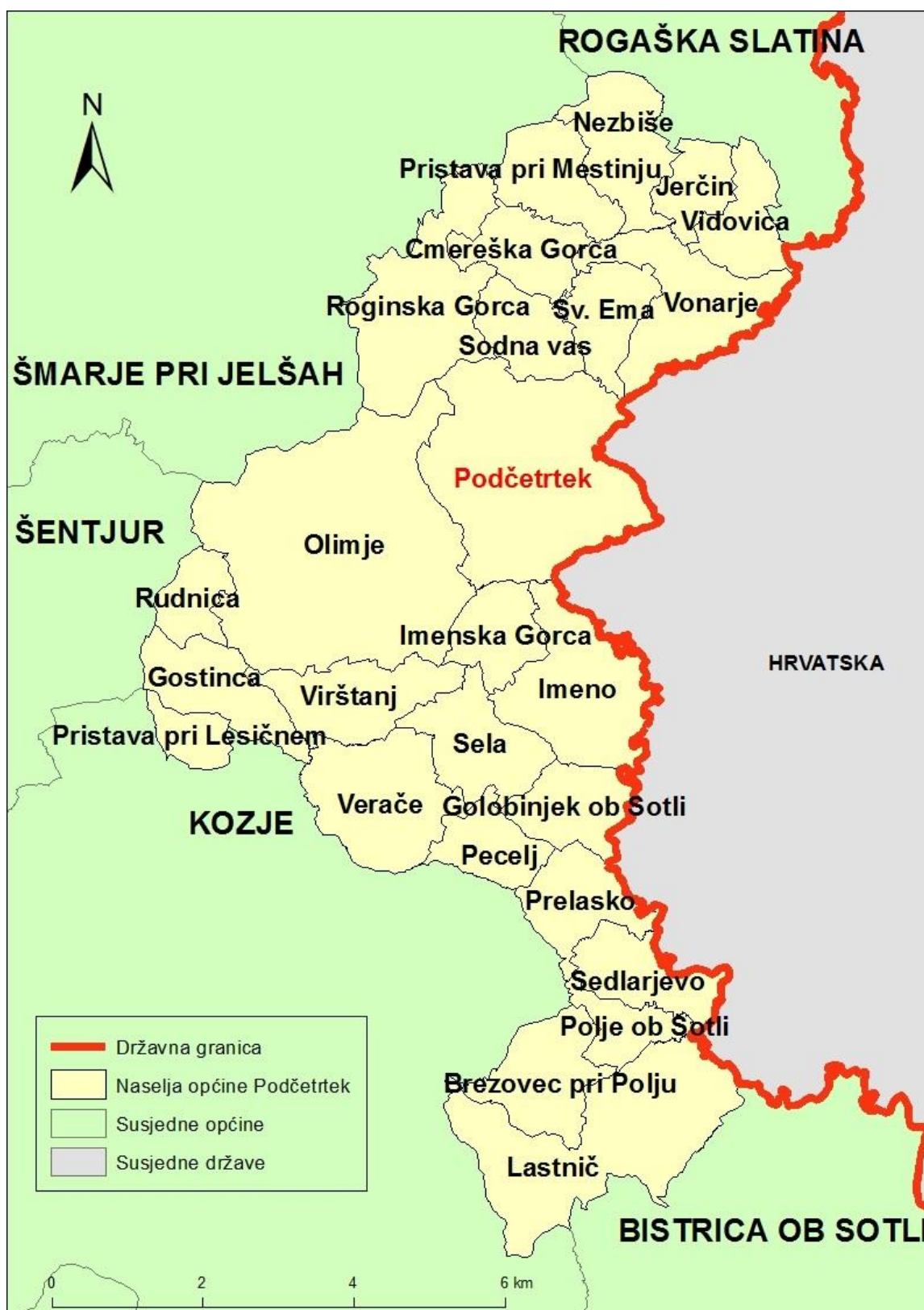
Sl. 2. Naselja Općine Podčetrtek i susjedne općine