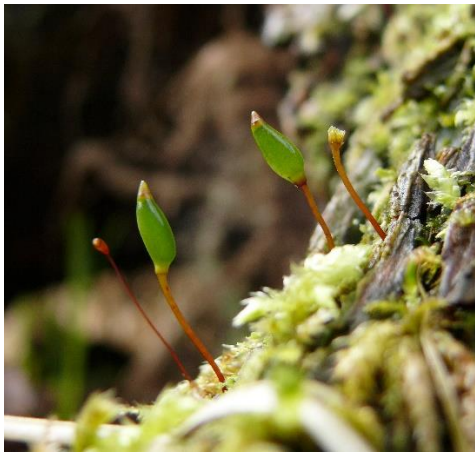
Slika 3. Talus vrste Buxbaumia viridis

Za ugroženost ove vrste zaslužan je gubitak šumskih staništa zajedno s intenzivnim upravljanjem šumskim područjima (uklanjanje srušenih i trulih drveća) (Fenton i Frego, 2005).