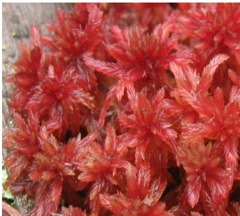
Slika 5. Talus vrste Sphagnum rubellum

Rod se ne nalazi unutar popisa Natura 2000 ciljnih vrsta, no staništa ovih mahovina zaštićena su prema dodatku II Direktive o staništima.