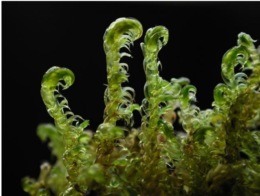
Slika 1. Talus vrste Hamatocaulis vernicosus

Vrsta H. vernicosus je ciljna vrsta Natura 2000 područja (Anonymous, 2013) i navedena je u Bernskoj konvenciji (Konvencija o zaštiti europskih divljih vrsta i prirodnih staništa). U Europskoj crvenoj listi mahovina (European Bryophyte Red List, ECCB 1995) kategorizirana je kao "nedovoljno poznata".