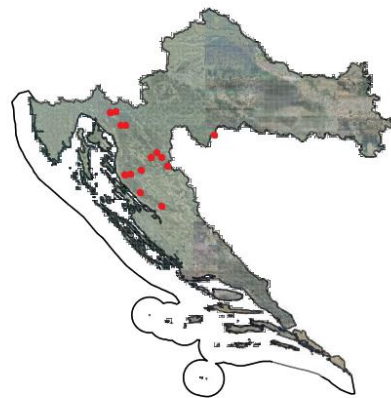
Slika 3. Talus vrste Buxbaumia viridis Slika 4. Rasprostranjenost u Republici Hrvatskoj (Nikolić, Flora Croatica Database, 2019)