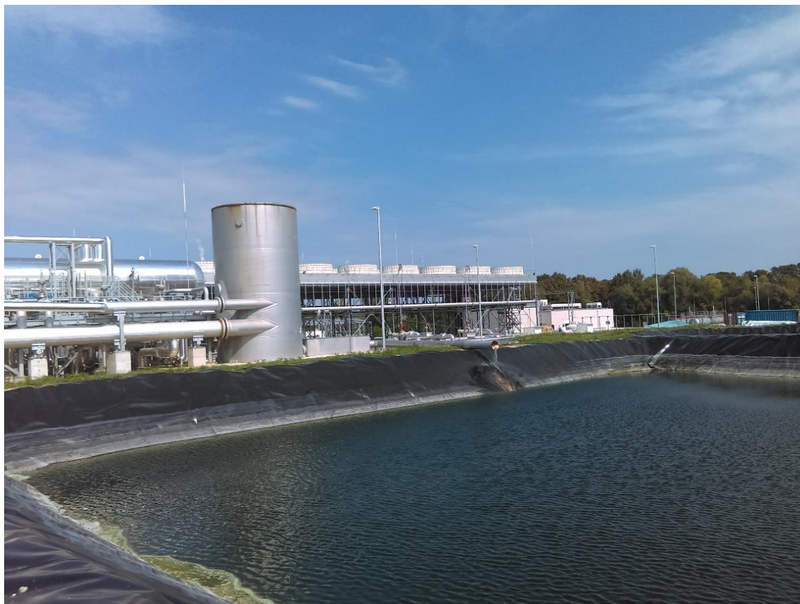
Slika 5. Kondenzacijsko jezero elektrane Velika Ciglena

Ekološki problem se pojavljuje jedino kod fragmentacije zemljišta na kojoj je elektrana sagrađena. Prema elaboratu Ministarstva zaštite okoliša i energetike utjecaj fragmentacije staništa je mali.