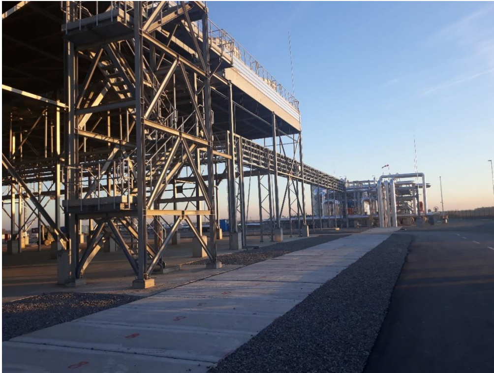
Slika 4. Geotermalna elektrana Velika Ciglena