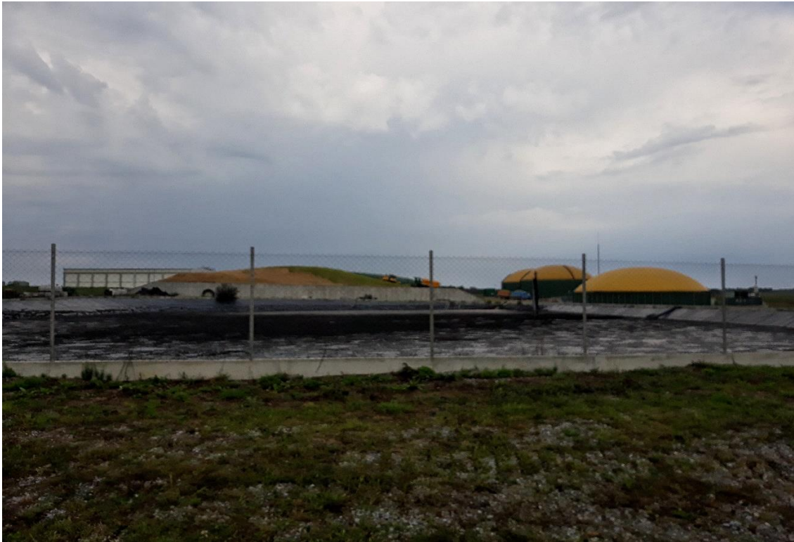
Slika 3. Kogeneracijsko postrojenje u Bojani (Čazma)

Kogeneracijska elektrana „Bio energana Bjelovar“ otvorena je u prvoj polovici 2019. godine. Vrijednost investicije se kreće oko 57 mil. kuna, a Bio energana je u vlasništvu obitelji Sabljo. Instalirana električna snaga postrojenja iznosi 1 MW, a toplinska snaga 4,4 MW. Kao pogonsko gorivo koriste šumsku biomasu. Bio energana sudjeluje u distribuciji energije u cijelom gradu. U lipnju ove godine puštena je u pogon kogeneracijska elektrana u Grubišnom Polju koja će, kao i Bio energana, koristiti šumsku biomasu. Proizvedena električna energija iznositi će 5,6 MW te biti distribuirana u energetska sustav grada, a toplinsku energiju od 6,5 MW će iskoristiti za sušenje drva. Sušenje drva će pomoći manjim pilanama koje nemaju vlastite sušare. Koristi bi trebali imati poljoprivrednici koji će energijom iz elektrane moći grijati plastenike.