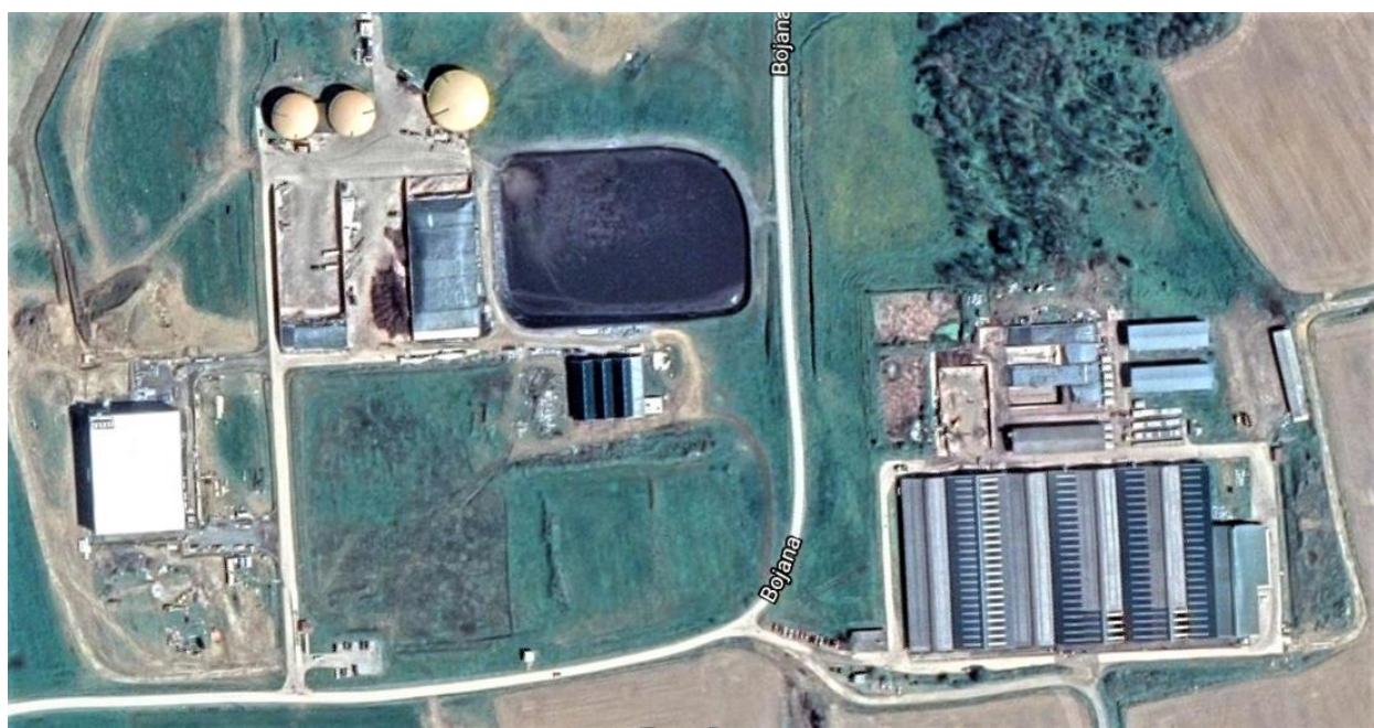
Slika 2. Satelitska snimka postrojenja u Bojani (Čazma) [13]