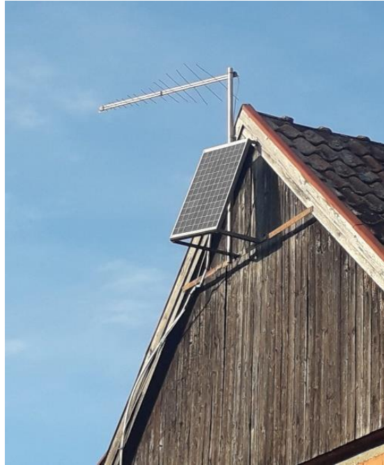
Slika 6. Primjer solarne ploče na vikendici u Narti (pokraj Bjelovara)

koriste pojedinci te se ne isporučuje u elektroenergetski sustav. Sunčeva energija ima potencijala iako u manjoj mjeri nego geotermalna energija i biomasa. Estetski izgled ploča i potreba za velikom površinom može negativno utjecati na pejzaž prostora. Ukoliko ima puno solarnih ploča nastaje problem sa zemljištem. Često se koriste na tlu koje može biti obrađivano, tlu na kojem su porušena drveća ili na tlu narušavajući pejzaž okoline što uvelike utječe na gospodarstvo i okoliš ljudi.