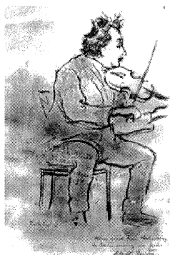
Einstein – najbolji fizičar među violinistima

Albert Einstein je zacijelo najveća javna ličnost među fizičarima svih vremena. Dovoljno je prisjetiti se mnoštva poznatih i manje poznatih anegdota koje ga prate.