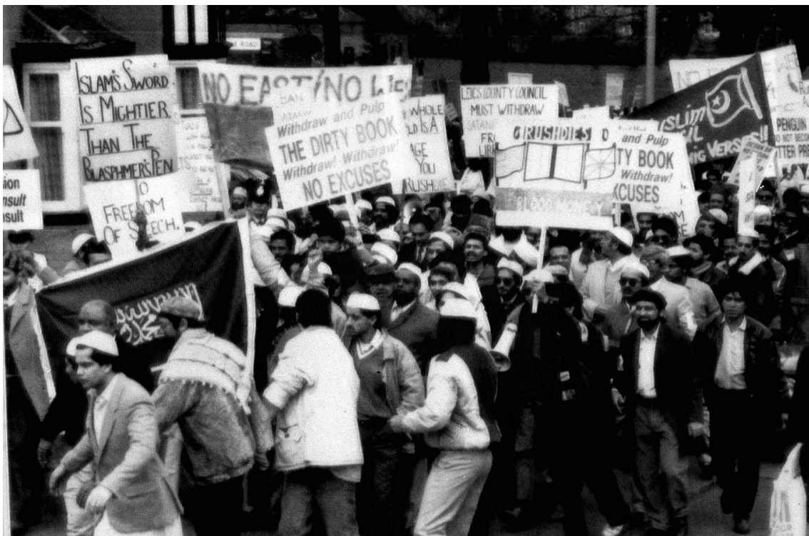
Sl.4. Prosvjed u Leicesteru 1989. godine zbog objavljivanja romana „Sotonski stihovi” Salmana Rushdieja

Počeci otuđivanja od britanskog društva počinju nakon objavljivanja „Sotonskih stihova“ pisca Salmana Rushdieja 1988. godine. Roman je postao kontroverzan odmah nakon objavljivanja zbog bogohulnih referenci vezanih uz proroka Muhameda, zbog kojih su se muslimani širom Ujedinjenog Kraljevstva uvrijedili te protestirali paljenjem knjige (Sl.4.). Demonstracije nakon objavljivanja „Sotonskih stihova“ otuđile su britansku javnost, koja nije navikla na tako burne i strastvene reakcije pobuđene religijom (Geaves, 2005).