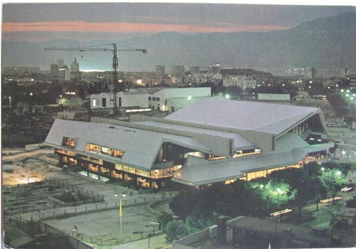
Sl. 3. Sportsko–rekreacijski centar „ŠC Gripe“ 1982. godine