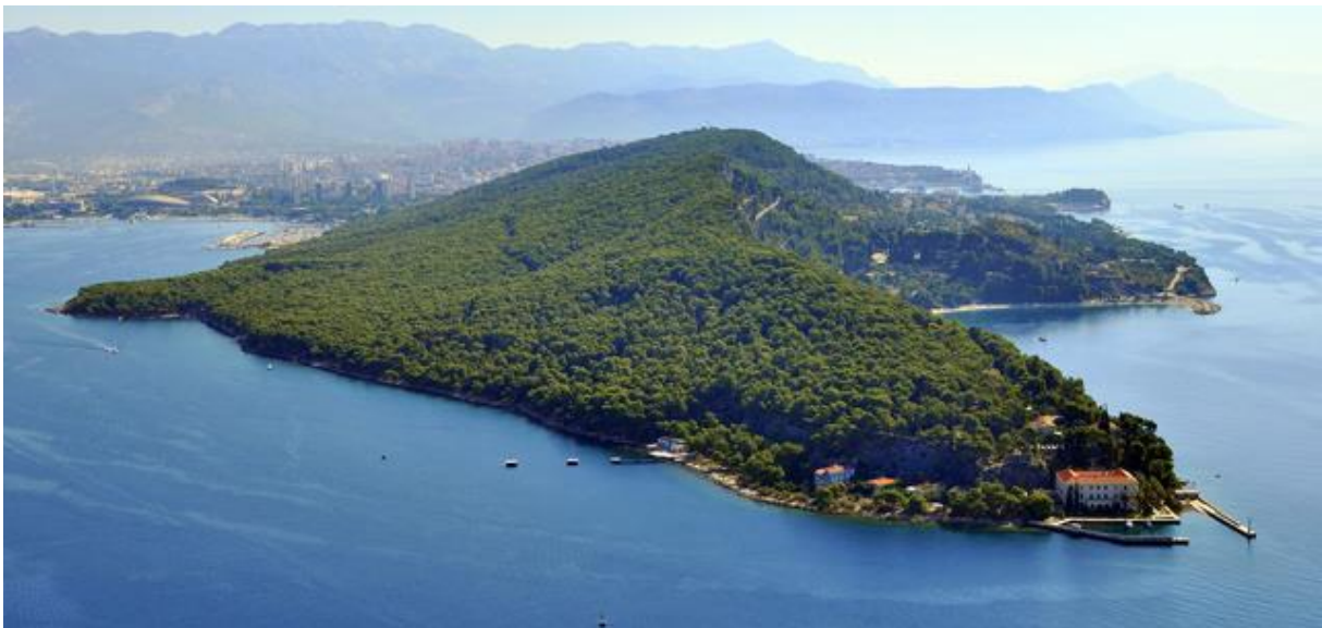
Sl. 1. Poluotok Marjan

Park-šuma Marjan, površine 300,29 ha, od čega je 196,24 ha pod vegetacijom, smještena je na marjanskom poluotoku (sl. 1), krajnje zapadnom dijelu splitskog poluotoka. Geografski faktor konfiguracije i položaj marjanskog poluotoka oblikovao je dvije izrazite ekspozicije, sjevernu i južnu, koje utječu na razvoj vegetacije i na raspored određenih biljnih vrsta. Ovaj relativno mali geografski prostor (dužine 3,5 km i širine od 1 do 1,5 km), značajan je po različitostima biljnih vrsta i po njihovu broju i rasporedu. Južnu stranu Marjana čine lapor i fliš koji se lako razgrađuju. Ova tla su, u našim primorskim krajevima, pretežno eocenske starosti, te je konstantnim djelovanjem vode došlo do njihova rastvaranja i formiranja plodna tla. Iz ovog razloga, na južnim padinama uspijeva autohtona i kultivirana flora (vinova loza, maslina, povrće i ostale drvenaste gospodarske kulture). Sjeverne padine građene su od vapnenca. Tla su ondje plitka, siromašna humusom, vrlo suha i jače se odupiru rastvaranju supstrata, izložena su eroziji te nisu povoljna za obradu. Na ovoj strani nalazimo tipičan krš. Marjan je jedna od prvih uspješno podignutih šumskih površina umjetnim pošumljavanjem na području jadranskog krša (URL 7).