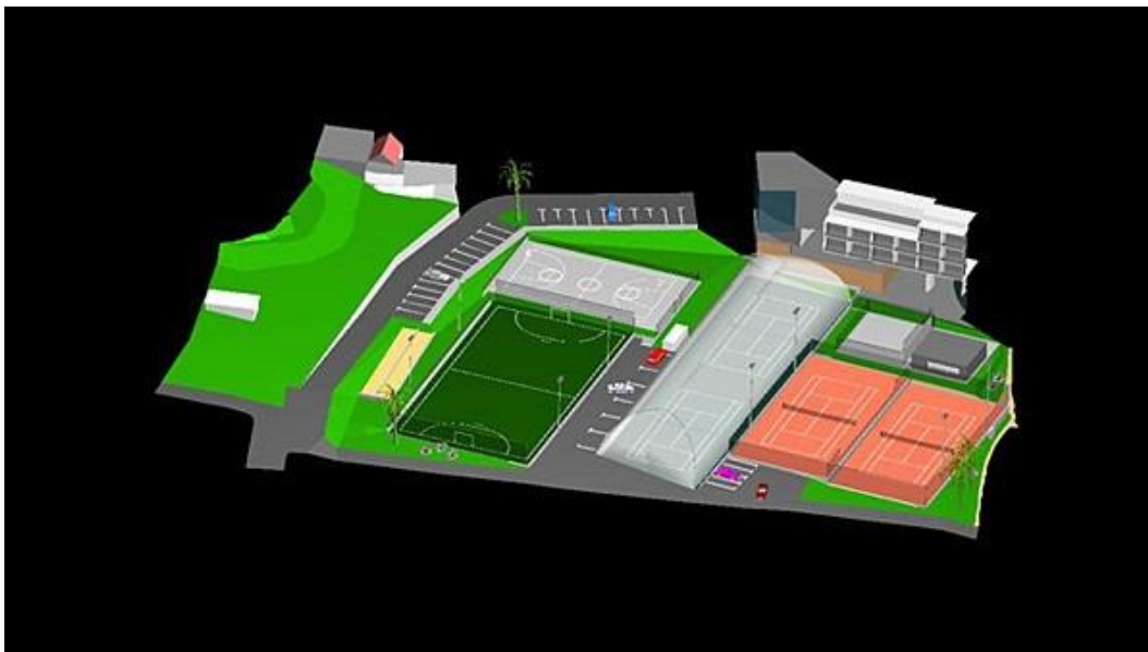
Sl. 6. Projekt obnove sportsko–rekreacijskog centra „Baterije“