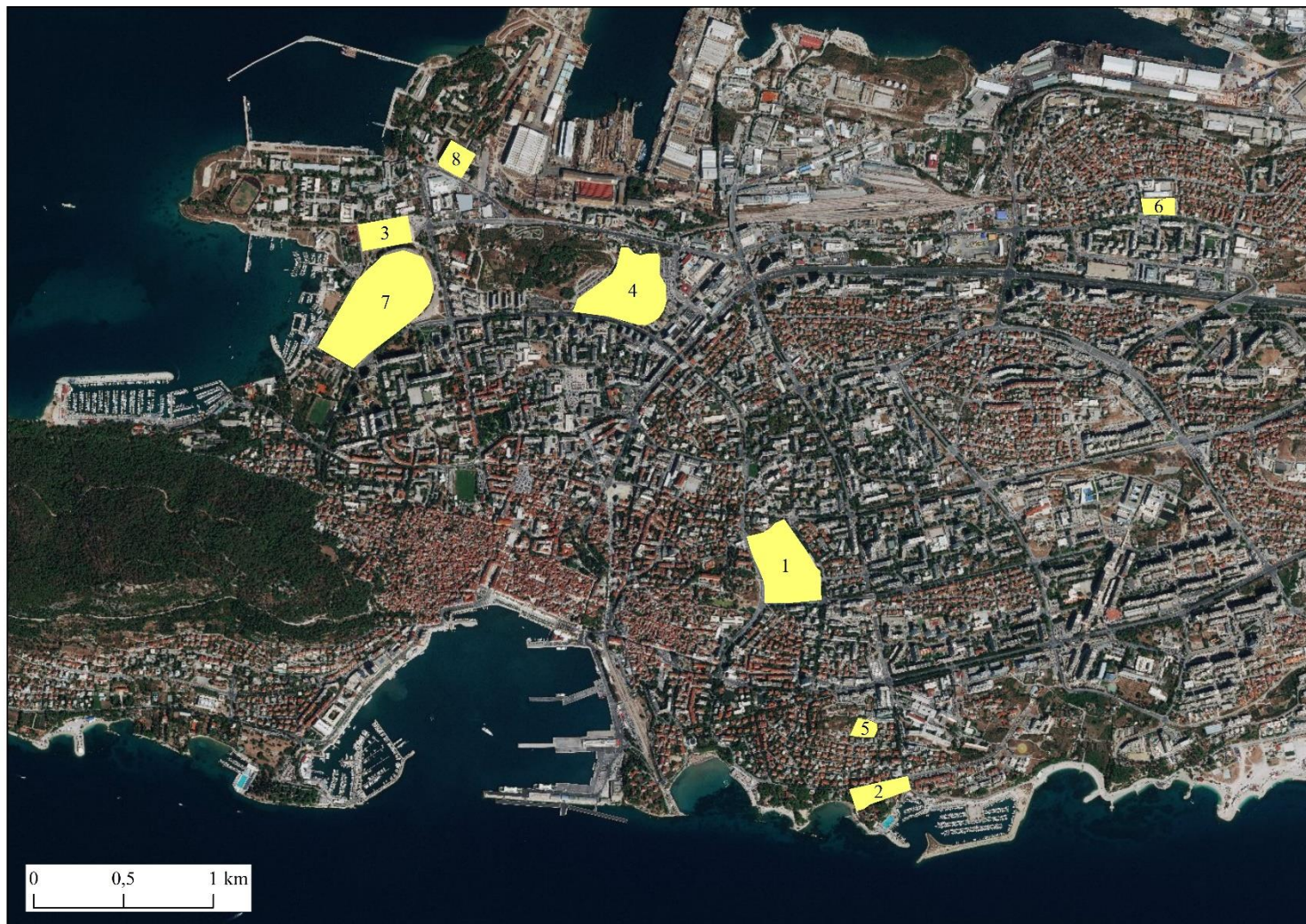
Prilog 4. Izdvojeni sportsko-rekreacijski objekti