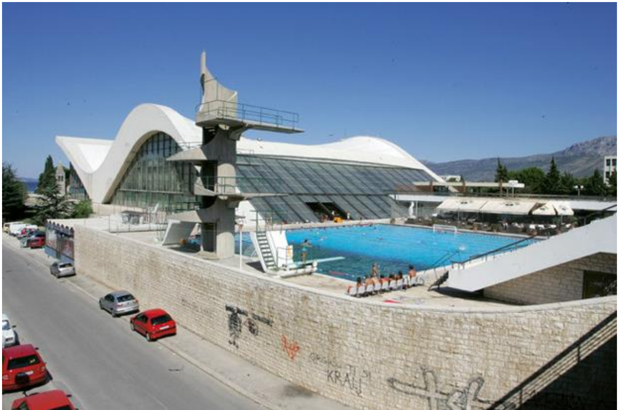
Sl. 4. Sportsko–rekreacijski centar „ŠC bazeni Poljud“