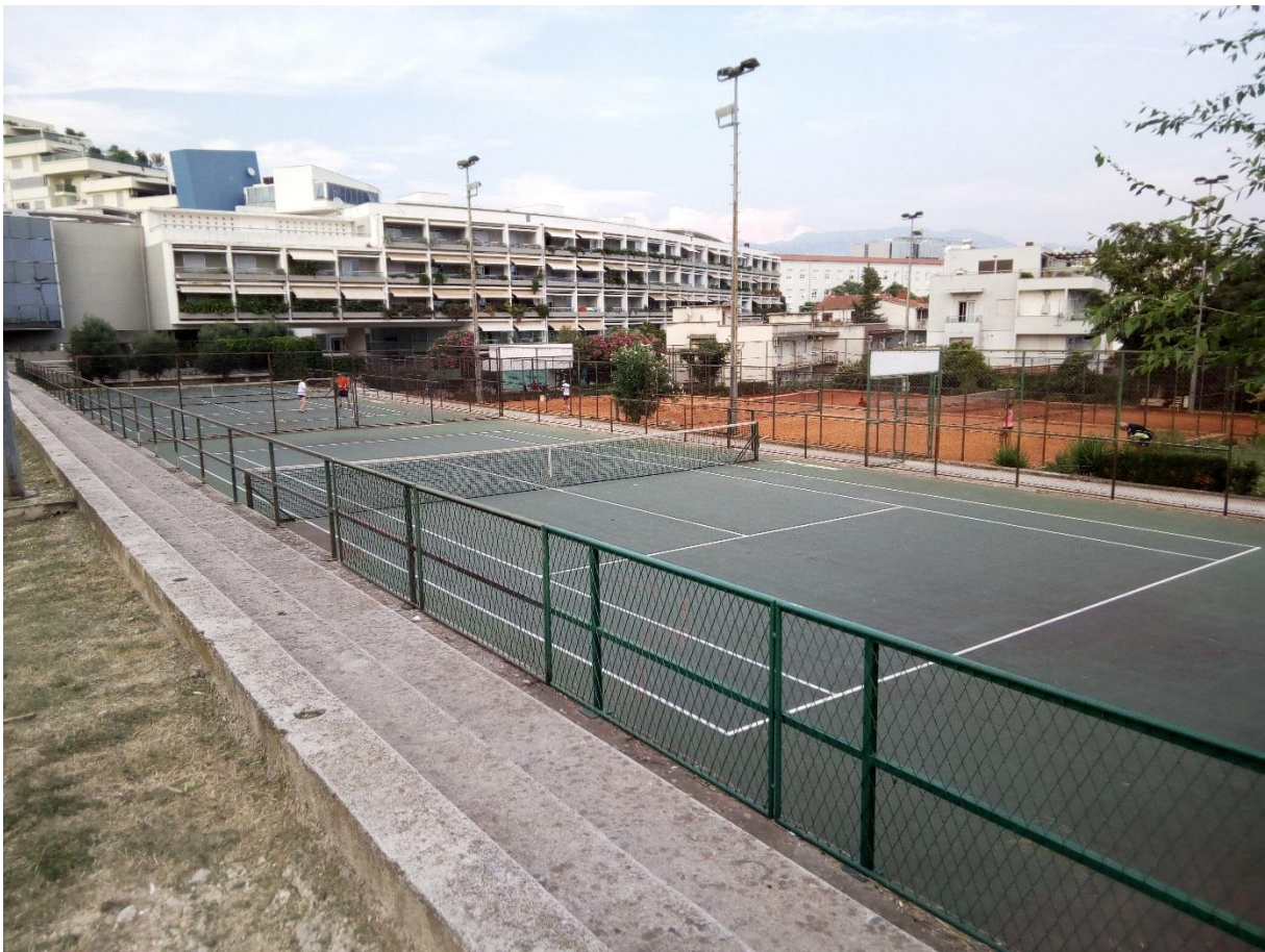
Sl. 5. Sportsko-rekreacijski centar „Baterije“

mjesečno. Cijene su prihvatljive, a broj članova velik. Grad Split snosi troškove struje za reflektore. Grad je osigurao sredstva da se 2016. godine na „Baterijama“ i na drugim lokacijama u gradu uredi nogometna igrališta s umjetnom travom (URL 26). Iz posjeta centru je vidljivo da je samo košarkaški teren obnovljen, stavljena je podloga - umjetna trava. Godine 2008. Teniski klub Split uputio je zahtjev Gradu Splitu za obnovu zapuštenih terena na Baterijama te košarkaškog i malonogometnog terena, a dobio bi se moderni centar (URL 27). Taj projekt (sl. 6) nikada nije do kraja realiziran.