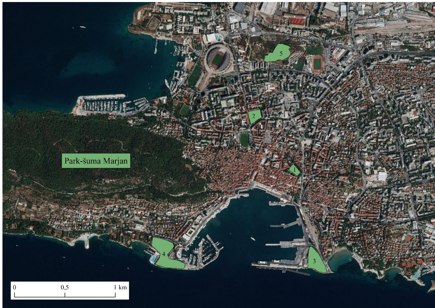
Prilog 1. Izdvojeni parkovi u Splitu