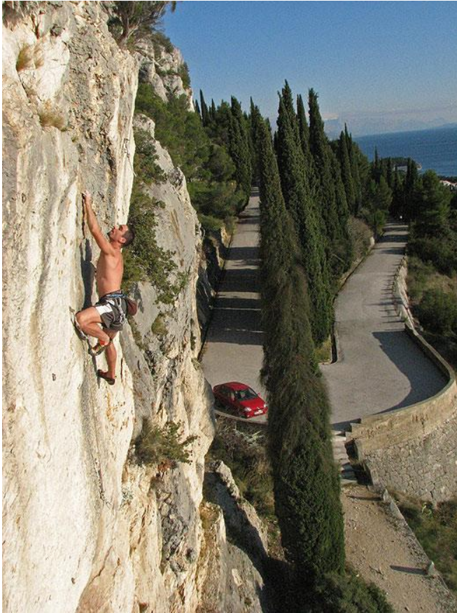
Sl. 2. Penjalište „Šantine stine“ u park-šumi Marjan

predvečerje (stijena je u hladu od 18h). U povijesnom razvoju penjanja u Splitu važno je spomenuti i Sustipan i sezonu 2005. kada se na penjalištu po prvi puta počelo penjati isključivo u penjačicama (URL 12).