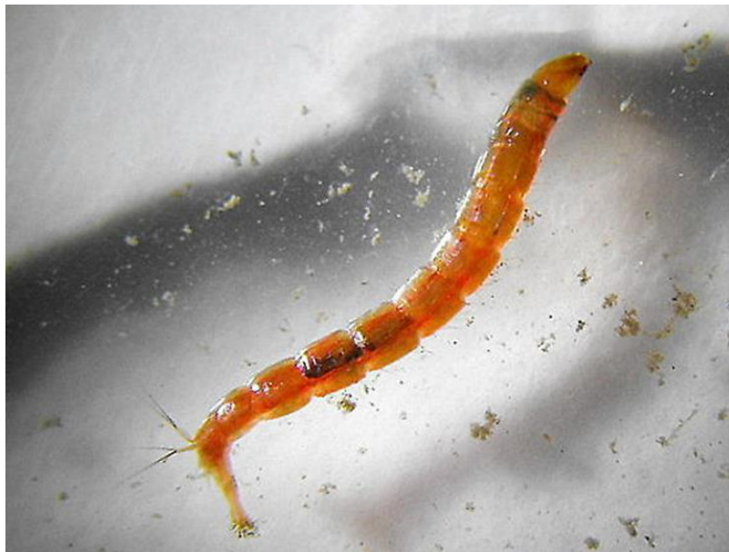
Slika 1. Ličinka vrste iz porodice Chironomidae

Iako su brojna skupina, postoje brojni problemi vezani uz njihovu sistematiku te se često proučavaju samo na razini skupine. Razlog tomu je izrazito homogena morfologija u svim stadijima te potreba za optičkim uvećanjem. Čak i prilikom promatranja egzuvija, razlika se vidi tek na uvećanju od oko 100 puta, a za ostalo je potrebno i više. Potreba za uvećanjem ne dolazi nužno od činjenice što su jedinke male, već i to što su razlike koje odvajaju vrste strukture mikroskopske. Ličinke s kojima se znanstvenici najčešće susreću su jedan od najvećih problema jer se mogu determinirati samo pomoću dobre mikroskopske opreme. Morfologija jajašaca se ne upotrebljava prilikom proučavanja porodice Chironomidae, međutim potrebno je napomenuti da su ona većinom posložena spiralno. Ličinke posjeduju dobro razvijenu, potpunu i neuvlačivu glavenu kapsulu s mandibulom koja se horizontalno pomiče, a tijelo je segmentirano i duguljasto (Slika 1.). Iako je većina istraživanja provedena na 4. stadiju ličinki i prijašnji stadiji imaju jednake karakteristike, ali su možda razvijene u drukčijim omjerima.