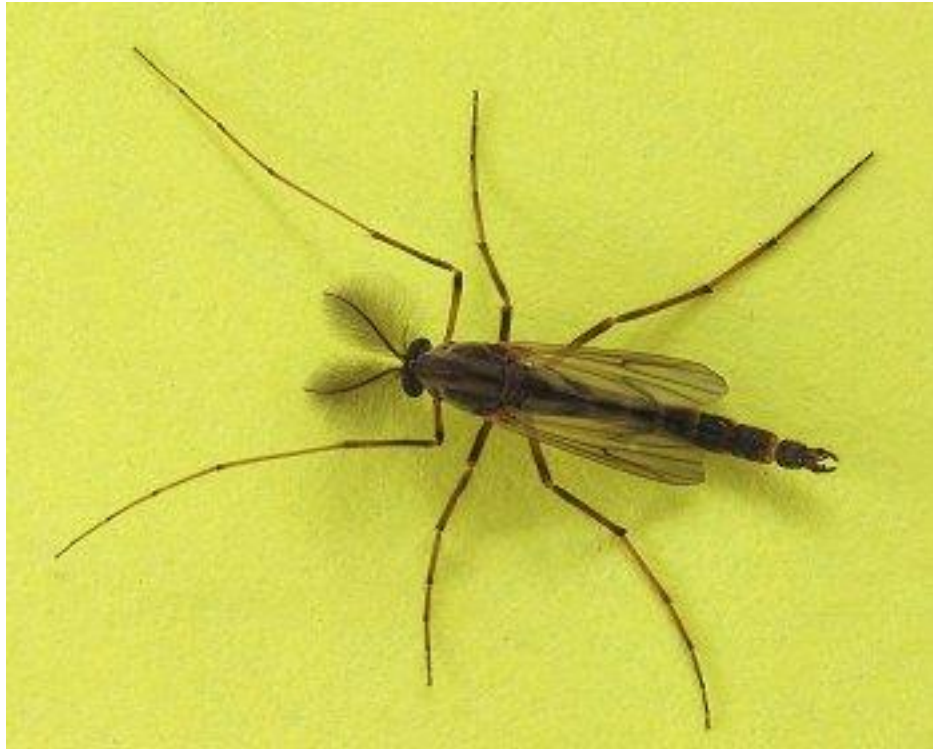
Slika 2. Odrasla muška jedinka predstavnica porodice Chironomidae

(Slika 2.) Često ih se zamjenjuje za komarce, međutim nemaju dugačko rilo te se ne mogu hraniti krvlju kao komarci (Hall, 2002).