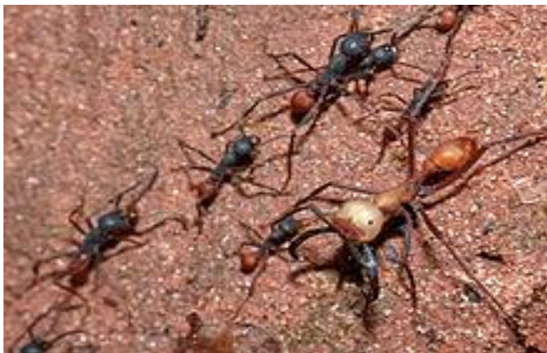
Slika 6. Vojnik (desno) i radnici (lijevo) vrste Echiton burchelli (URL 3)