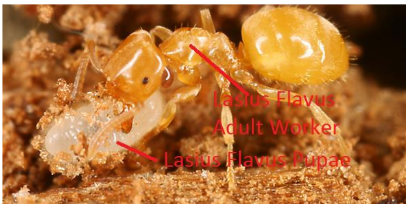
Slika 5. Odrasla jedinka - radnik (adult worker) koji nosi kukuljicu (pupae) vrste Lasius flavus (URL 4)

Osim kasta, razlikuju se i interkaste. To su kaste s vanjskim obilježjima i radnika i kraljice. Jedan od primjera je ergatoidna kraljica. Ergatoidne kraljice nemaju krila ali imaju jako dobro razvijen reproduktivni sustav. Bitno je napomenuti kako su ergatoidne kraljice vrlo rijetke u mravljim kolonijama te se pretpostavlja kako nemaju specifičnu ulogu u zajednici već obavljaju poslove radnika. Interkaste vrste Myrmica rubra imaju reducirane oči poput radnika, ali i reproduktivni sustav poput kraljica. Veličinom su veće od radnika no manje od kraljica. Ovakve interkaste su fenotipski različite od radnika no imaju istu ulogu. Javljaju se također i u vrsta Pristomyrmex punctatus (Smith, 1860) i Technomyrmex albipes (Smith, 1861) (Tribble i Kronauer 2017).