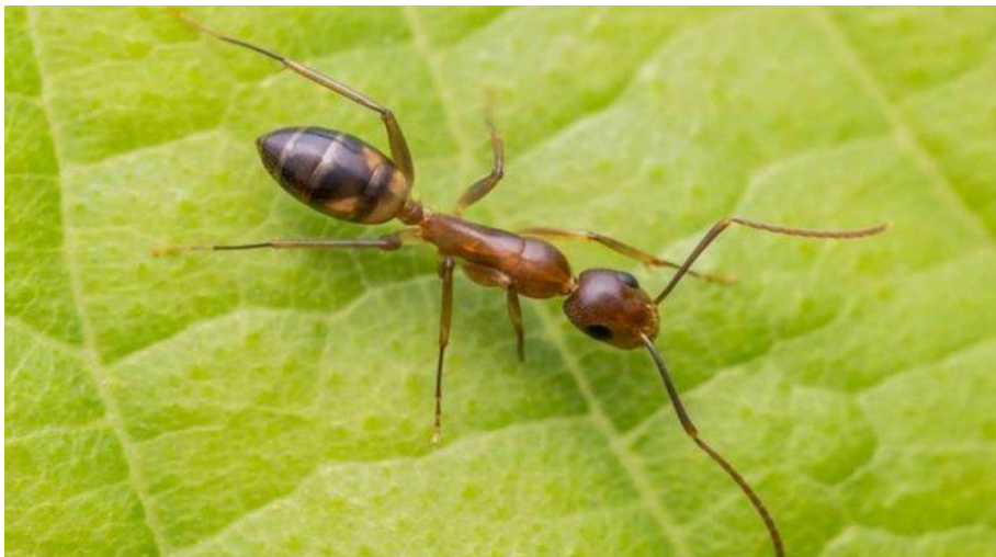
Slika 8. Argentinski mrav Linepithema humile (URL 6)

vrsta mrava najčešće naseljava male površine i to u nekoliko manjih kolonija koje su agresivne prema drugim kolonijama. Pojava superkolonije u tim područjima je mnogo rjeđa. Razlike u tom socijalnom ponašanju između autohtonih argentinskih mrava i onih koji su unešeni na novo područje vrlo vjerojatno ima genetičku podlogu. Istraživanja populacijske genetike na području Kalifornije pokazuju da unešeni mravi sadrže svega 50 % alela svoje native populacije u Južnoj Americi. Osim toga argentinski mravi u Kaliforniji su genetički sličniji odnosno homogeniji i to širom područja od 1000 kilometara dok su mravi u Južnoj Americi genetički homogeni na svega nekoliko desetaka metara. Takve genetičke razlike iste vrste mrava na različitim područjima utječu na ponašanje jedinki uključujući i na intraspecijsku agresiju. Argentinski mrav je, kao i većina invazivnih vrsta mrava, agresivan prema autohtonim kukcima, a s obzirom na njihovu brojnost i na generalističku prehranu kompeticija je mnogim drugim mravima i ostalim kukcima.