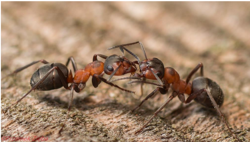
Slika 7. Interakcija dviju jedinki vrste Formica rufa (URL 5)

Mravi, također, mogu komunicirati i dodirom. Vrlo je česta pojava trofalaksije. Taj pojam označava prijenos hrane s jednog mrava na drugog putem usta-usta ili nečisnica-usta. Najčešće je slučaj da radnik koji je prikupljao hranu prilikom dolaska u mravinjak preda tu hranu drugome mravu upravo kroz usta. Mravi se i dodiruju prednjim parom nogu kako bi očistili površinu egzoskeleta, ali često i dodiruju jedne druge radi međusobnog raspoznavanja i dijeljenja informacija (Slika 7; da Silva Camargo i sur. 2017).