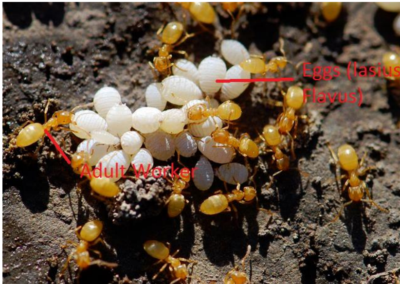
Slika 4. Odrasle jedinice - radnici (adult worker) koji brinu oko jajašca (eggs) vrste Lasius flavus (URL 4)