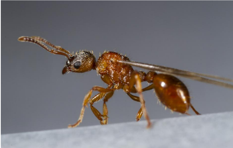
Slika 3. Krilata kraljica vrste Myrmica rubra (URL 2)

Mužjaci mrava zovu se trutovi. Oni posjeduju krila i veći su od radnika (Slika 2). To su haploidne jedinke što znači da nose polovičan broj kromosoma u svim svojim stanicama. Općenito se kod reda Hymenoptera spolovi određuju na temelju ploidijske jedinke. Mužjaci su uvijek haploidni a ženke diploidne. Jedina zadaća trutova je da oplode kraljicu tokom svadbenog leta koji se najčešće događa kada su vremenske prilike pogodne – toplo i mirno vrijeme. No ne izlijeću svi trutovi i kraljice u istom danu iz mravinjaka već neki ostaju kao rezerva te izlaze nekoliko dana kasnije. S kraljicama se pare u letu ili na tlu (ovisno o vrsti), a nakon parenja ugibaju s obzirom da su ispunili svoju zadaću (Preston-Mafham i Preston-Mafham 2005).