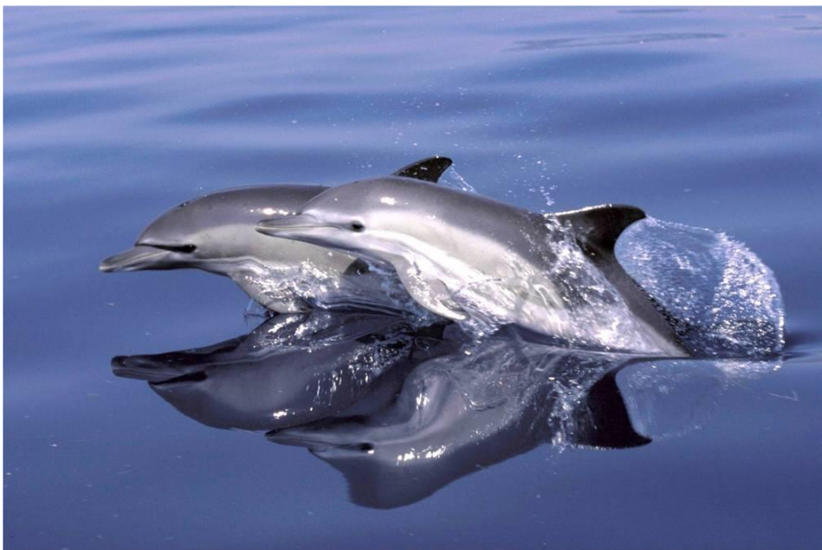
Slika 5. Kratkokljuni obični dupin ( Delphinus delphis ). Izvor:

Kratkokljuni obični dupin ( Delphinus delphis ) je mala kozmopolitska vrsta kita. Nekada je bila raširena po Mediteranu i smatrala se najbrojnijom vrstom kita. Jedina preostala značajna populacija može se pronaći u Alboranskom moru. Obični dupini žive u pelagičkim i obalnim vodama (UNEP/MAP, RAC/SPA, 2014), a ovisno o staništu, hrane se različitom vrstom plijena. Prehrana im se sastoji od manje ribe koja se kreće u plovama, kao što su haringe, inćuni, srdele te glavonožaca ( https://www.plavi-svijet.org/zastita/vrste/kitovi/obicni-dupin/ ).