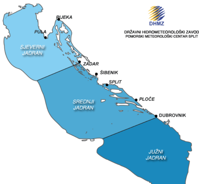
Slika 1.

Jadransko more, nazvano po lučkom središtu antike, Adriji, dio je Sredozemnog mora između Balkanskog i Apeninskog poluotoka. Pred kraj zadnjeg glacijala, prije 18 000 godina, ledenjaci se počinju otapati, a dugi sinklinalni Jadranski bazen se puni vodom koja je stizala kroz Otrantska vrata. 75 km široka Otrantska vrata spajaju Jadransko more s Jonskim, odnosno s ostatkom Sredozemlja. Vrhovi nekadašnjih planina tada su postali otoci, a doline zaljevi i morski prolazi. Kao posljedica, smjer pružanja otoka prati smjer pružanja planina na kopnu. Ti događaji uzrok su razvedenost obale Jadrana, a u cijelom se svijetu takav tip obale prema jadranskom modelu naziva dalmatinski tip obale. Njegova zatvorenost razlog je oligotrofnosti Jadranskog mora, ali specifični uvjeti sjevernog dijela učinili su taj dio mora jednim od najproduktivnijih područja u čitavom Sredozemlju. Rijeka Po (Pad) i druge alpske rijeke utječu u sjeverozapadni dio Jadrana i na taj način mijenjaju koncentraciju hranjivih tvar. Pod njihovi utjecajem je i slanost mora, koja je znatno niža na sjeverozapadnom dijelu bazena (35‰) nego na jugoistočnom (38‰).