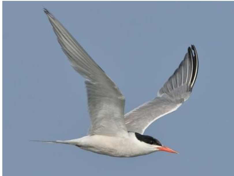
Slika 1. Crvenokljuna čigra (Izvor: AllAboutBirds)

Crvenokljuna čigra ( Sterna hirundo ), morska je ptičja vrsta čija je aktivnost usko vezana uz vodena staništa na kopnu i na moru. Pripada porodici galebova ( Laridae ) na koje i podsjeća svojom bijelom bojom perja s nijansama sive te crnom bojom perja na glavi. Pored toga, karakteriziraju ju još i narančaste noge te narančasti ili crveni kljun (Slika 1).