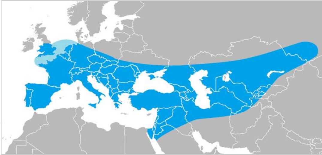
Slika 1. Geografska rasprostranjenost neandertalaca (Ryulong 2016).

Homo neanderthalensis evoluirao je u Europi iz populacija ranijih hominina (Power, 2019). Kasnije, dio populacije neandertalaca migrira prema jugu u zapadnu Aziju (Levant) te prema istoku na prostor srednje Azije sve do Uzbekistana i Kavkaza (sl. 1) (Jordan 1999, Janković i Karavanić 2009).