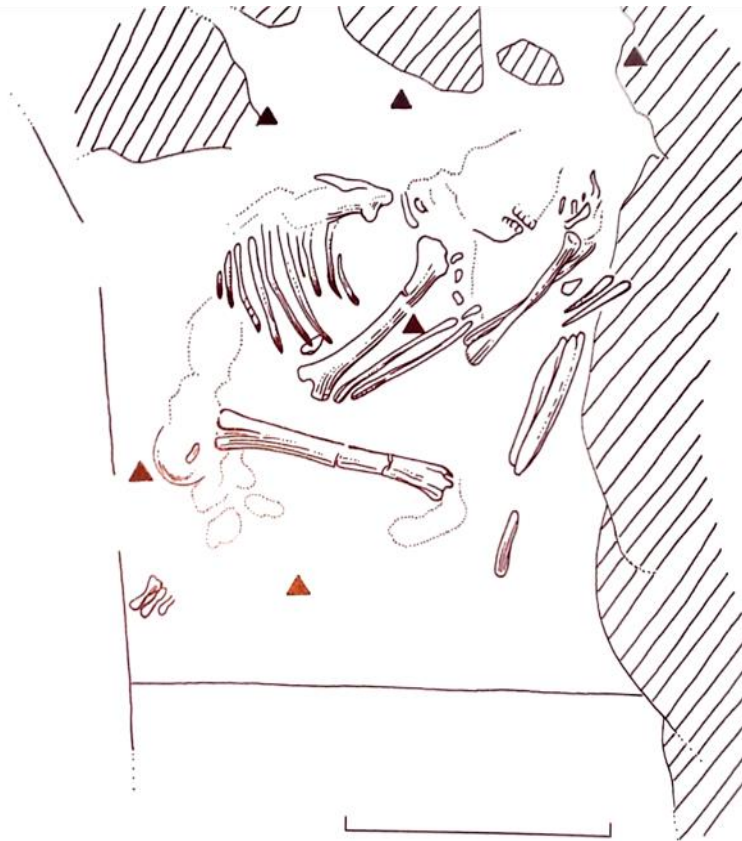
Slika 4. Ukop neandertalca (Shanidar 4) u Iraku (Janković i Karavanić 2009).

Na nalazištu Teshik-Tash (Uzbekistan) pronađen je kostur djeteta koje je bilo ukopano zajedno s rogovima sibirske divokoze ( Capra siberica ). Rogovi okružuju dijete i položeni su okomito u sloju vrhovima orijentirani prema dolje. Divokoza je bila česti plijen neandertalaca te su njene kosti i rogovi sveprisutni na nalazištu te možda nisu namjerno položeni u grob. Također na kostima ma tragova zubi životinja što znači da su vjerojatno životinje naknadno otkopale grob (Jordan 1999, Janković i Karavanić 2009).