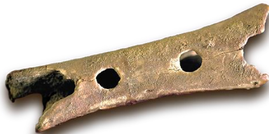
Slika 5. “Frula”s nalazišta Divje Babe u Sloveniji (Archaeological Park Divje Babe 2018).

Neandertalski predmeti kojima bi se moglo pripisati simbolično značenje uglavnom su fragmenti kosti koji imaju rupe ili gravure koje se čine namjerno napravljenima (Mellars 1996). Neki su primjeri probušeni zub lisice i probušene falange jelena s nalazišta La Quina i zubi špiljskog medvjeda (nalazište Scladina, Belgija). Zanimljive su probušene falange i mandibule špiljskog medvjeda koje nalikuju fruli i puhanjem produciraju zvuk u pronađene u nalazištu Divje Babe u Sloveniji (sl. 5). Ovi nalazi predstavljaju mogući glazbeni instrument (Janković i Karavanić 2009).