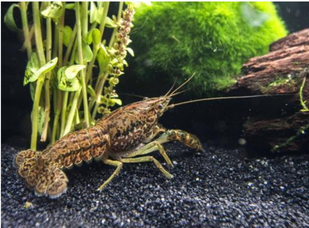
Slika 1. Mramorni rak

Mramorni rak pripada porodici Cambaridae koja uključuje 12 rodova i karakteristična je skupina za Sjevernu Ameriku (Taylor 2002). Rod Procambarus sa svojih 163 vrsta naseljava područje centralnog i istočnog SAD-a, Kubu i Meksiko (Hobbs, 1988). Ovom rodu pripada i relativno nedavno otkrivena invazivna strana vrsta u Europi, mramorni rak Procambarus virginalis (Lyko, 2017). Dobio je ime „mramorni rak“ prema uzorku na tijelu (Slika 1) koji podsjeća na mramor (Martin i sur. 2010). Obično živi u plitkim vodama koje imaju smanjeno strujanje vode, te na mekanom supstratu kao što je mulj (Chucholl i Pfeiffer 2010).