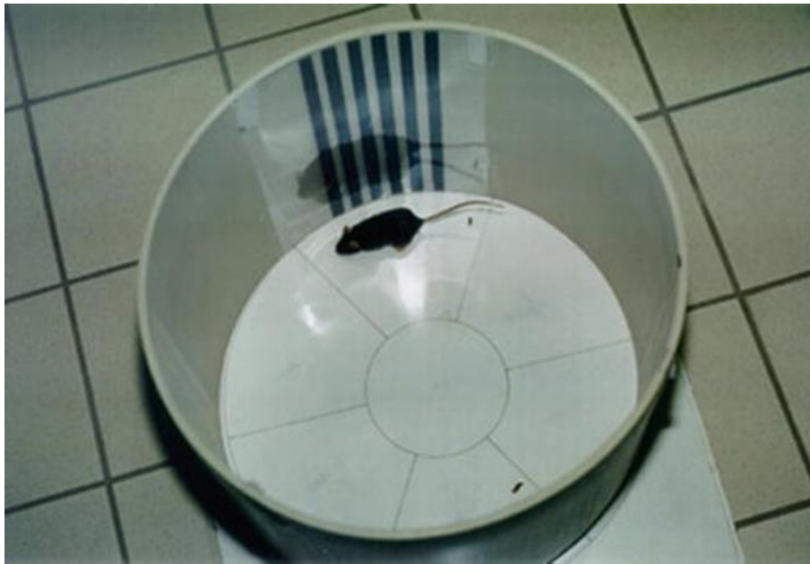
Slika 2. Primjer OF-a okruglog oblika koja se koristi u testu otvorenog polja.

U drugom primjeru OFT se provodio u OF-u kružnog oblika, a miš je bio životinja čije se ponašanje istraživalo (Slika 2). Dimenzije OF-a su 40 cm u promjeru te 30 cm visine. Pod je podijeljen na središnji kružni dio koji predstavlja centralni dio OF-a te na 6, radijalnim linijama podijeljenih, polja koja čine njegov periferni dio (Belzung 2014).