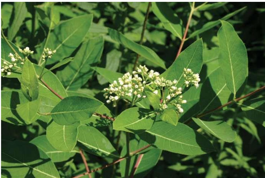
Slika 4. Apocynum cannabinum L. (indijska konoplja)