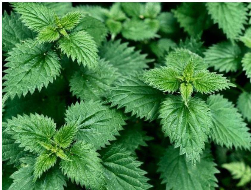
Slika 7. Urtica dioica L. (kopriva)