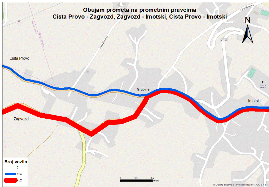
Sl. 8. Obujam prometa na odabranim pravcima poslijepodne od ponedjeljka do četvrtka

Treći pravac na slici 7. i 8. je i najznačajniji, a to je pravac Zagvozd – Imotski. Može se reći da taj pravac tijekom cijelog dana i u prijedodnevnom i poslijepodnevnom satima ima velik obujam. Većina vozila koja obavljaju dostavu, terenski ili drugi poslovi, vozila koja idu prema granici s Bosnom i Hercegovinom, turisti, svi oni koriste ovaj pravac kako bi brže i sigurnije došli od autoceste do Imotskog. Praktički sav promet koji se s autoceste odvija prema Imotskom koristi se ovim pravcem, što je vidljivo iz podataka sa slike. Cjelodnevni promet (od ponedjeljka do četvrtka) ovoga pravca je 4 puta veći od cjelodnevnog prometa na preostala dva pravca zajedno.