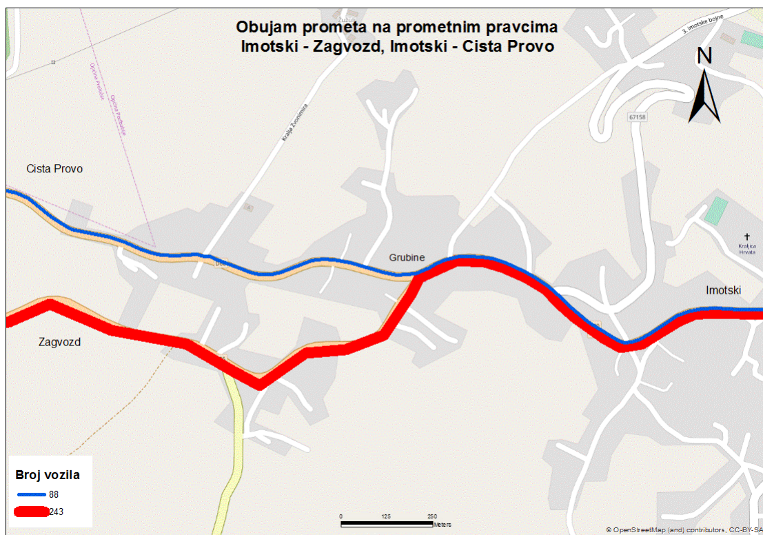
Sl. 15. Obujam prometa na odabranim pravcima prijepodne – nedjelja