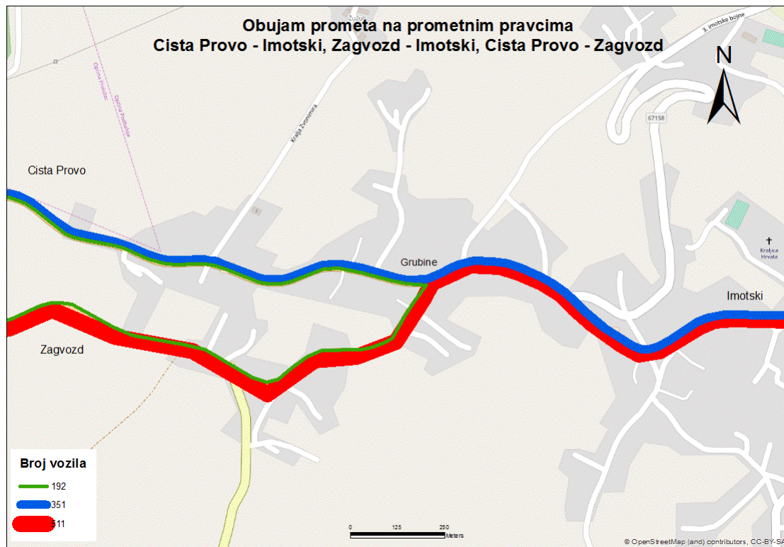
Sl. 12. Obujam prometa na odabranim pravcima poslijepodne – petak