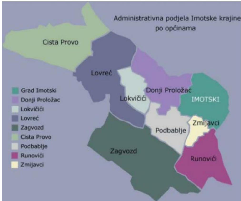
Sl. 2. Smještaj Grada Imotskog u administrativnoj podjeli Imotske krajine po JLS-a

upravno-administrativne, kulturno-prosvjetne i gospodarske funkcije ove prostorne cjeline (Arching Split, 2015).