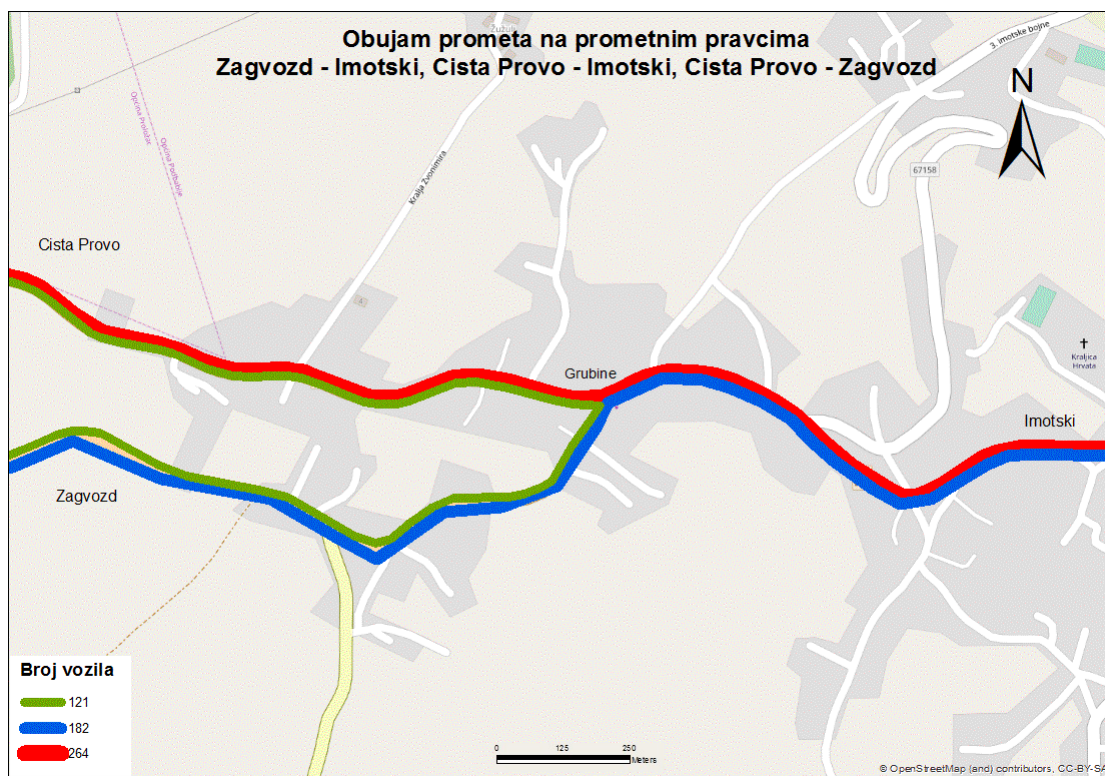
Sl. 18. Obujam prometa na odabranim pravcima poslijepodne – nedjelja