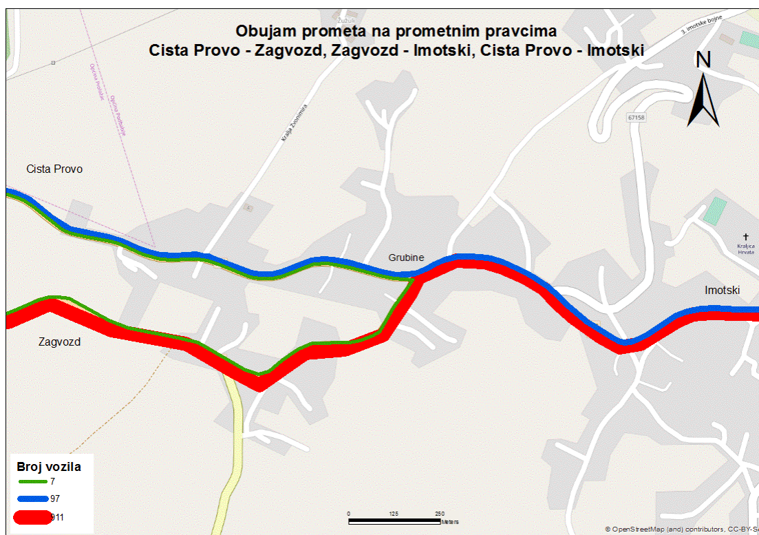
Sl. 7. Obujam prometa na odabranim pravcima prijedodne od ponedjeljka do četvrtka

U jutarnjim satima, tim pravcem u prosjeku od ponedjeljka do četvrtka prođe najmanje vozila od svih promatranih pravaca. To je pravac koji je najmanje korišten iz više razloga, a najvažniji je taj da je sam smještaj Ciste Provo nije povoljan za korištenje ovog čvora autoceste. Promet koji se odvija na ovom pravcu je manji nego na ostala dva pravca s ove dvije slike. Pravac Cista Provo – Imotski u prijedpodnevnom i poslijepodnevnom brojanju daje nam gotovo identične podatke. S obzirom na to da je Imotski centar ove regije i da ima funkcije koje imaju karakter subregionalnog centra, većina prometa ovog prometnog pravca obavlja se zbog potreba stanovništva Ciste Provo za dolaskom u Imotski i obavljanja svojih obaveza. Manji dio stanovništva tog mjesta obavlja svoje dnevne migracije zbog posla ovim pravcem što se vidi iz manjeg broja vozila u prijedpodnevnim satima. Dodatni razlog je i veća blizina Splita i manje vrijeme potrebno za putovanje do tog regionalnog centra.