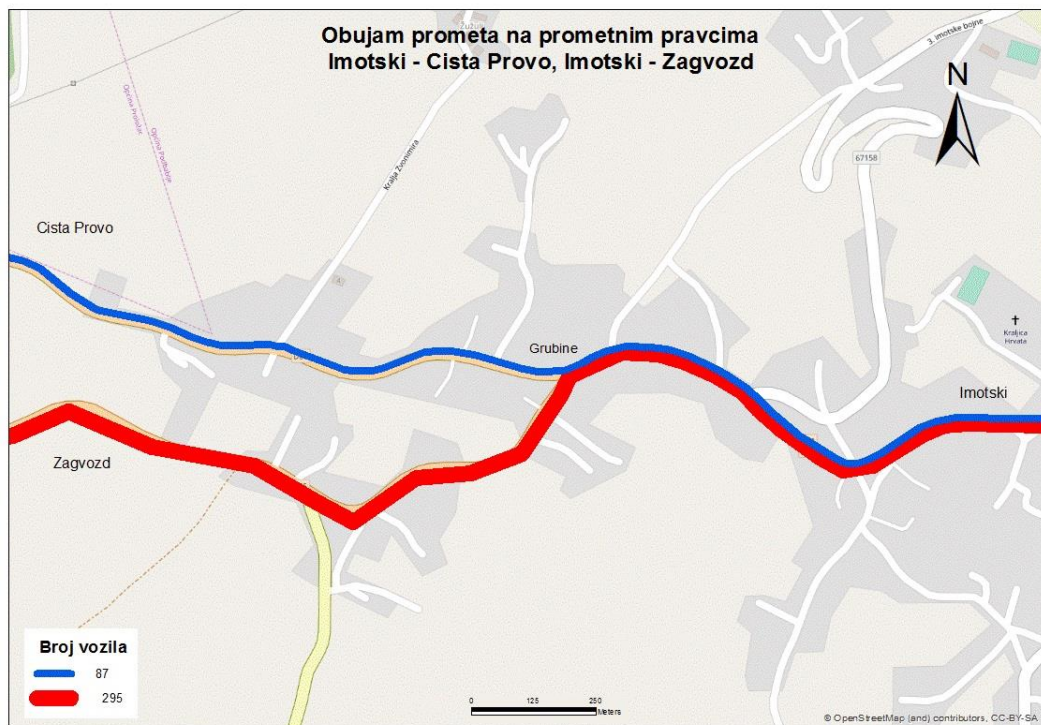
Sl. 10. Obujam prometa na odabranim pravcima poslijepodne – petak