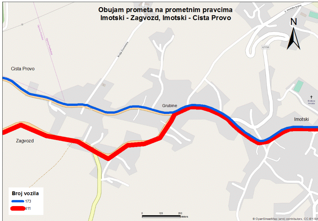
Sl. 16. Obujam prometa na odabranim pravcima poslijepodne – nedjelja