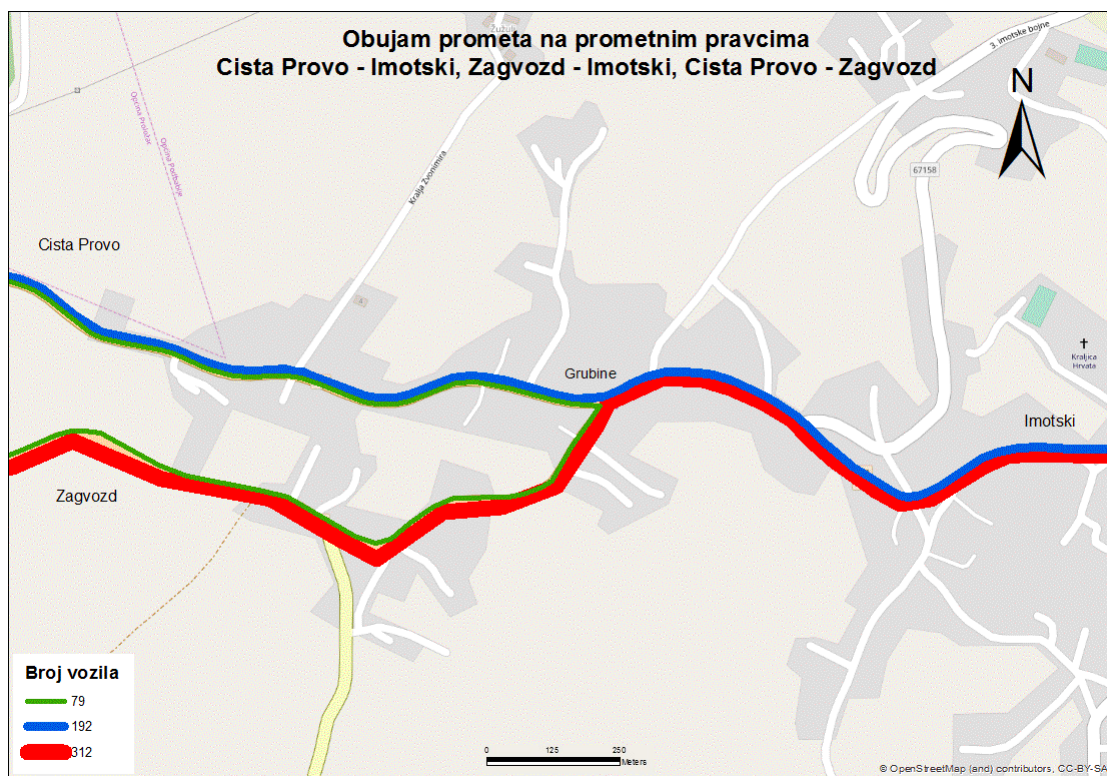
Sl. 11. Obujam prometa na odabranim pravcima prijepodne – petak