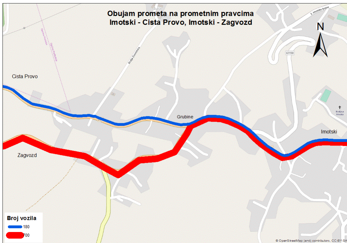
Sl. 5. Obujam prometa na odabranim pravcima prijepodne od ponedjeljka do četvrtka