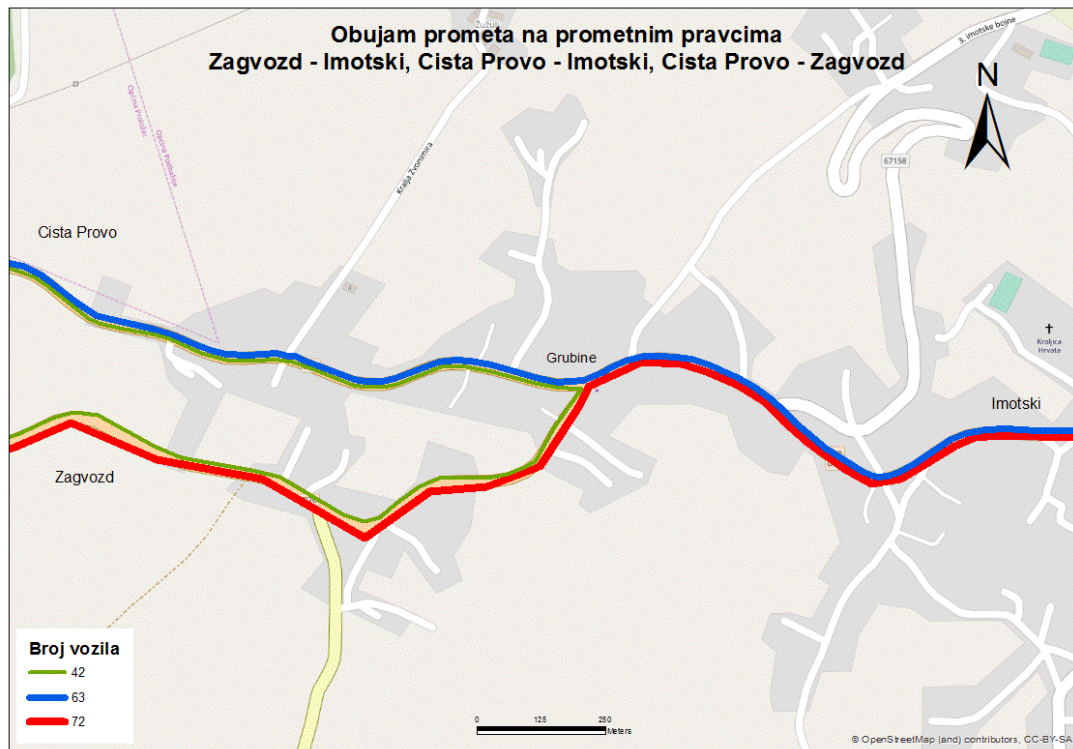
Sl. 17. Obujam prometa na odabranim pravcima prijedpodne – nedjelja

Slike 17. i 18. prikazuju ostale pravce u prijedpodnevnim i poslijepodnevnim satima.