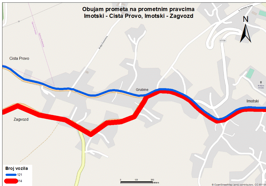
Sl. 6. Obujam prometa na odabranim pravcima poslijepodne od ponedjeljka do četvrtka