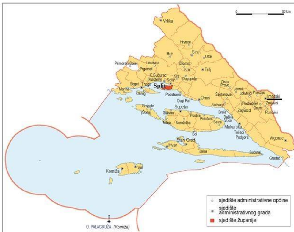
Sl. 1. Položaj Grada Imotskog u Splitsko-dalmatinskoj županiji

Imotska krajina i Grad Imotski administrativno pripadaju Splitsko-dalmatinskoj županiji i nalaze se na sjevernoj strani planine Biokovo, između Bosne i Hercegovine i Dalmacije. Ta je povijesno-geografska cjelina dio Dalmatinske zagore i omeđena je granicom s Bosnom i Hercegovinom na sjeveru, Makarskim primorjem na jugu, na zapadu Sinjsko-Omiškim prostorom, te Vrgoračkim krajem na istoku. Položaj Grada Imotskog prikazan je na slici 1.