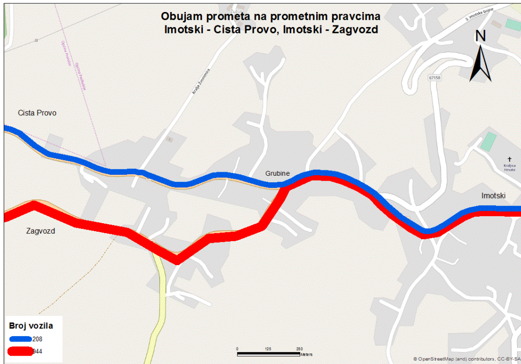
Sl. 9. Obujam prometa na odabranim pravcima prijepodne – petak

ljudi koji u ranijim jutarnjim satima koriste ovaj pravac zamjetan, da bi u nešto kasnijim jutarnjim satima taj broj jako pao.