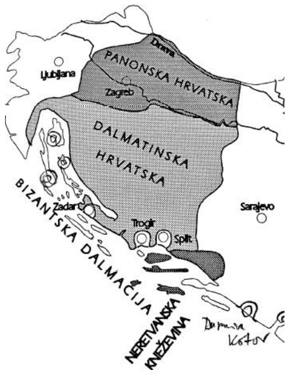
Sl. 2. Hrvatske zemlje u 9. stoljeću