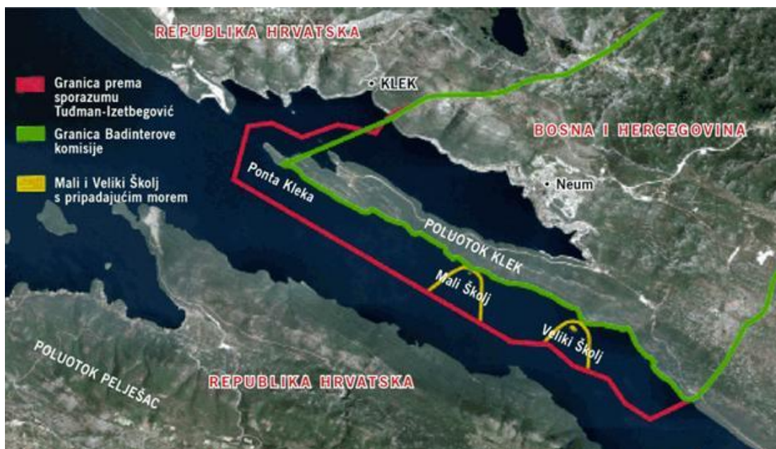
Sl. 13. Razlika u razgraničenju prema Badinterovom povjerenstvu i sporazumu Tuđman-Izetbegović

Još jedan problem odnosio se na izgradnju Pelješčkog mosta preko malostonskog zaljeva između Komarne i Brijesta na Pelješcu. Iako se most gradi na području koje nije u dometu spornog teritorija (vrh poluotoka Kleka), Bosna i Hercegovina je njegovu izgradnju smatrala smetnjom za ulazak brodova u Neumski zaljev – zaljev u kojem ne postoje ni uvjeti ni razlozi za ulazak i prihvat brodova kojima bi most bio prepreka (Klemenčić i Topalović, 2009).