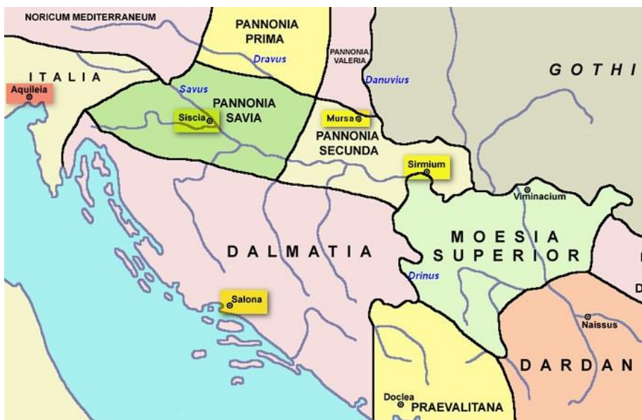
Sl. 1. Prikaz rimskih provincija Panonije i Dalmacije

Dalmatinska provincija obuhvaćala je sredozemni i dinarsko-planinski prostor od Raše na zapadu do Drine na istoku, odnosno od peripanonskog prostora današnje Bosne na sjeveru do Jadranskog mora na jugu, a sjedište joj je bilo u Saloni (današnji Solin) (Rogić, 1992). Zahvaljujući tim rimskim provincijama na području današnje Hrvatske stvorena je cestovna mreža te prva hijerarhija naselja sa središtima Salonom, Sisciom i Sirmiumom.