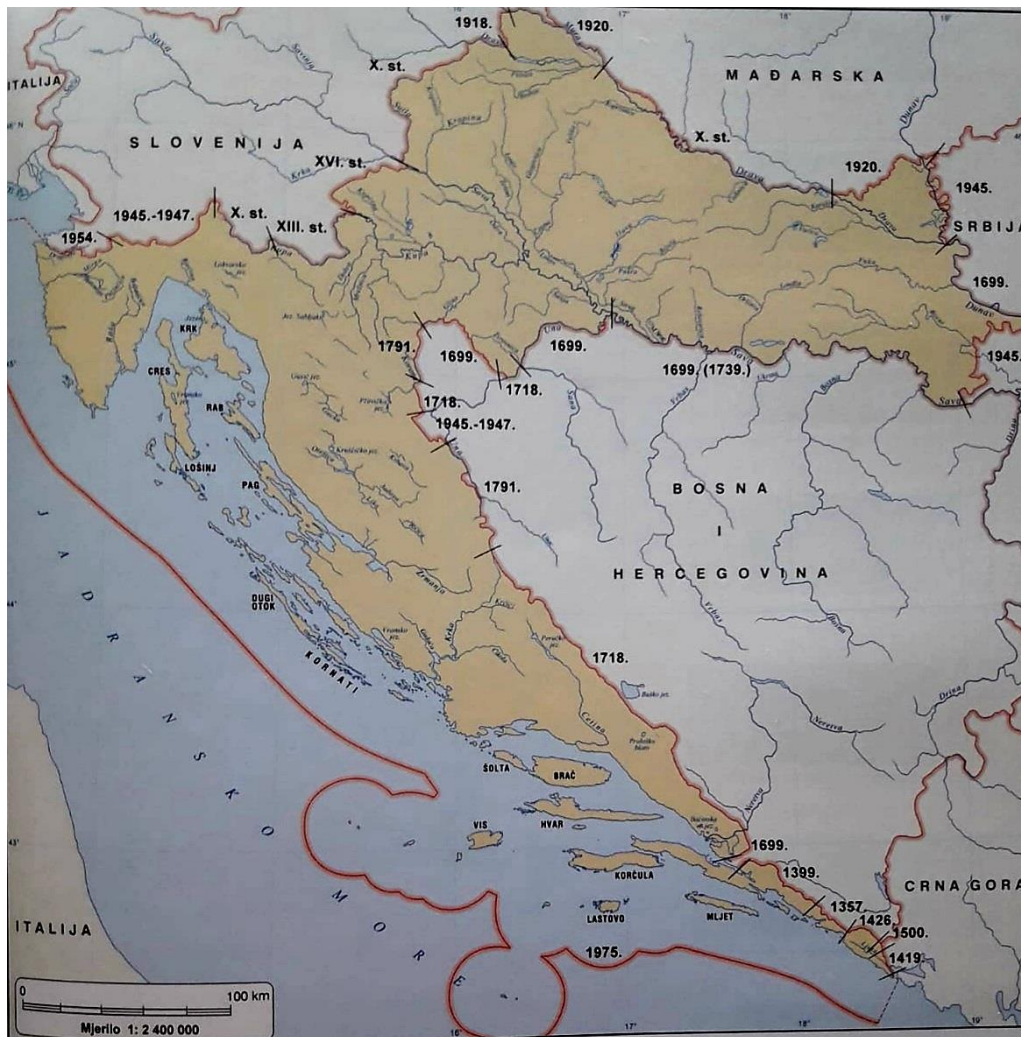
Sl. 10. Povijesni razvoj nastanka hrvatske državne granice