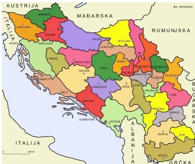
Sl. 6. Podjela Kraljevine SHS na 33 oblasti