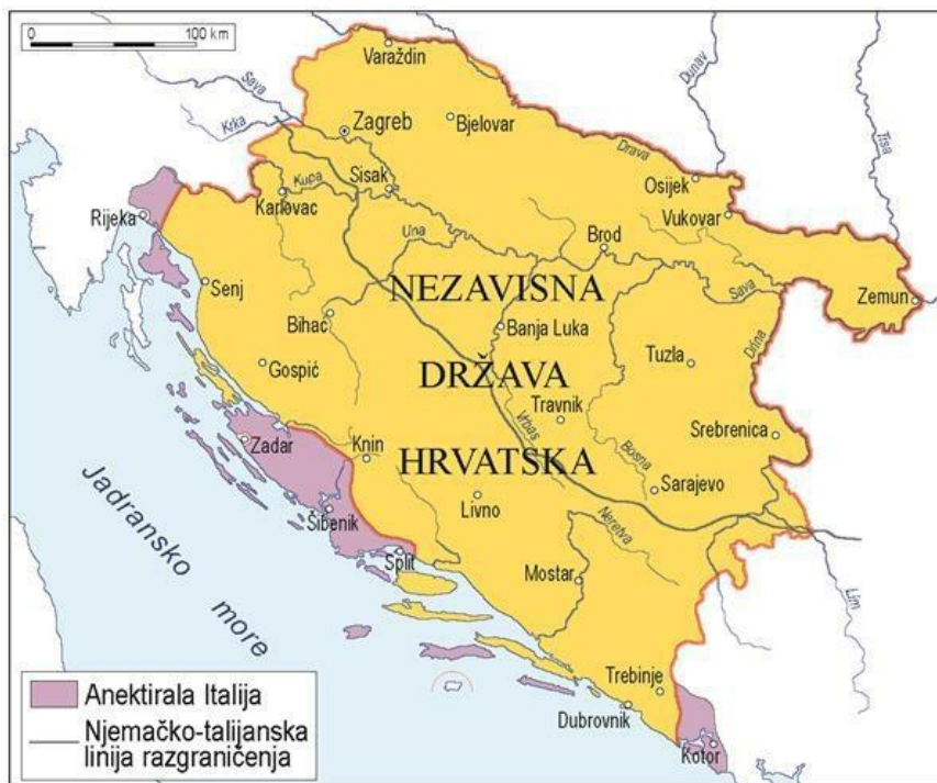
Sl. 9. Nezavisna Država Hrvatska 1941. godine