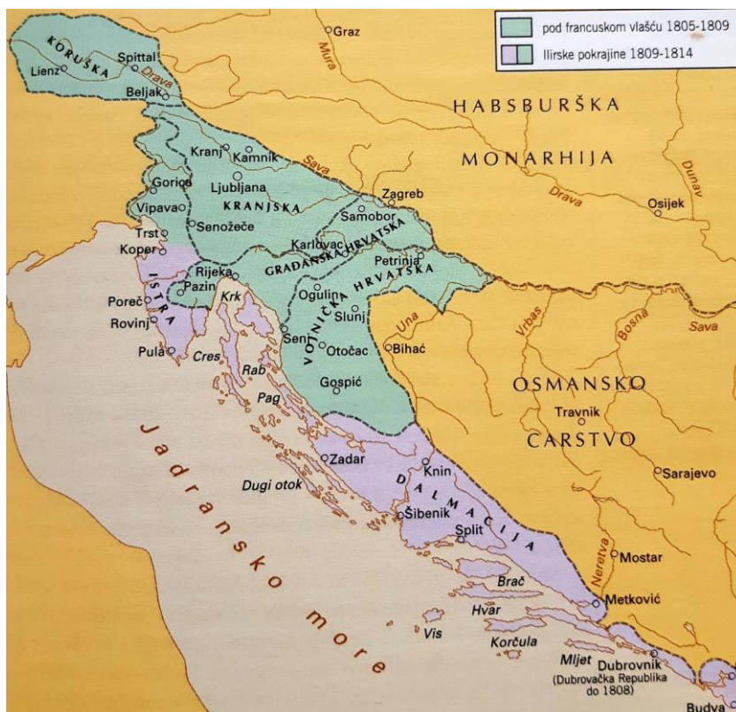
Sl. 5. Ilirske pokrajine Francuskog Carstva

Godine 1797. u napoleonskim ratovima prestaje postojati Mletačka Republika pa su njeni posjedi u Istri, Dalmaciji i Boki kotorskoj pripojeni Habsburškoj Monarhiji. Međutim, 1805. godine mirovnim sporazumom u Požunu poražena Habsburška Monarhija morala je Napoleonu i Francuskoj prepustiti te teritorije. Tijekom sljedeće godine francuska je vojska zauzela Istru i Dalmaciju, a 1808. godine i Dubrovnik čime prestaje postojati višestoljetna Dubrovačka Republika. Mirom u Schönbrunnu 1809. godine u svim hrvatskim krajevima južno od Save uspostavljena je francuska vlast te su na tom području, zajedno sa slovenskim zemljama, stvorene Ilirske pokrajine Francuskog Carstva sa sjedištem u Ljubljani (sl. 5.), ali već 1813. godine Napoleonovim porazom one se vraćaju u sastav Habsburške Monarhije. Hrvatska se ponovno suočila s cijepanjem – nekadašnja mletačka Dalmacija, Dubrovačka Republika i Boka kotorska ujedinjene su u jedinstvenu pokrajinu Dalmaciju koja je bila podređena izravno Beču, a ostatak francuskih Ilirskih pokrajina trebao je ostati zasebna kraljevina (Goldstein, 2008).