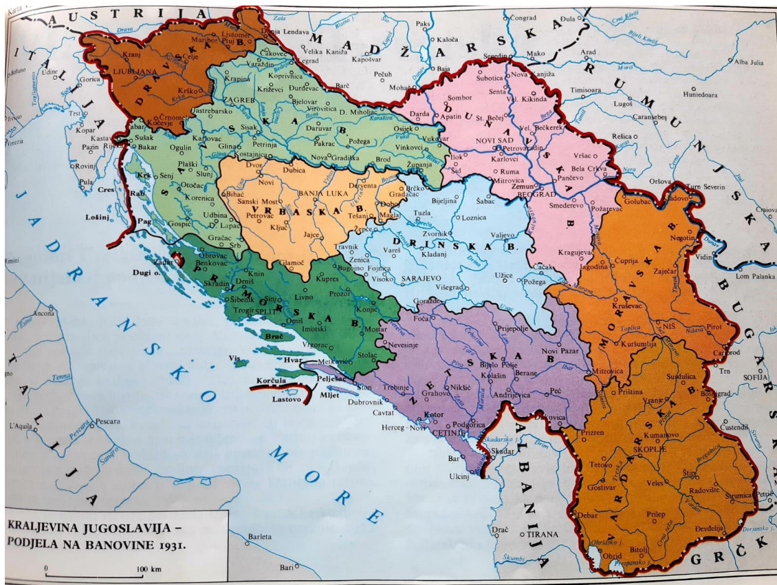
Sl. 7. Podjela Kraljevine Jugoslavije na Banovine 1931. godine