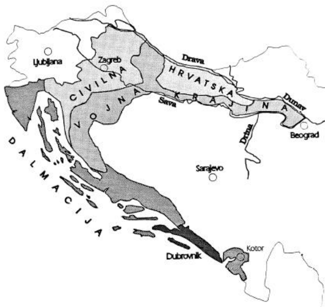
Sl. 3. Podjela Hrvatske na Civilnu Hrvatsku i Vojnu krajinu