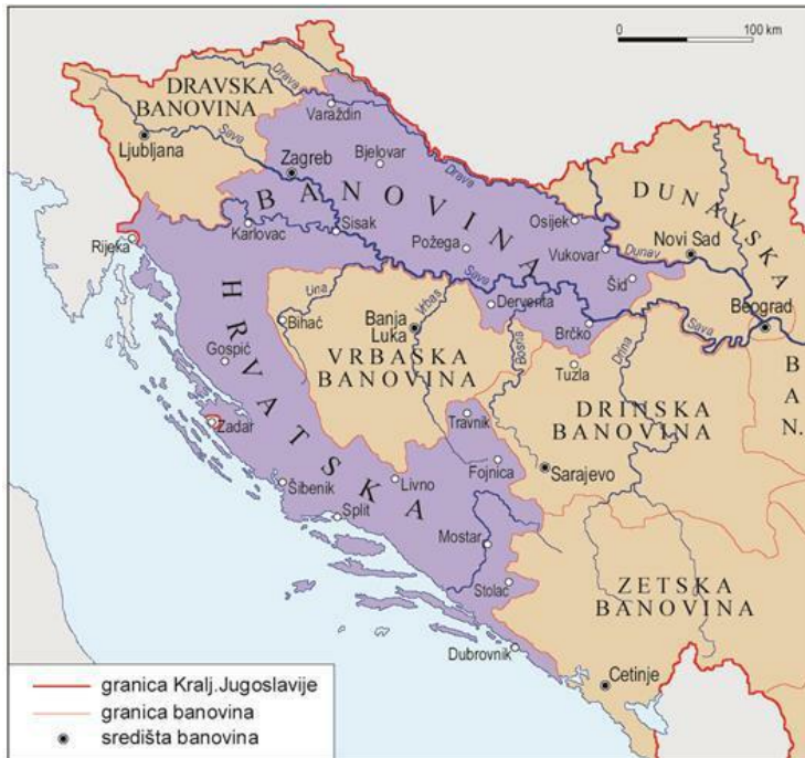
Sl. 8. Banovina Hrvatska 1939. godine

Ona je obuhvaćala područje Hrvatske i Bosne i Hercegovine, ali bez najvećeg dijela dalmatinskog primorja koje je Rimskim ugovorima ustupljeno Italiji, kao i bez Međimurja koje je pripojeno Mađarskoj (Boban, 1992).