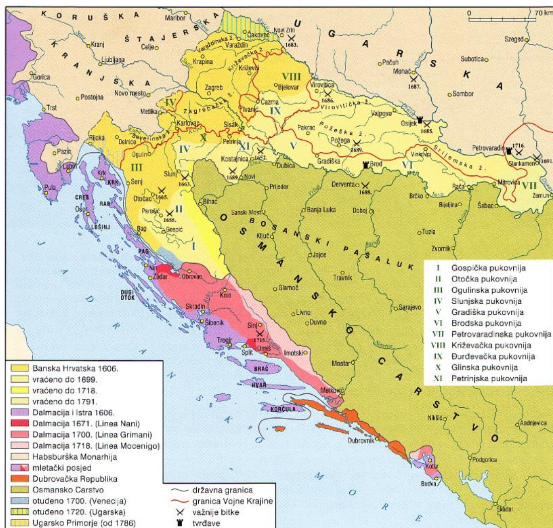
Sl. 4. Mijenjanje hrvatskih i mletačkih granica u vrijeme osmanlijskih osvajanja