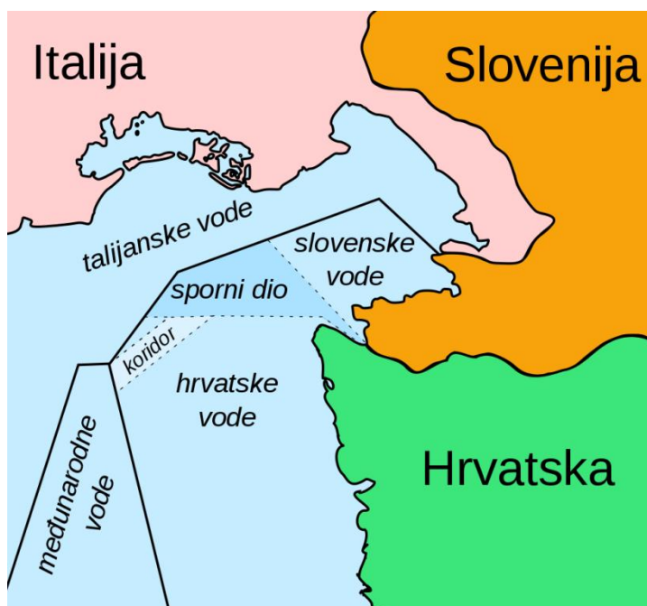
Sl. 12. Granični spor u Piranskom zaljevu