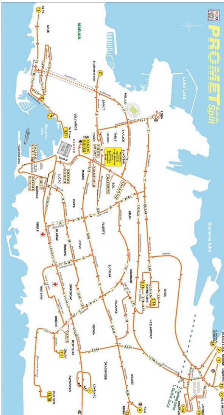
Sl. 3. Mreža autobusnih linija grada Splita i urbanog područja