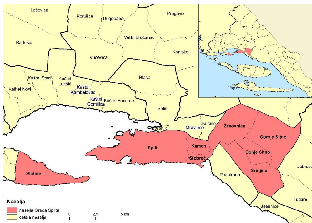
Sl. 1. Prostorni obuhvat Grada Splita 2020. godine

Osim grada Splita kojeg sačinjava 27 gradskih kotara (Bačvice, Blatine Škrape, Bol, Brda, Grad, Gripe, Kman, Kocunar, Lokve, Lovret, Lučac Manuš, Meje, Mejaši, Mertojak, Neslanovac, Plokite, Pujanke, Ravne Njive, Sirobuja, Spunit, Split 3, Sućidar, Šine, Trstenik, Varoš, Visoka, Žnjan), u Grad Split spada i nekoliko obližnjih naselja: Donje Sitno, Gornje Sitno, Kamen, Slatine, Srinjine, Stobreč i Žrnovnica (Grad Split, 2020). Za potrebe ovog završnog rada, izradit će se analiza javnog prijevoza koja obuhvaća Grad Split, izuzev naselja Slatine. Iako naselje Slatine administrativno spada pod Grad Split, nalazi se na sjeveroistočnoj strani otoka Čiova.