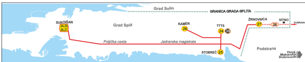
Sl. 2. Mreža autobusnih linija Grada Splita

Na slici 2 i 3 prikazane su mreže autobusnih linija Grada Splita. Slika 2 prikazuje linije koje povezuju centar grada s gradskim naseljima Stobreč, Kamen, Žrnovnicu, Sitno te sa Trgovačko-transportnim terminalom Split, odnosno TTTS-om.