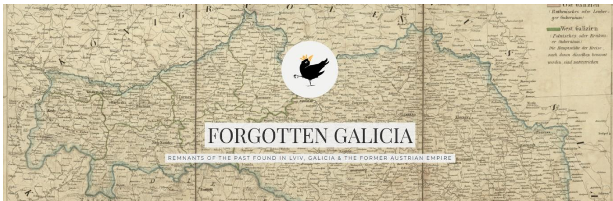
Sl. 6. Primjer bloga koji se bavi očuvanjem baštine habsburške Galicije

Galicija je jedna od kulturnih regija koje su u osnovi formirale povijest Srednje Europe, ali su u 20. stoljeću gotovo potpuno uništene kroz svoj unutarnji pluralitet. Ipak, interes za Galiciju posljednjih je godina izrazito porastao ne samo u Poljskoj i Ukrajini već i u Sjedinjenim Američkim Državama (sl. 6), Izraelu i ostatku Europe (Purchla, 2007: 262).