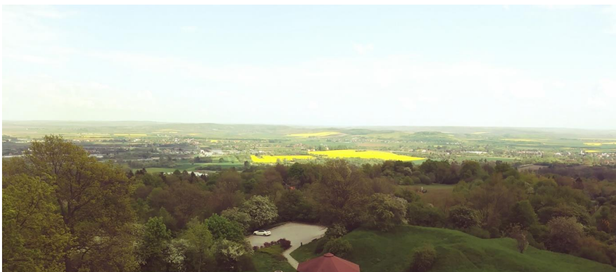
Sl. 4. Pogled na poljsko-ukrajinsku granicu, Przemyśl 2019.

Podijeljena rijekom San, Galicija ima dva glavna grada: Krakov na zapadu i Lavov na istoku (sl. 3). Rijeka San se također približno podudara s etnolingvističkom granicom između Poljaka i Ukrajinca (Hann i Magocsi, 2005).