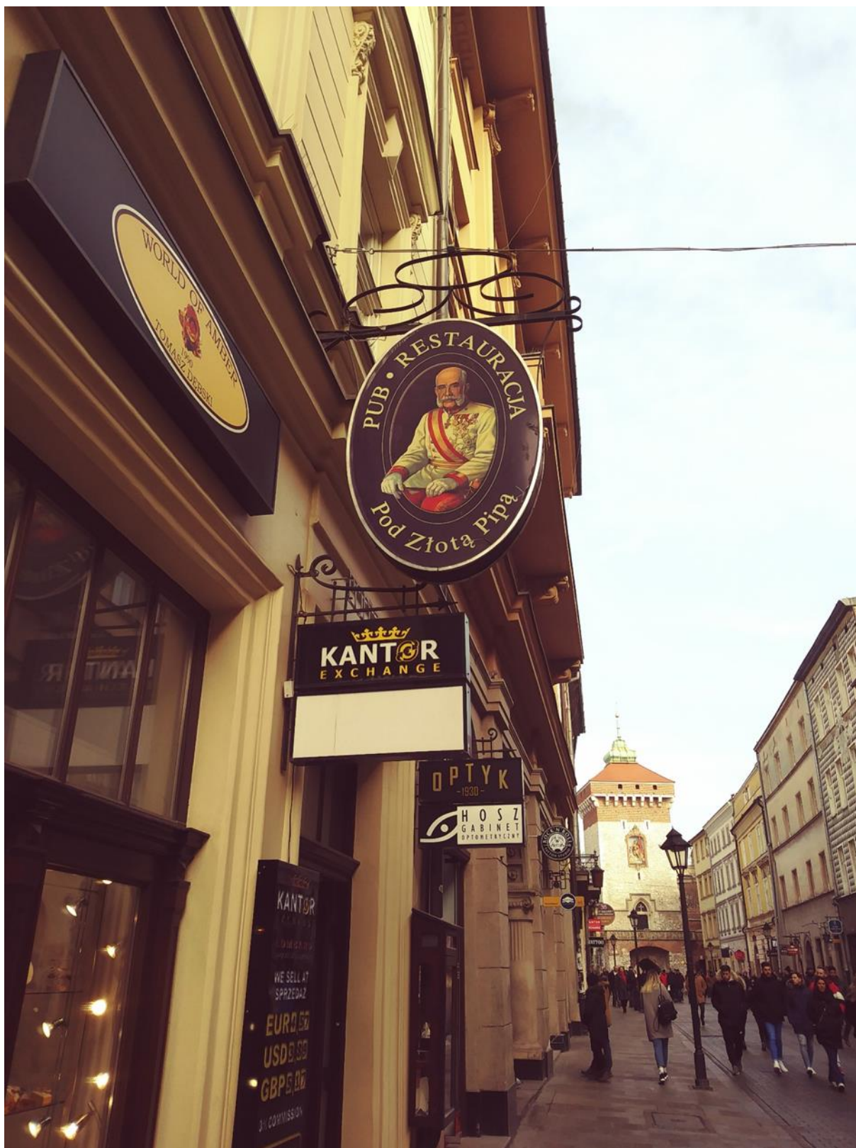
Sl. 5. Portret Franje Josipa I. korišten kao vanjska oznaka restorana, centar Krakova 2019.