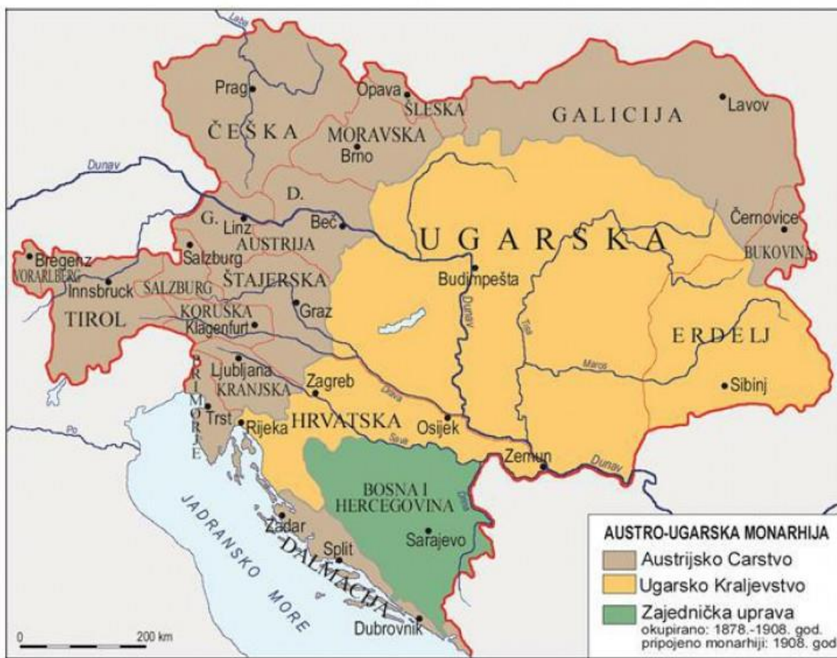
Sl. 1. Austro-Ugarska Monarhija 1908.