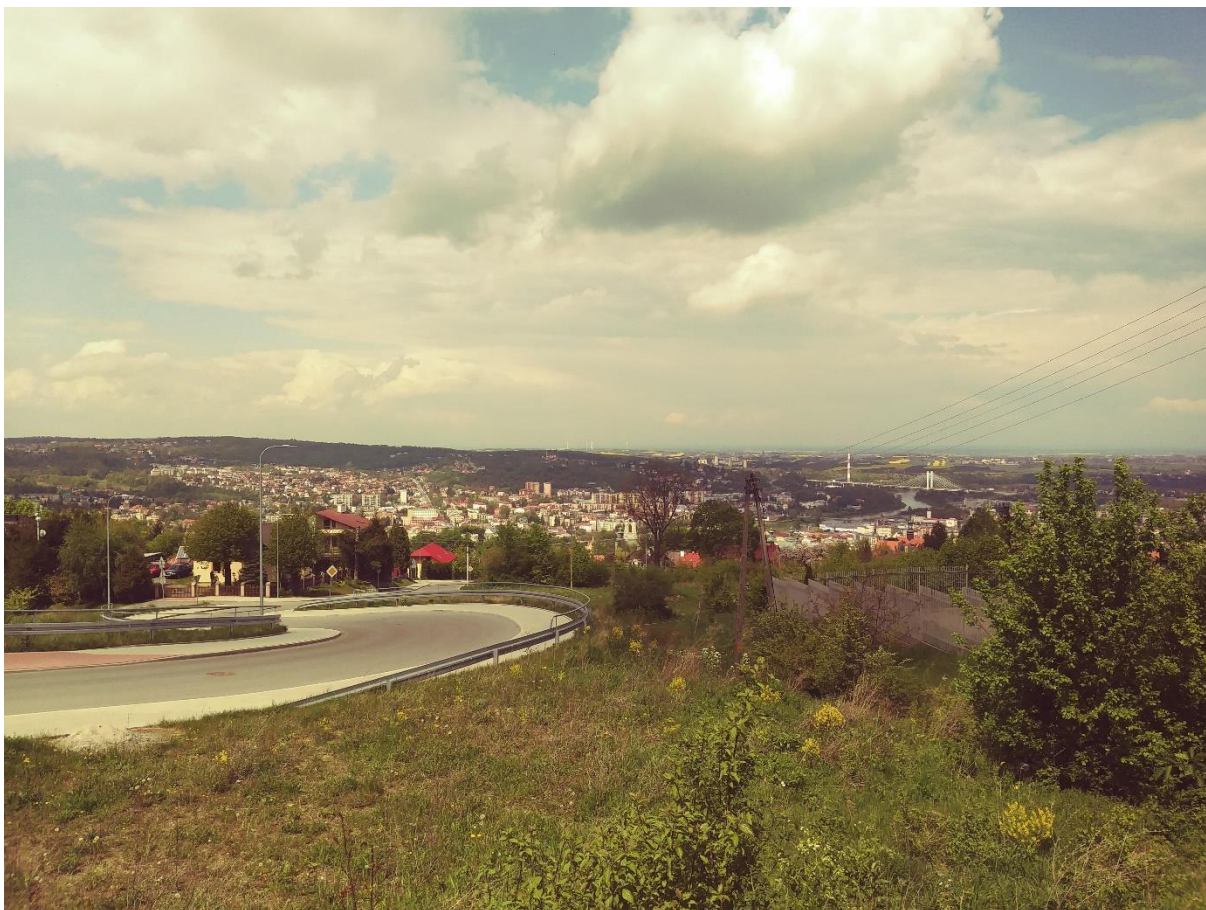
Sl. 2. Vizura grada Przemyśla i rijeka San, Przemyśl 2019.