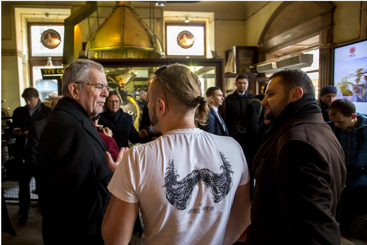
Sl. 7. Austrijski predsjednik u lavovskoj kavani 2018. godine