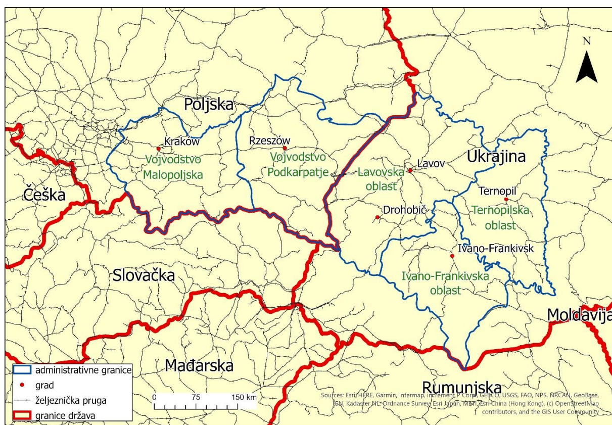
Sl. 8. Današnji prostorni obuhvat administrativno-političkih jedinica koje čine Galiciju

Galicija se tako pamti kao „posljednja Europa“, multinacionalni kozmos pometen u kaosu dva svjetska rata i posljedičnom nametanju bezuvjetnog izbora jezika, nacionalnosti i ideološkog bloka (Bialasiewicz, 2003). Nakon pada Berlinskog zida dolazi do novih geopolitičkih odnosa u ovom dijelu Europe. Galiciju danas dijeli granica Srednje i Istočne Europe, tj. podijeljena je između Poljske i Ukrajine. Zapadni dio Galicije obuhvaćen je dvama poljskim vojvodstvima, Malopoljskim i Podkarpatskim. Poljska vojvodstva su formirana nakon reforme upravne podjele 1995. te u njima nije sačuvano galicijsko ime. Istočna Galicija teritorijalno odgovara danas trima ukrajinskim oblastima, Lavovskoj, Ivano-Frankivskoj i Ternopilskoj, nazvanima prema glavnim gradovima (sl. 8). Galicijsko ime nije sačuvano ni na političkoj karti Ukrajine (Klemenčić, 2015).