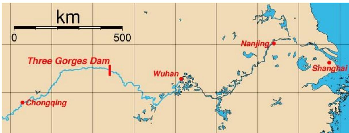
Slika 2. Prikaz smještaja Hidroelektrane Tri klanca i najveći gradovi na rijeci Chang Jiang

najkraći od triju klanaca rijeke Chang Jiang. Tri klanca rijeka je izdubila dok se prebijala preko planinskog ruba velikog kineskog Sečuanskog bazena. Slikoviti klanac Wu dug je 40 km, a njime dominira dvanaest Vilinskih vrhova. Klanac Xiling nekoć je bio najopasniji klanac, s uskim stazama, grebenima, brzacima i virovima. Pedesetih godina 20. stoljeća goleme stijene koje su izvirivale iz sredine riječnog toka uništene su eksplozivom kako bi plovidba rijekom bila sigurnija (Buchanan, 2005). Brana se nalazi neposredno uz klanac Xiling, 38 km uzvodno od brane Gezhouba. Gezhouba je prva brana kojom je pregrađena rijeka Chang Jiang. Brana Gezhouba također je bio eksperiment za buduću izgradnju Projekta Tri klanca. Njezina gradnja započela je 1970. godine, a završila 1988. godine. Godišnje je proizvodila 15,8 milijardi kWh električne energije (Nadilo, 2002).