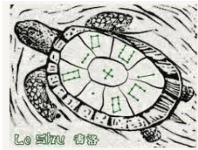
Slika 1.1: Lo Shu kvadrat na oklopu kornjače