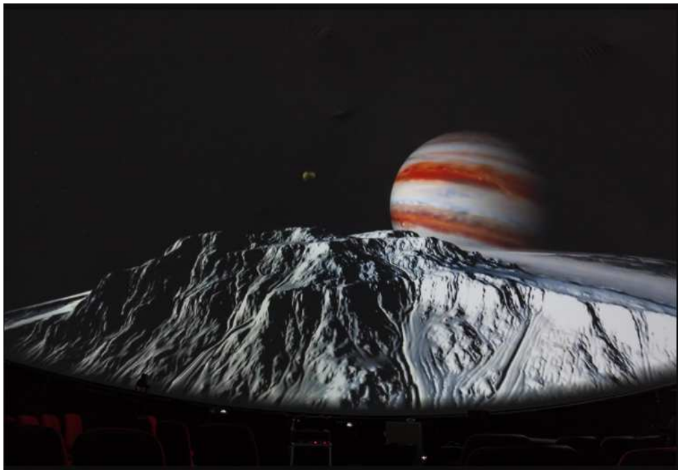
Slika 2.11: Pogled s Europe