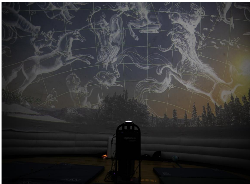
Slika 2.4: Projektor i računalo planetarija