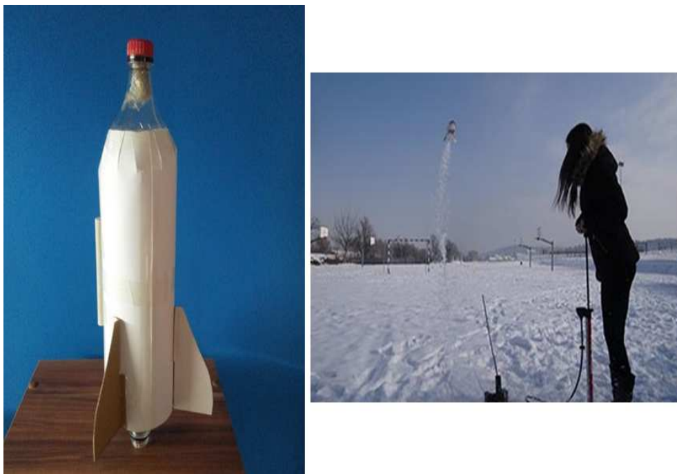
Slika 2.14: Raketa na vodu

za izradu. Za izradu rakete potrebne su dvije plastične boce, karton, ljepljiva traka, kamen i vodilica. Učenici mogu koristiti i drvene bojice te flomastere kako bi ukasili raketu.