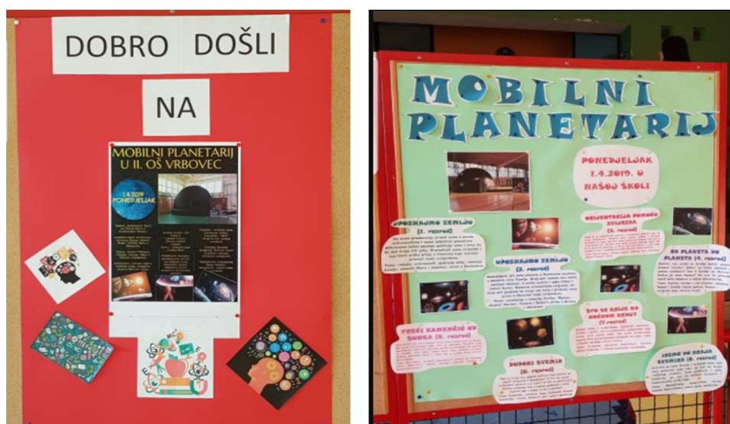
Slika 2.2: Obavijest učenicima o terenskoj nastavi