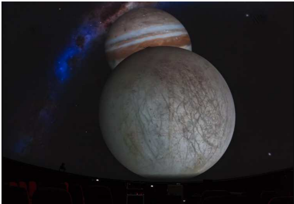
Slika 2.9: Europa