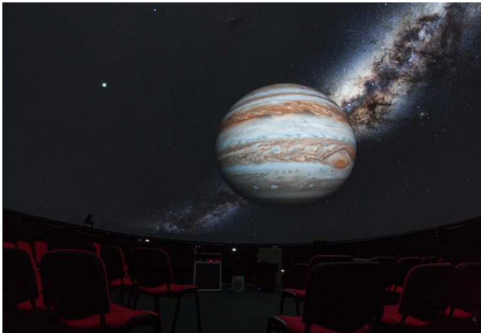
Slika 2.8: Jupiter

Miskonceptije koje učenici vežu uz planete je da su planeti Sunčevog sustava jedini planeti koji postoje u svemiru i da je razlika između planeta i zvijezda u tome što su planeti veći od zvijezda. Pošto samim promatranjem neba učenici ne uočavaju razliku između planeta i zvijezda potrebno je iskoristiti druge mogućnosti planetarija te se tu pomoću filmova lako mogu prikazati razlike u veličini između planeta i zvijezda. Filmovi u planetariju mogu biti dobar izvor znanja, odnosno uočavanja pojava koje ne vidimo na nebu. Oni u planetariju nikad ne smiju biti primaran izvor znanja. U planetariju je moguće promatrati i putanje gibanja planeta s točno označenim trajektorijama, no zbog kupole ta postavka nije najbolje vidljiva.