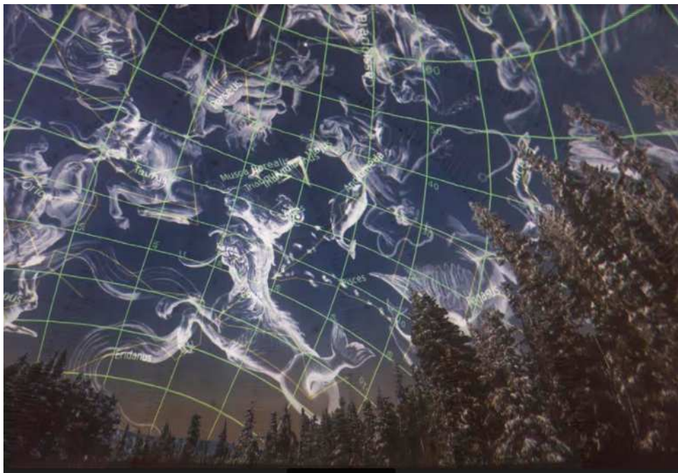
Slika 2.6: Ekvatorski koordinatni sustav

Učenici također mogu tražiti zvijezde pomoću nebeskog ekvatorskog koordinatnog sustava (Slika 2.6) i horizontalnog sustava, dok ekliptičkog sustava nema. Također horizontalni sustav se koristi za kalibraciju slike planetarija.