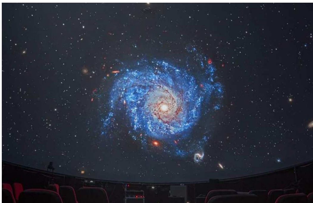
Slika 2.10: Galaksija