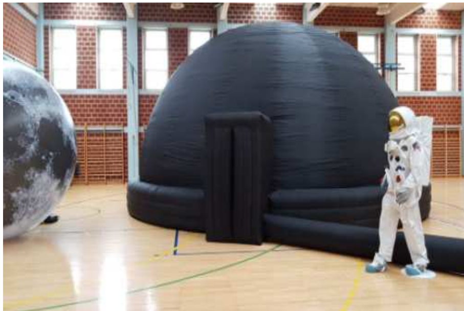
Slika 2.3: Mobilni planetarij

Računalo koristi program Digitalium, a u pozadini je Linux operacijski sustav, no za upravljanje planetarijem nije potrebna ni tipkovnica, ni miš, ni monitor, ni laptop jer se sa svime upravlja pomoću daljinskog upravljača. Planetarij je potrebno opremiti audio sustavom. Za potpuno sastavljanje mobilnog planetarija potrebno je u prosijeku sat vremena. Istovremeno u planetariju može biti od šezdeset do osamdeset djece. U planetariju je moguće promatrati nebo te gledati filmove i slike, te se svi filmovi i slike mogu pohraniti jer računalo ima vanjsku memoriju od 1 TB.