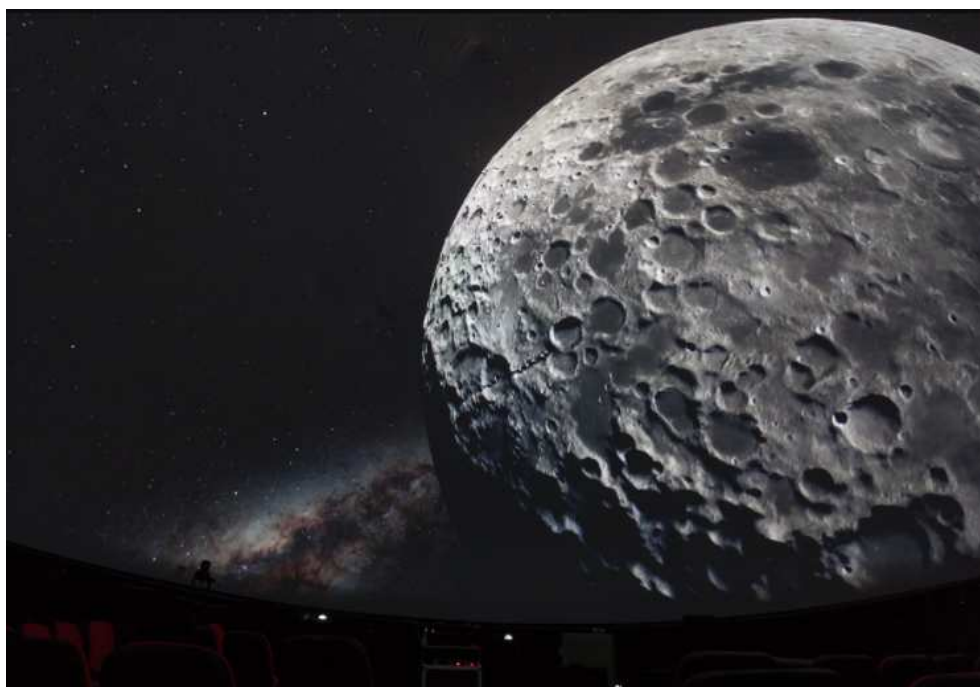
Slika 2.12: Površina Mjeseca

Eruptivna aktivnost vulkana koja na Zemlji mjestimice pridonosi oblikovanju površine na Mjesecu je imala značajnu ulogu jedino u davnoj geološkoj prošlosti toga tijela. Uočavajući brojne kratere na lunarnom tlu, astronomi su nekoliko stoljeća držali kako je Mjesec zasigurno objekt prepun vulkana, pa je on kao takav dugo vremena prikazivan u popularnoj literaturi. Zamisao da bi te jame mogle biti posljedica padova kamenja s neba, sve do razmjerno nedavno nije bila dobro primana od strane autoriteta. Danas, međutim, znamo da su praktično sve lunarne planine ishod silovitih poremećaja površine izazvanih sudarima s malim tijelima Sunčeva sustava [4].