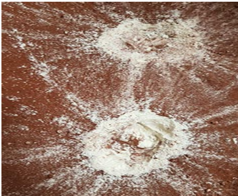
Slika 2.13: Pokus površina Mjeseca