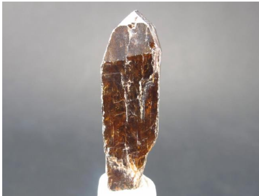
Slika 4. Kristal ksenotima dugačak oko 3 cm.