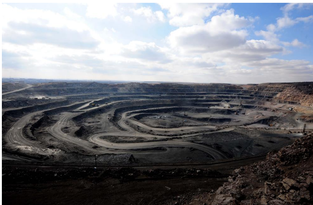
Slika 6. Bayan Obo površinski iskop u Kini.

Najveće koncentracije REE u Kini se nalaze na ležištu Bayan Obo (slika 6). Za ovo ležište pretpostavlja se da je najveće ležište REE u svijetu. Formiralo se sredinom proterozoika kao posljedica riftinga. Ovo ležište je stratabound tipa u kojemu je stijena domaćin dolomit. Proteže se 18km u duljinu i dijeli se na tri rudna tijela – glavno rudno tijelo, istočno i zapadno. Otkriveno je oko 170 mineralnih vrsta, a ekonomski najvažniji su bastnašit i monacit za eksploataciju elemenata rijetkih zemalja (prvenstveno LREE), i željezoviti minerali (hematit i magnetit) za eksploataciju željeza (Walters i sur., 2015).