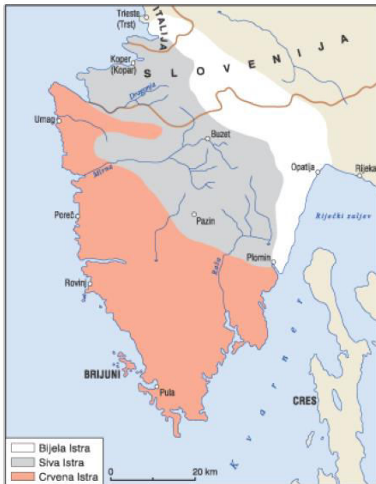
Slika 5.: Karta Istre podijeljena u tri zone – Bijela Istra, Siva Istra i Crvena Istra

Srkoč (2017) u svome radu navodi: „Ugljen je taložen u nekoliko odvojenih bazena stare kredne depresije, a unutar liburnijskih slojeva u podini, dolaze kredni rudistni, a u krovini paleogenski miliolidni vapnenci. Ugljen Labinskog bazena i Podpićana je vrlo homogen, pretežno svijetlog sjaja, bez vidljive slojevitosti. Crn je s tamnim smeđim crtama (Slika 2.). U najnižem krednom sloju ugljen je vrlo tvrd, dok je u višim slojevima mekši i drobljiv. Lom mu je uglavnom nepravilan. Ponegdje se vidi rumeni sitno raspršeni sulfid.“