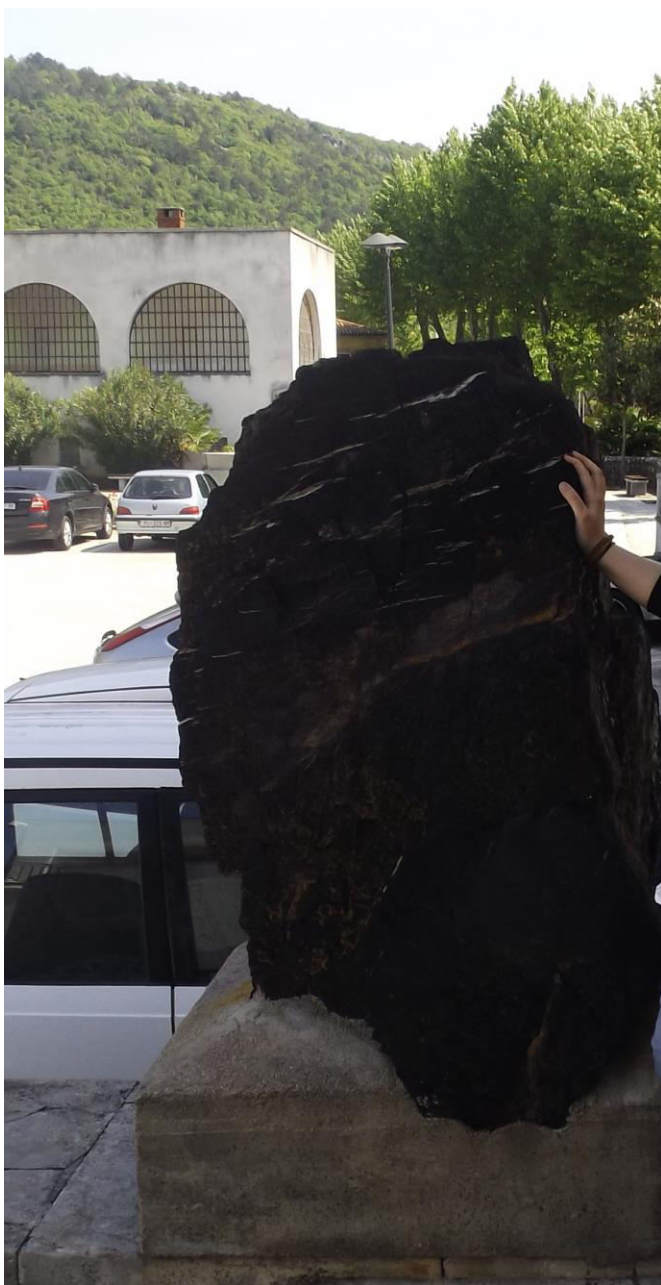
Slika 2.: primjer Raškog ugljena, spomenik višestoljetne tradicije rudarenja na području Općine Raša; privatna fotografija sa terenskog istraživanja u svibnju 2019. godine.

Raški ugljen je specifična vrsta ugljena i jedino se može pronaći na području Istarskog poluotoka, odnosno na području Labinštine. Ono što Raški ugljen čini posebnim je visoki udio organskog sumpora (i do 14%), a također sadrži i visoke udjele selena (Se), vanadija (V) i urana (U) (Medunić i sur., 2016 ; Fiket i sur., 2018). (Slika 2.)