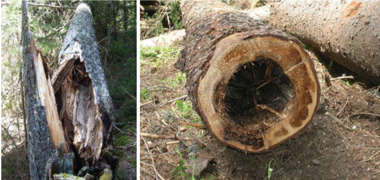
Slika 2. Infekcija i propadanje srži norveške smreke uzrokovano gljivom H. parviporum u vjetrom srušenom (lijevo) i posječenom (desno) stablu (preuzeto iz: Garbelotto i Gonthier 2013).

2). Vrste H. annosum s.s. i H. irregulare učinkovitije su od ostalih vrsta u infekciji bjelike i kambija stabla, stoga izazivaju i brže sušenje (Greig 1998, citirano u Garbelotto i Gonthier 2013).