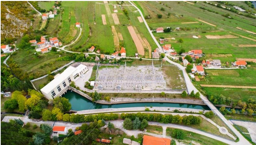
Slika 8: HE Orlovac

te dijelova općine Vrlika i grada Knin. Izvorišta Ruda i Kosinac koriste se za vodoopskrbu Sinja i Trilja. Osim toga, izdane su koncesije za punionice vode iz bunara Cetine i izvorišta Ruda Velika. Na području parka voda se koristi i za dobivanje električne energije. Na području Parka prirode Dinara nalaze se dvije hidroelektrane: hidroelektrana Orlovac na Cetini (slika 8) i minihidroelektrana Krčić. Na rubnom dijelu parka nalazi se hidroelektrana Peruća na akumulacijskom jezeru Peruća te iako HE i jezero nisu na samom području parka, imaju vrlo velike utjecaje na rijeku Cetinu. Za rad HE Orlovac voda se prikuplja na Livanjskom polju u Republici Bosni i Hercegovini. Vode s područja parka koriste se i za navodnjavanje, no tek pojedinačno i improvizirano na poljima uz Cetinu ( https://www.voda.hr/ , 2019).