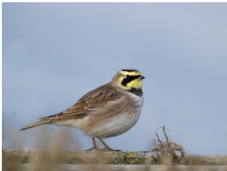
Slika 7: Planinska ševa ( Eremophila alpestris )

Kad se uzme u obzir da ornitofauna Hrvatske broji oko 399 vrsta (Tutiš i sur., 2013), područje Dinare sa 191 vrstom broji otprilike polovicu svih vrsta ptica Hrvatske.