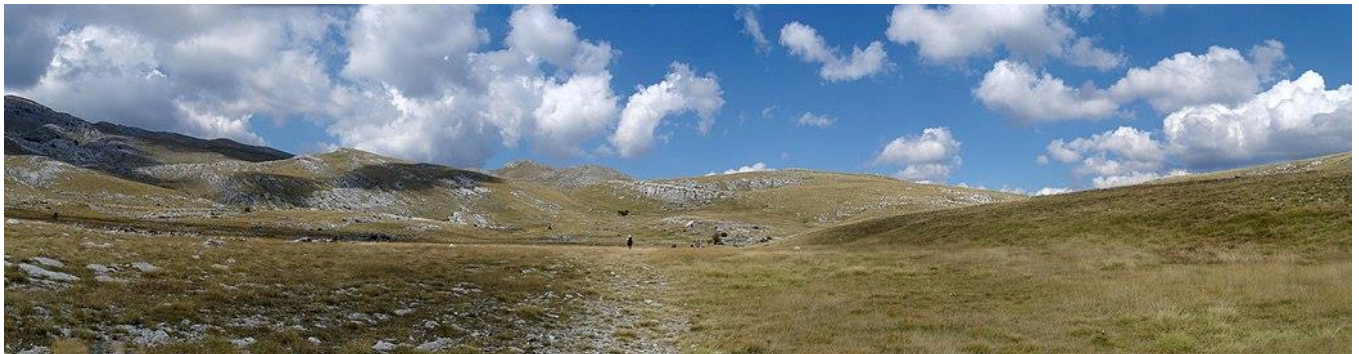
Slika 3: Zaravan od sela Glavaš do Sinjala (preuzeto s

Planine Dinara, Troglav i Kamešnica, čiji su dijelovi na području parka, morfološki čine jednu cjelinu te je masiv Dinare drugi najduži u Hrvatskoj, s dužinom od 84 km i širinom 7-15 km. Dinara ima veliki nagib te su jugozapadne padine strmije od sjeveroistočnih. Ovo planinsko područje karakteriziraju mnogi rasjedi, odsutnost površinskih vodenih tokova, karbonatni sastav stijena, pukotine i jaruge te degradirana vegetacija (Baučić, 1967). Na ovom reljefnom obliku intenzivno je ispiranje tla. Najčešći reljefni oblik na području parka su zaravni, s uzvišenjima i udubljenjima (slika 3) te mnogim ponikvama. Najvjerojatnije su nastale erozijom i korozijom u gornjem pliocenu. Najviše zaravni nalazi se u slivu Cetine i prate tok rijeke na različitim nadmorskim visinama. I na ovom reljefnom obliku najintenzivniji proces je ispiranje tla. Kroz krška polja (na primjer Paško, Hrvatačko, Vrličko) teče Cetina i odvajaju ih uzvišenja te su mnoga okružena zaravnima. Krška polja imaju različita tla zbog ispiranja, naplavlivanja i akumulacija. Dolinu Cetine može se podijeliti na tri dijela: kompozitnu, kanjonsku i flišku. Kanjon Cetine je različite širine i ima mnoga siparišta (Novosel, 2012).