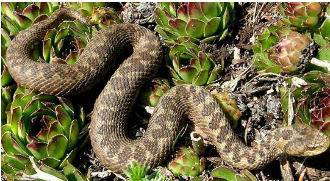
Slika 6: Planinski žutokrug ( Vipera ursinii macrops )

žutokruga u Hrvatskoj zbog same veličine područja i minimalne ugroženosti vrste zbog nekorištenja prostora i općenite nepristupačnosti terena. Što se tiče čovječje ribice, populacija s područja parka je dio veće populacije Dalmacije, koja je jedna od tri populacija čovječje ribice u Hrvatskoj. Unutar samog Parka prirode Dinara zabilježena je na dva lokaliteta, no treba uzeti u obzir da su podzemna staništa parka vrlo slabo istražena.