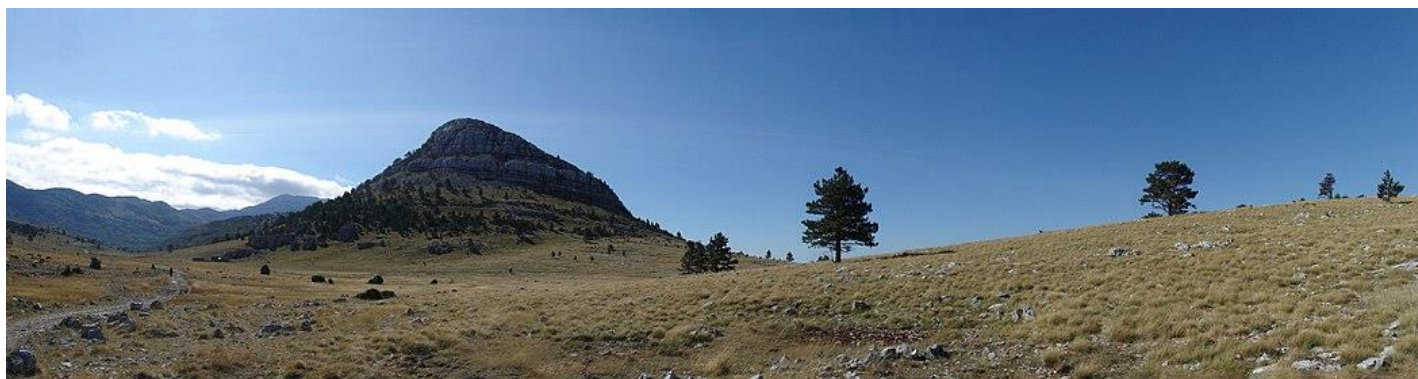
Slika 4: Suhi travnjak s pojedinačnim stablima bora