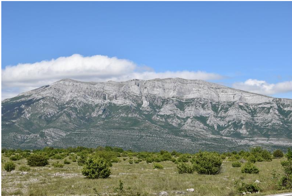
Slika 1: Pogled na zapadni greben Dinare

Park Prirode Dinara najmlađi je park prirode Republike Hrvatske, proglašen u veljači 2021 godine „Zakonom o proglašenju Parka prirode Dinara“ (Anonymous, 2021). Dinarski je krš međunarodno priznat fenomen. Područje Dinare bogato je endemičnim i ugroženim vrstama. Osim toga, Dinara (Sinjal) najviši je vrh Republike Hrvatske. Masiv Dinare (slika 1) područje je od značaja za Republiku Hrvatsku te se od 2009. godine skupljaju podaci o biološkoj raznolikosti, geološkim fenomenima, ekološkim osobinama, kulturnoj baštini i drugim posebnostima šireg područja Dinare. Stručna podloga za kategoriziranje Dinare parkom prirode (Basrek i sur., 2013) izrađena je 2013. godine, a dorađena je 2020. godine (Basrek i sur., 2020). Udruga Biom pokrenula je projekt „Dinara back to LIFE“ ( https://dinarabacktolife.eu/ , 2021) u trajanju od 2021. do 2023. godine i provedeno je nekoliko studija, praćenja stanja i neke aktivnosti očuvanja prirode Dinare. Glavni izvor podataka za izradu ovog seminara je „Park prirode Dinara – stručna podloga za zaštitu“ Zavoda za zaštitu okoliša i prirode (Basrek i sur., 2020).