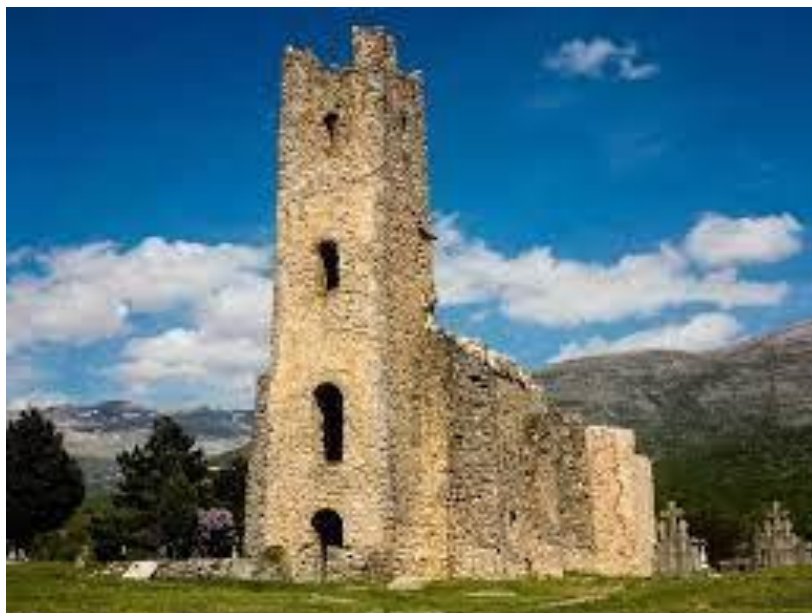
Slika 9: Crkva sv. Spasa u naselju Cetina

rimskih ostataka i predhrvatskih ranokršćanskih ostataka te na kraju već spomenutih ranohrvatskih ostataka. Mnogi od predmeta nađenih na ovom cetinskom području čuvaju se u Muzeju Cetinske krajine u Sinju, Arheološkoj zbirici Franjevačkog samostana u Sinju i u muzejima u Splitu i Zagrebu (Leko, 2012).