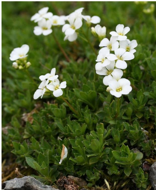
Slika 5: Skopolijeva gušarka ( Arabis scopoliana Boiss.)

Od nabrojanih 1164 svojti, 75 su hrvatski endemi (Nikolić i sur. ,2015). Od endema u Parku prirode Dinara nalaze se Skopolijeva gušarka ( Arabis scopoliana Boiss.)(slika 5), ilirska perunika ( Iris illyrica Tomm.), razgranjena portenšlagija ( Portenschlagiella ramosissima (Port.) Tutin), Arduinov dubačac ( Teucrium arduini L.). Od stenoendema tu se nalaze dalmatinsko zvonce ( Edraianthus dalmaticus (A.DC.) A.DC.), jadranska perunika ( Iris pseudopallida Trinajstić), dalmatinski bor ( Pinus nigra Arnold ssp. dalmatica (Vis.) Franco, pustenasto devesilje ( Seseli tomentosum Vis.) i jadranska ljubica ( Viola suavis M.Bieb. ssp. adriatica (Freyn) Haesler).