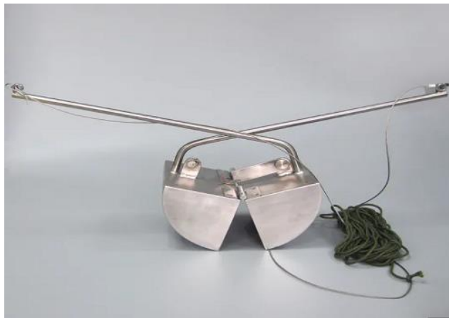
Slika 2. „Van Veen grab sampler“ - preklopna kanta izrađena od nehrđajućeg čelika (web 1)

Strategija uzorkovanja sedimenta ovisi o tome prikupljaju li se uzorci s obale ili iz korita rijeke (Shazani i sur. 2021). Sedimenti s obale skupljaju se pomoću žlica ili lopata od nehrđajućeg čelika na dubini 2 do 5 cm od površine, a raspored uzorkovanja je mrežni (Shazani i sur. 2021). Za prikupljanje sedimenta iz korita rijeka koriste se instrumenti kao što je „Van Veen grab sampler,, (Slika 2) (Shazani i sur. 2021).