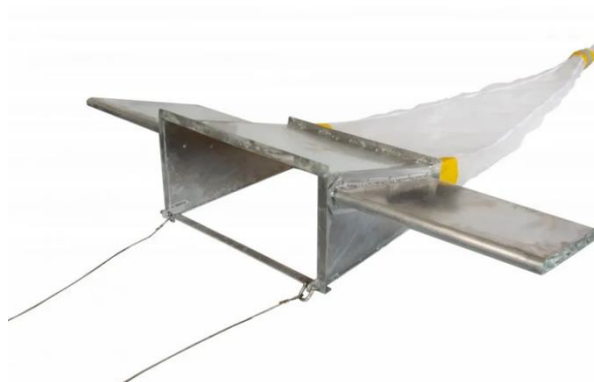
Slika 3. Manta mreža za površinsko uzorkovanje mikroplastike (web 2)

Odabir metode prikupljanja mikroplastike iz slatkovodnih sustava ovisi o ciljevima istraživanja (Mendoza i Balcer 2019). Za uzorkovanje površinskih voda rijeka i jezera najčešće se koriste „Manta“ mreža (Slika 3.) i planktonske mreže različitih veličina otvora (Dris i sur. 2015). Ovakav se tip uzorkovanja najčešće koristi za određivanje brojnosti i koncentracije mikroplastike u velikom volumenu površinske vode (Shazani i sur. 2021).