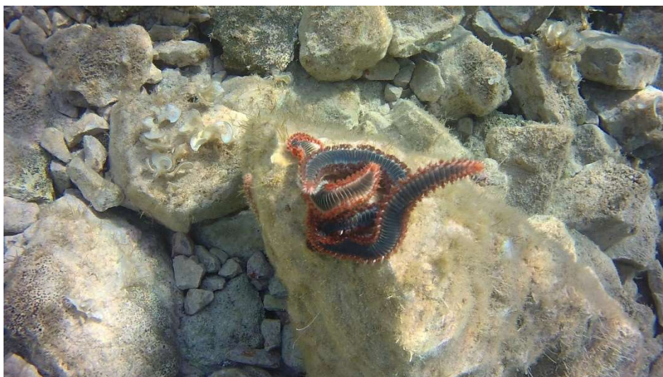
Slika 3. Tipičan položaj grupe H. carunculata pri parenju. Vidljivo je mahanje anteriornim dijelom tijela pri širenju gameta.

H. carunculata vrlo često se navodi kao vrsta s pelagičkim ličinačkim stadijem zvanim rostrarija koji ima velik potencijal rasprostranjivanja. No o ličinačkom razvoju mnogočetinaša zaključuje se gotovo isključivo iz uzoraka planktona, među kojima je opisan i stadij rostrarije, ličinke s više kolutića i dva pipka za hranjenje za koju je predložen i naziv „juvenilni planktonski stadij“ zbog odvedenosti tjelesnih struktura (Tosso i sur., 2020). Stadij rostrarije podrazumijevao bi odbacivanje četina za plivanje kakve pokazuju metatrohofore Hermodice carunculata pa je, u svjetlu novijih istraživanja, sve manje uvjerljiv kao jedan od razvojnih stadija H. carunculata (Tosso i sur., 2020).