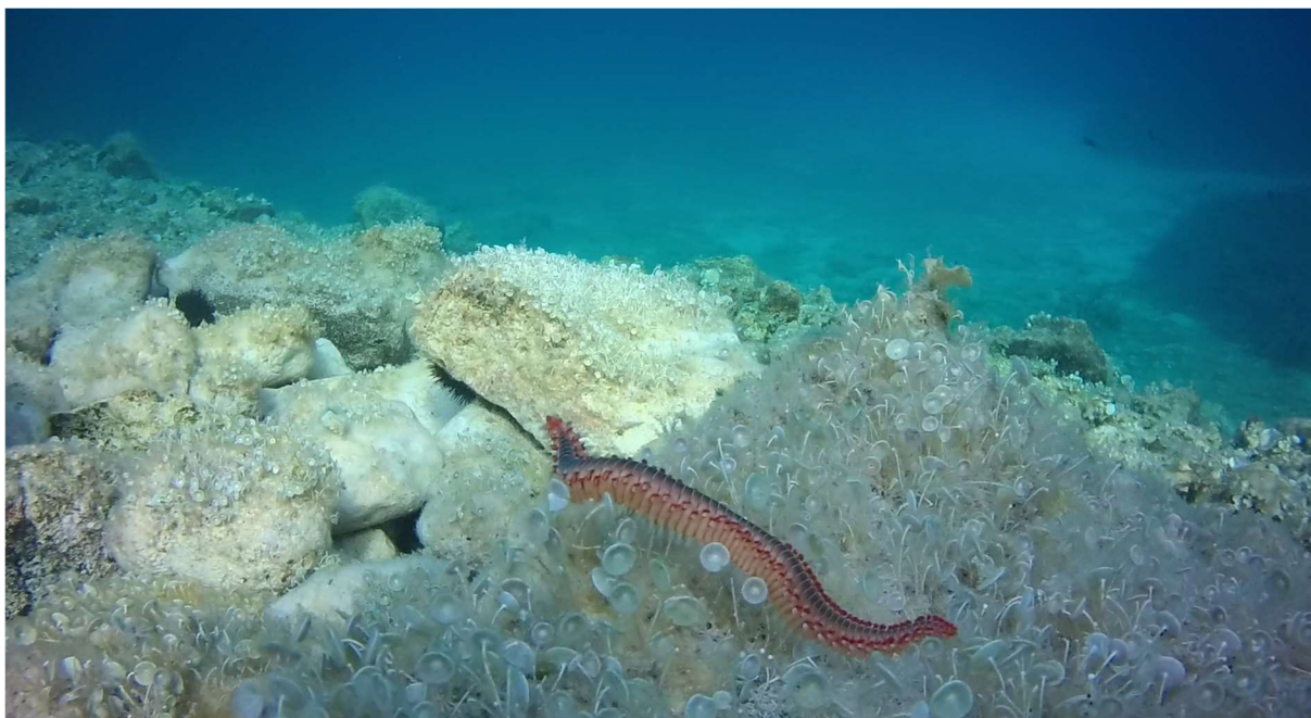
Slika 2. Jedinka H. carunculata na kamenitom dnu pri dubini od oko 2 metra. Crni kolutići omeđeni su dvama crvenim linijama uz koje se nalaze i bijele četine (snimio M. Vodopija).